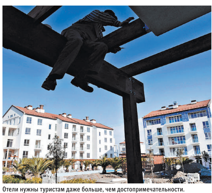
Отели нужны туристам даже больше, чем достопримечательности.

Туристический бизнес получит льготные кредиты на строительство отелей: их будут выдавать под 3–5% годовых на срок до 15 лет