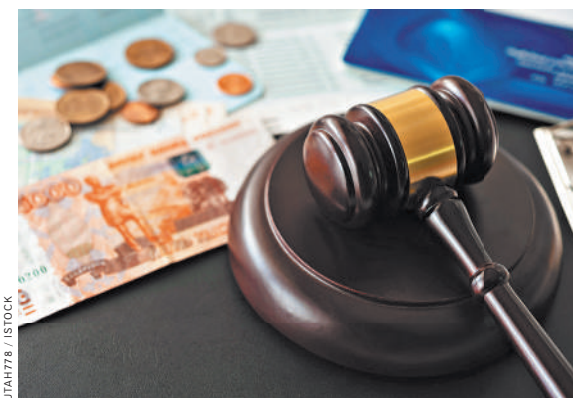
Если бывший супруг при выплате алиментов утаивал часть своих доходов, то долг ему придется погасить, указал ВС.

Он решил оспорить сумму в 5 миллионов рублей и просил суд признать незаконными постановления о расчете задолженности по алиментам. А его долг признать погашенным. В обоснование своих требований он представил суду то самое письмо бывшей супруги, которое она когда-то направляла приставам и в котором она подтверждала, что бывший муж все долги по алиментам заплатил и долгов перед ребенком у него нет. Эти аргументы выслушал Подольский городской суд и признал незаконным начисления задолженности за пять лет, ко-