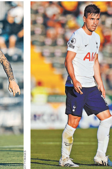
Ло Чельсо перешел в «Тоттенхэм» летом 2019 года.

Санитарно-полицейская операция в Сан-Паулу удалась. Матч между Бразилией и Аргентиной прервали уже на седьмой минуте.