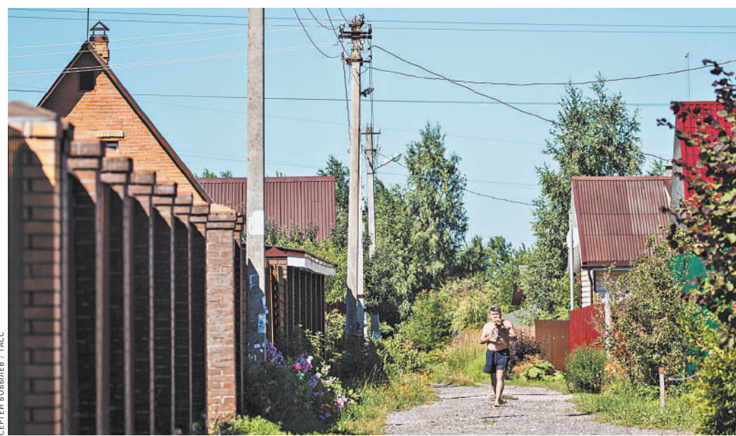
За инфраструктуру дачного поселка, в том числе и за фонари, надо платить, только если это все работает.