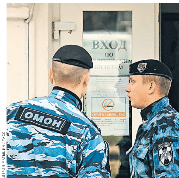
Большее количество тревожных вызовов в службы охраны приходит из школ.

Мужчина начал кричать на воспитателя на глазах испуганных детей. Охранник, не долго думая, вызвал экипаж группы быстрого реагирования. Сотрудники ГБР со своей стороны предложили все же проверить документы родственника и позвонить маме ребенка. Оказалось, что мама попала в больницу и попросила родственника забрать ребенка, но не предупредила об этом администрацию детского сада.