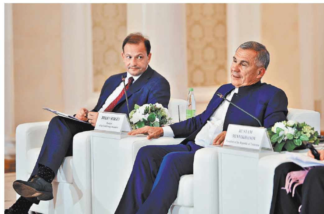
Церемония в Казани с участием главы Татарстана Рустама Минниханова стала продолжением новой традиции, когда имена лауреатов «Глобальной энергии» оглашают поочередно в известных городах России.