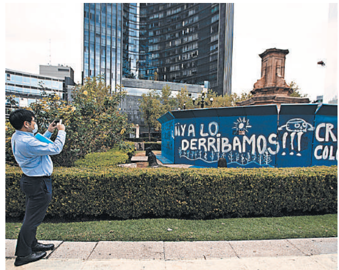
Памятник Колумбу в Мехико, который многократно оскверняли, был отправлен на реставрацию. Теперь вместо него здесь будет стоять памятник женщине из племени ольмек.

Стоит отметить, что отношение к знаменитому мореплавателю в Латинской Америке неоднозначное. Памятники в честь Колумба были установлены во многих городах. Но в последние годы они все чаще подвергаются демонтажу, а из уст политиков звучат требования к испанской монархии принести извинения за действия конкистадоров. Тенденция усилилась после начала в 2020 году протестов против расовой дискриминации в США, где за несколько месяцев было снесено свыше трех десятков памятников. В странах Латинской Америки активисты не столь агрессивны, и чаще всего выступления против Колумба сочетаются с критикой властей. ●