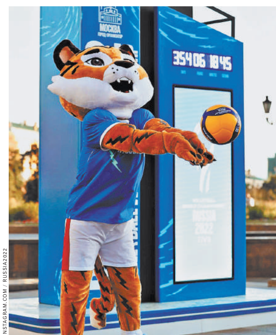
За Тигра проголосовали 46 процентов болельщиков.