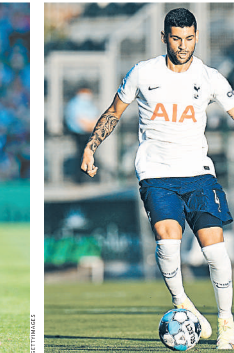
Ромеро переехал в Англию всего пару месяцев назад.