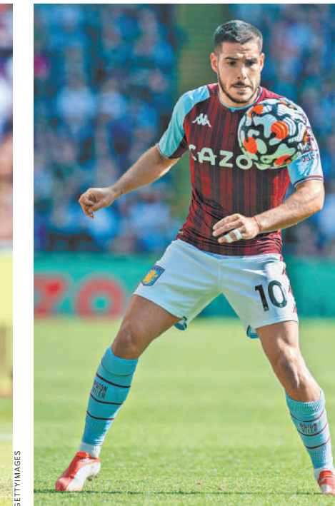
С нынешнего сезона Буэндия играет за «Астон Виллу».