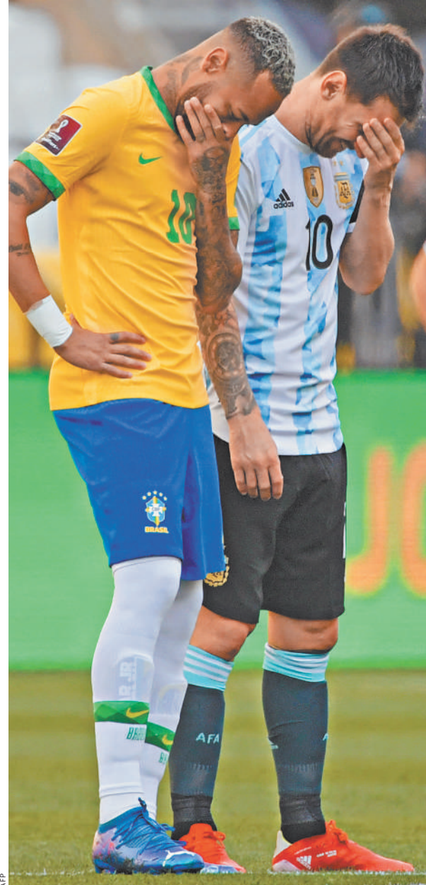
Две звезды: Неймар и Месси проиграли бразильским властям.