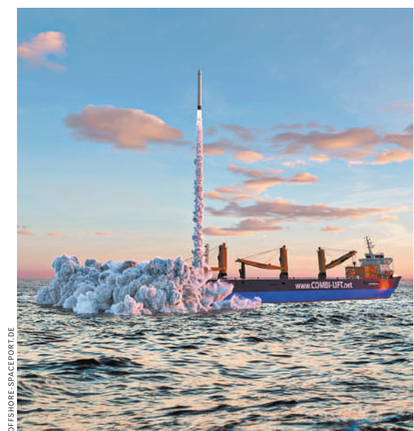
Так по замыслу немецких инженеров будут выглядеть космические пуски с частного плавучего космодрома.

Поскольку расположенный рядом Бремен является площадкой для масштабных исследований космоса, вместе они составят цепочку — от сервисного центра до космодрома. Ожидается, что она начнет функционировать в 2023 году. К 2028 году в мире, по данным СМИ, в космос будет запущено в четыре раза больше спутников, чем за последние десять лет. Почти 90 процентов из них будут приходиться на сегмент малых и микро-спутников. ●