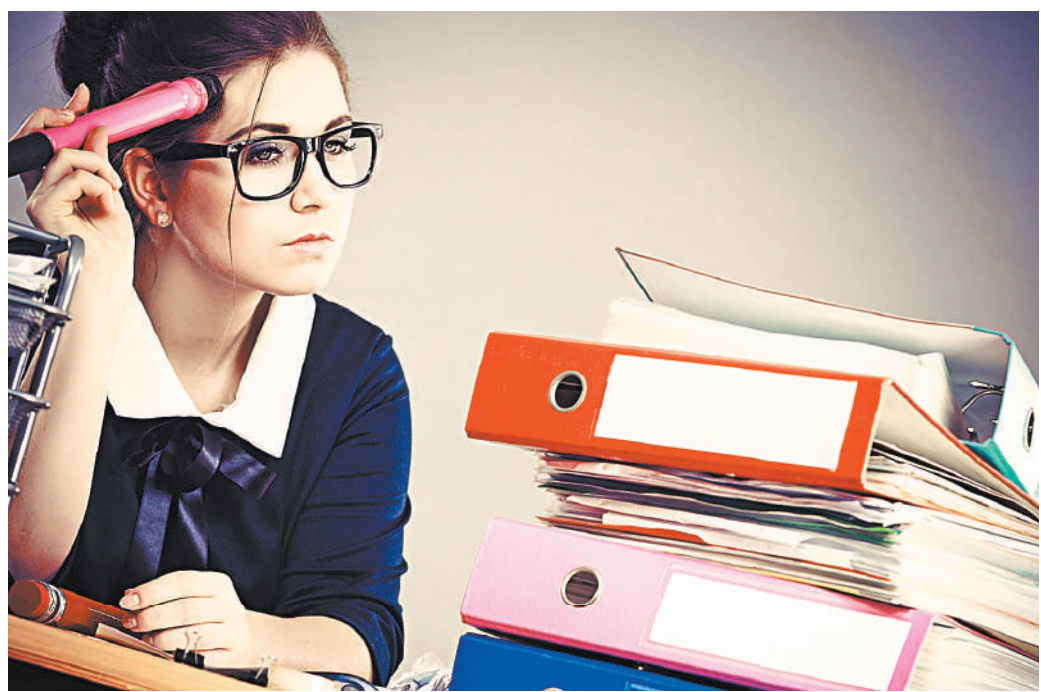
Кипы бумаг, которые нужно заполнять, подписывать и переписывать — головная боль многих учителей.

— Мне только за неделю уже «спустилось» четыре огромных отчета. Был один комичный случай: запросили отчет о мерах против курения в школе. Написал, что у нас и так нет курящих детей. На это пришел новый запрос с единственным вопросом: «Почему?» Ответил лаконично: «Не хотят».