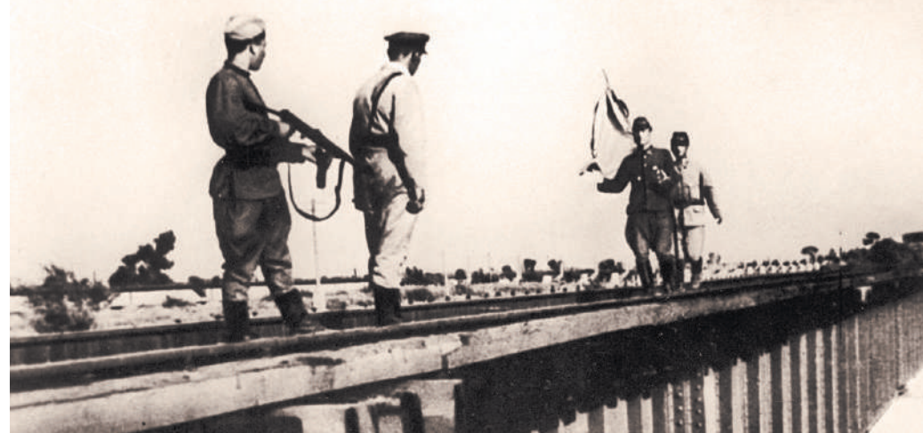
19 августа 1945 года. Красноармейцы встречают парламентариев капитулировавшей Квантунской армии.