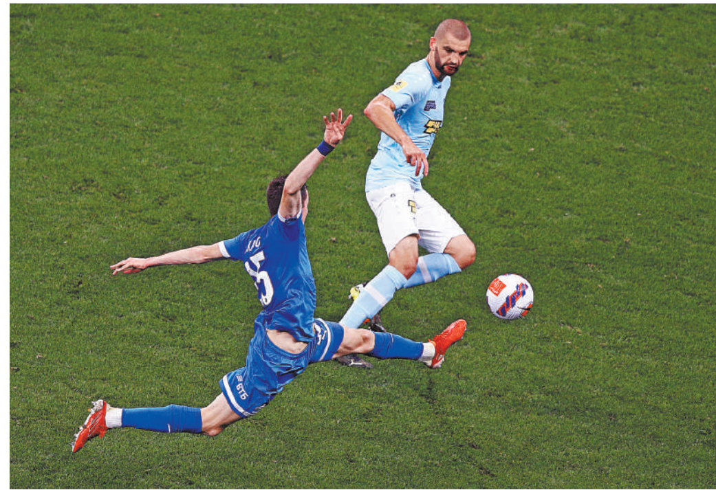
Неожиданно уступив «Нижнему Новгороду», динамовцы опустились на четвертое место в таблице.

Ребята здорово отреагировали на последние события, они большие молодцы. Конечно, нельзя не говорить восторженно о Месси. Он всегда делает разницу, в этом никогда не сомневался. Победы превозносят его, но он уже давно идиол. Горжусь, что у меня такой игрок, — отметил главный тренер аргентинцев Лионель Скалон.