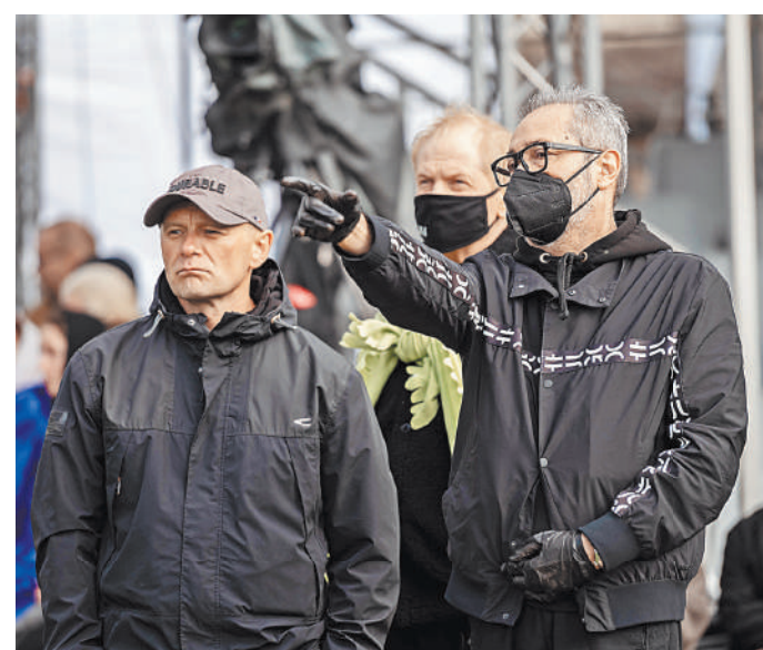
Режиссер Валерий Фокин на репетициях спектакля Национального драматического театра России.

— Александринский театр впервые открыл новый сезон не в родных стенах, не в Санкт-Петербурге. В новом пространстве — новый спектакль. Гастроли всегда сами по себе экзамен: другая публика, другой контекст. А выступление на открытом воздухе — это профессиональный вызов, особенно если учесть, что пространство псковского Кремля совсем не было приспособлено под театральное действо. Меняются способ подачи текста, мизансцены... Плюс надо было адаптироваться к погодным условиям — дикий ветер задувал в микрофоны, лил дождь, актерам было непростно. Но я считаю, это очень полезно для артистов, для их гибкости, для умения адаптироваться к любым условиям. Объединение национальных театров — важный вопрос государственной политики. Во время форума в Санкт-Петербурге мы проведем конференцию национальных театров, примем устав, зарегистрируем Ассоциацию национальных театров России и будем двигаться дальше. На сегодня национальных театров в России свыше полсотни. Планируется, что большинство из них войдет в ассоциацию. Для них будет работать еще один проект — Национальная театральная школа. Дни Александринского театра в 2022 году пройдут в Якутске, Казани и Екатеринбурге. А наша московская площадка станет Национальным театральным центром России.