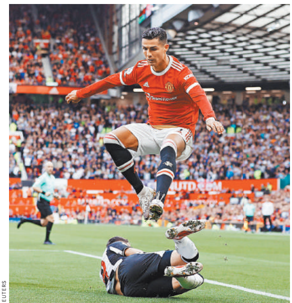
Криштиану Роналду заявил, что он вернулся в «МЮ» ради новых титулов. В частности, Лиги чемпионов.

Тем временем Лионель Месси добился очередного достижения. Оформив хет-трик в матче квалификационного турнира мира-2022 против Боливии (3:0), Месси обошел легендарного Пеле и стал рекордсменом по голам за южноамериканскую сборную (79).