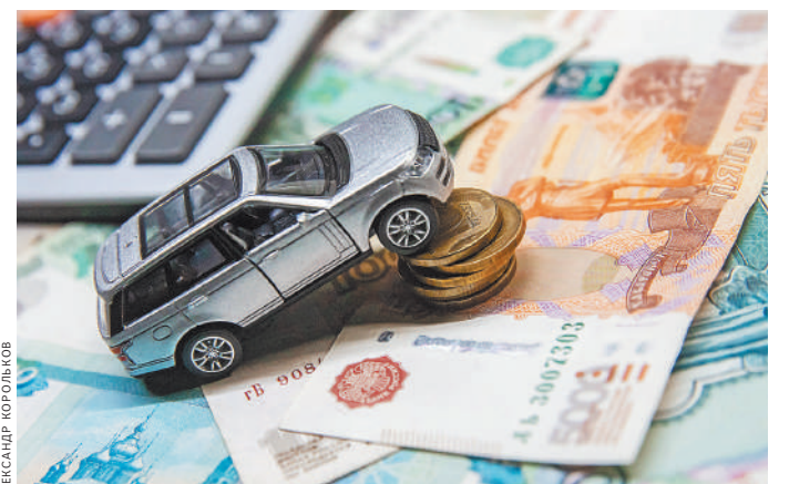
Только за прошлый год автомобили различных марок прибавили в цене 10–25%.