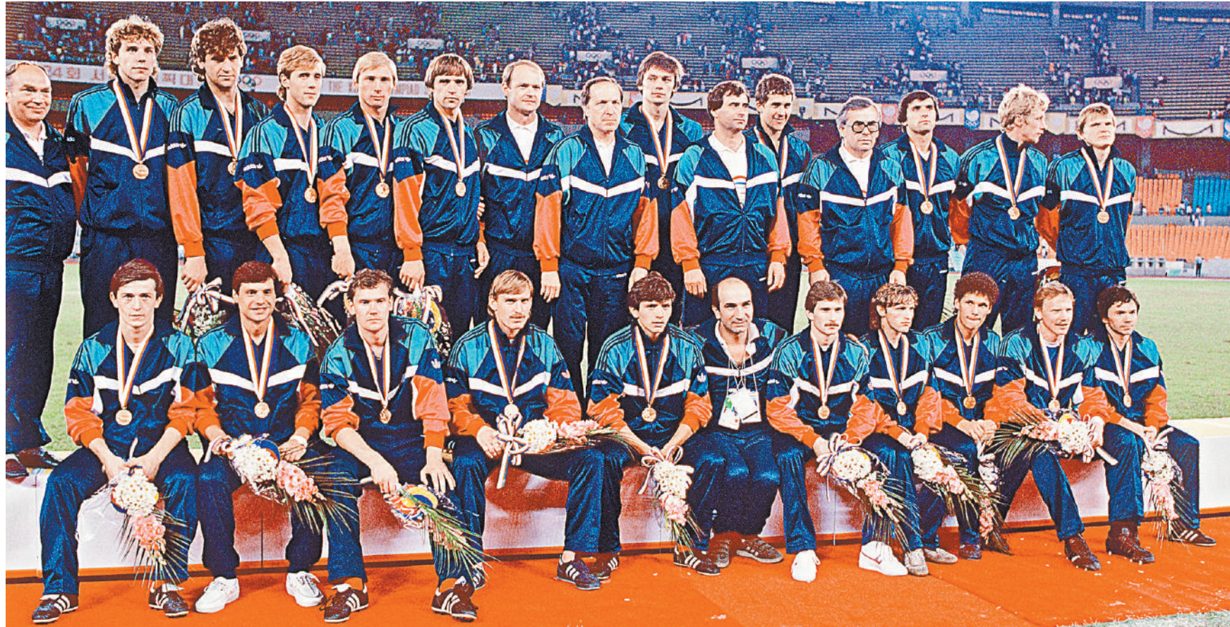
В 1988 году в Сеуле сборная СССР выиграла олимпийский футбольный турнир, победив в финале великих бразильцев во главе с Ромарио, — 2:1. Это была вторая и последняя победа советской футбольной команды на Олимпийских играх. До того золота было привезено из Мельбурна в далеком 1956 году.

Это, конечно, лучше, чем, к примеру, в 2005-м, когда 12 августа на поле в составе мо-