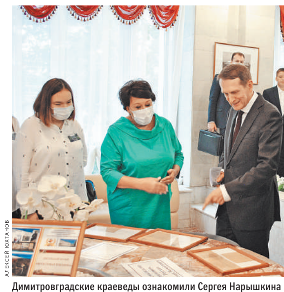
Димитровградские краеведы ознакомили Сергея Нарышкина с экспозицией, посвященной Великой Отечественной войне.

Фестиваль документального кино представил фильмы, посвященные важнейшим страницам истории нашей страны. Среди них: «Бомба. Наши в Лос-Аламосе» — о роли внешней разведки в создании ядерного щита страны. Об истории освоения Арктики рассказала документальная кинолента «Ледокол «Красин». Миссия спасать». ●