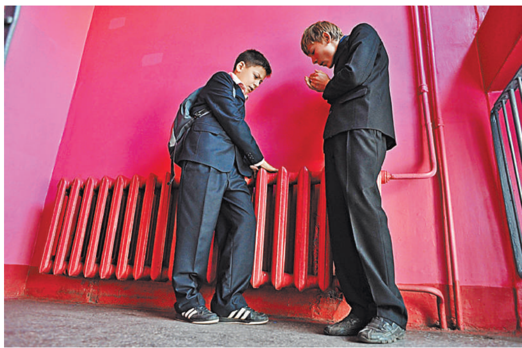
Так рано, как в этом году, москвичи просят тепла в батареях впервые.

Сейчас погода стоит нестабильная. Но со среды Москва обещают новое «арктическое дно» и сильное похолодание. Не исключено, что правительство Москвы в ближайшую неделю примет решение о начале отопительного периода и выпустит соответствующее распоряжение. Напомним, первыми, как и всегда, тепло подадут в еще не подключенные социальные объекты, затем жилые дома и последними — в офисы, магазины и промышленные предприятия. ●