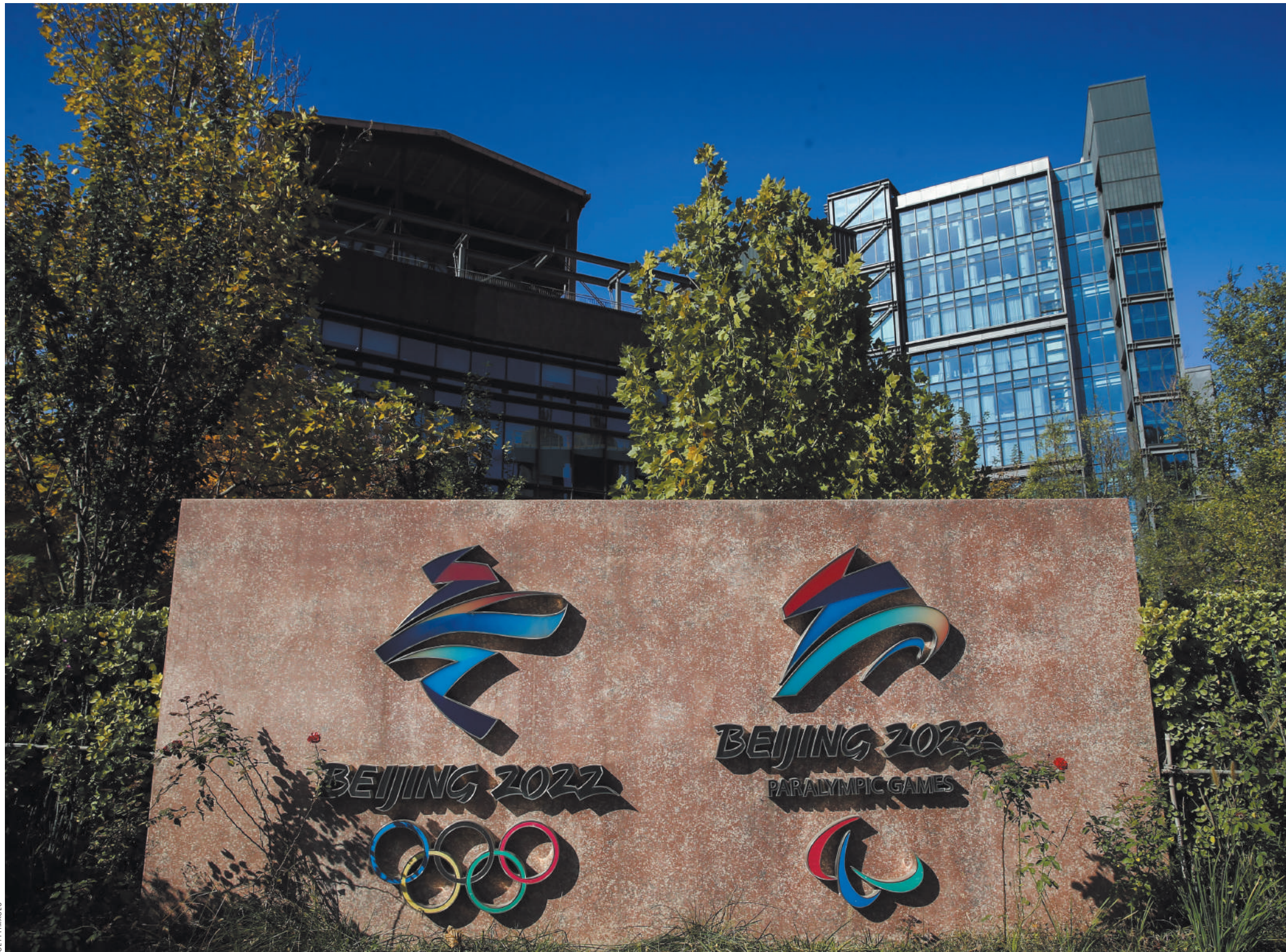
Пекин станет единственным городом в мире, который принимал и Летние (2008), и Зимние (2022) Олимпийские игры.