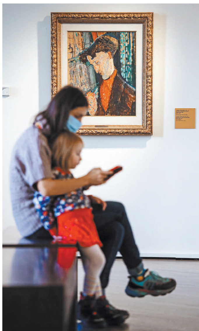
«Портрет художника Фрэнк Хэвилленда» (1914) кисти Амедео Модильяни — одна из ключевых работ в коллекции Джанни Маттиоли.

Главные ниспровергатели классического искусства стали героями-основателями нового искусства Италии XX века