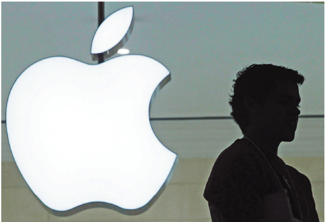
Apple и другие IT-гиганты привыкли уводить прибыль под юрисдикцию тех стран, где налоговая ставка ниже.

Так вот из 216 владельцев французских сейнеров, которые подали заявки на промысел в районе острова Джерси и в прибрежной зоне Великобритании (6–12 морских миль), лишь половине удалось получить соответствующие лицензии. Остальным было отказано.