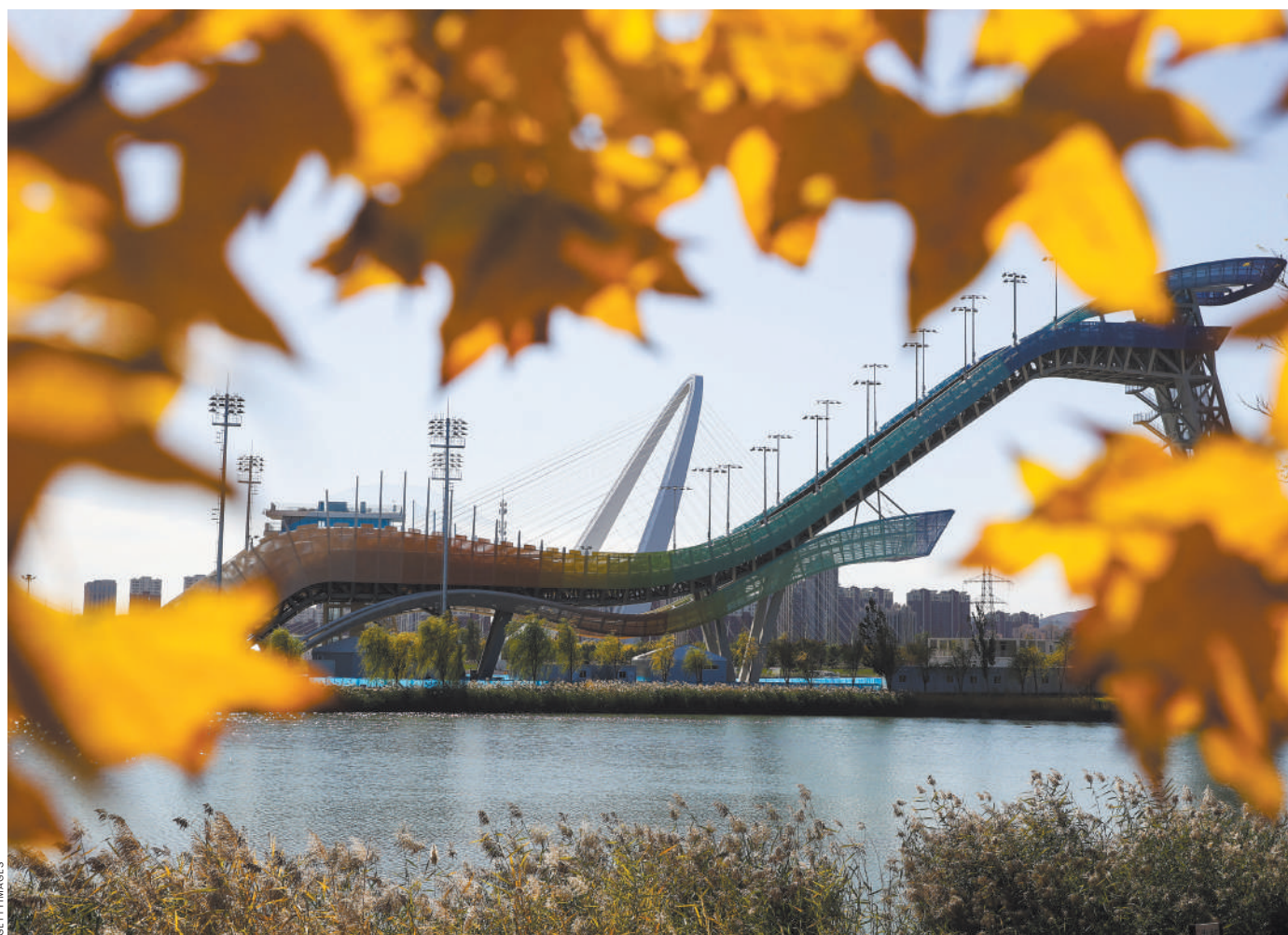
Олимпийские объекты полностью готовы к Играм.