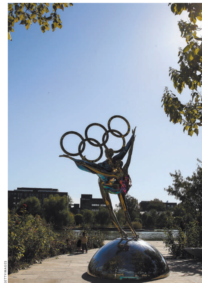
Скульптурные композиции в городе напоминают жителям Пекина, что до старта ОИ осталось совсем чуть-чуть.