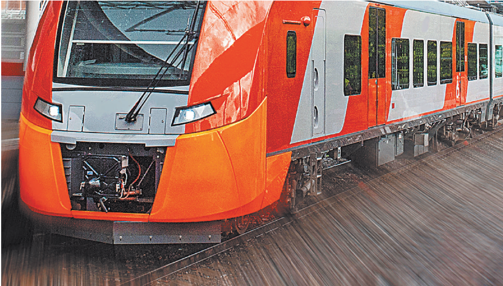
Человек погиб под колесами электрички. А потом его семье выставляют счет за ремонт поезда. И все по закону?

Взыскание компенсации выплаты потерпевшему страхового возмещения — неотъемлемая часть работы. Если бы компания не подавала иск, это могло быть расценено как нарушение действующего законодательства, отметили в «Росгосстрахе». В РЖД ситуацию комментировать не стали.