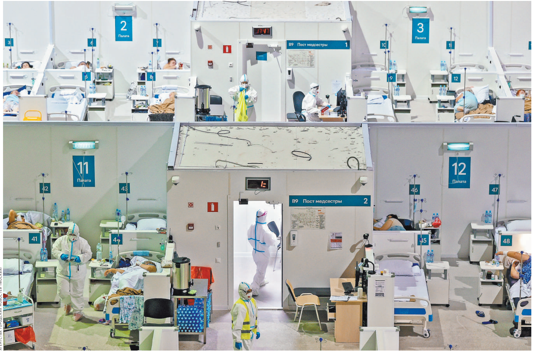
28.06.2021. Москва. Резервный госпиталь для больных COVID-19 в ледовом дворце «Крылатское».