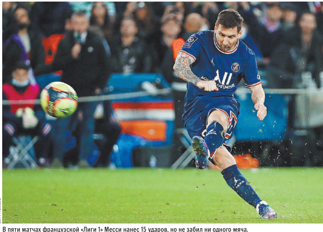
В пяти матчах французской «Лиги 1» Месси нанес 15 ударов, но не забил ни одного мяча.