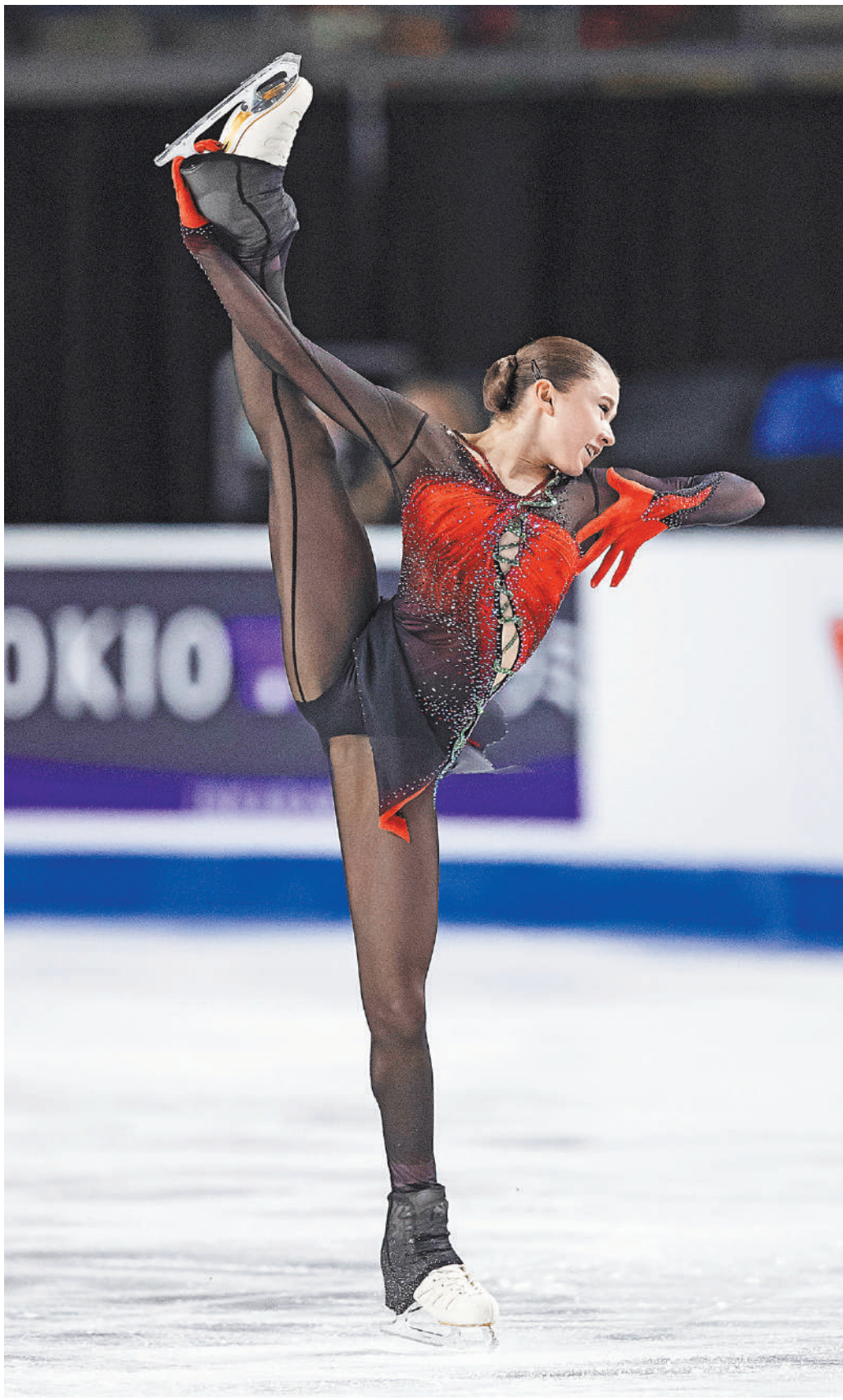
Знаменитое вращение Камиллы Валиевой в вертикальном шпагате неизменно срывает аплодисменты.

Рада, что справилась со своей работой. Были недочеты, но, к счастью, только небольшие, — приводит слова Валиевой пресс-служба Международного союза конькобежцев (ИСУ). — Сегодня я сделала все, что планировала — для меня это самое важное. Я довольна оценками, но в следующий раз постараюсь