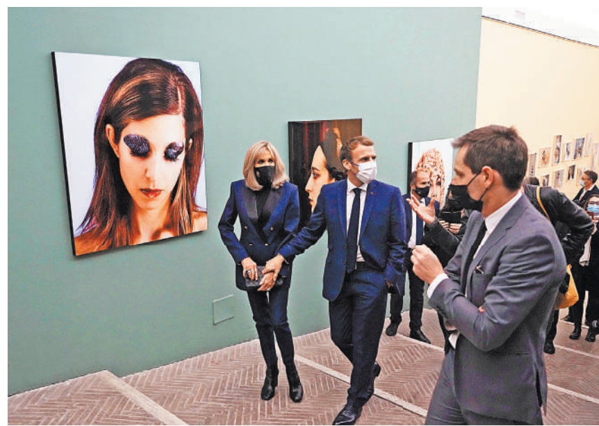
Президент Франции Эмманюэль Макрон с супругой во Французской академии в Риме.