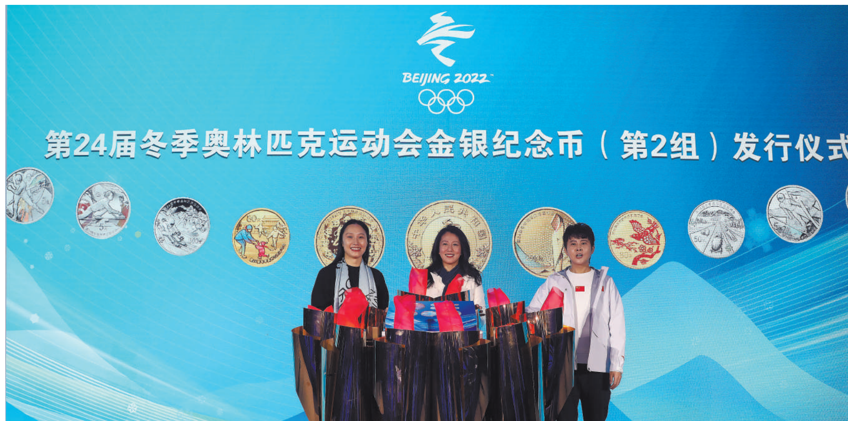
Китайский монетный двор выпустил к играм серию «олимпийских» золотых и серебряных монет.