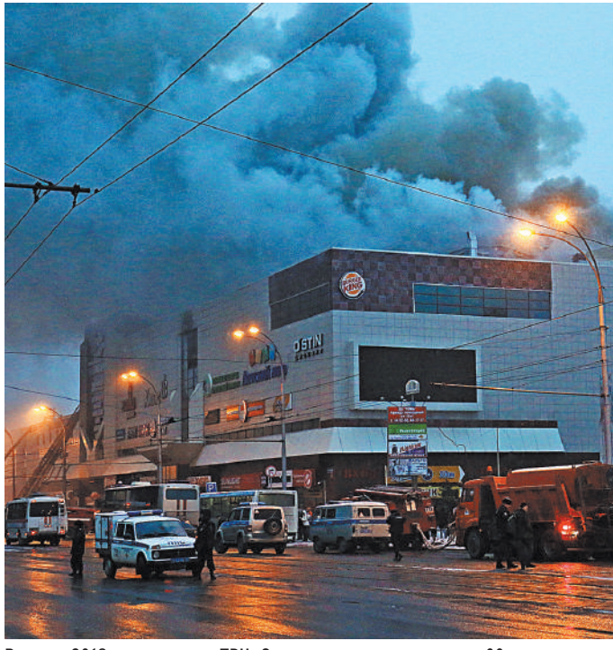
В марте 2018 года пожар в ТРЦ «Зимняя вишня» унес жизни 60 человек.