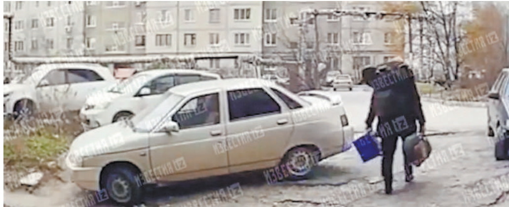
Камеры видеонаблюдения засняли Рашкина, отправляющегося с ружьем на прогулку в ночной лес.

По уголовной статье, если депутата признают виновным, он заплатит крупный штраф и даже может отправиться в колонию. Депутаты, как судьи и адвокаты, относятся к гражданам особого правового статуса. То есть к тем, кого нельзя просто так привлечь к ответственности. Только лично Александр Бастрыкин имеет право на возбуждение уголовного дела, в котором фигурирует «неприкасаемая» персона. И дать согласие на привлечение депутата к ответственности могут лишь сами депутаты, если их официально попросит Генпрокурор РФ. ●