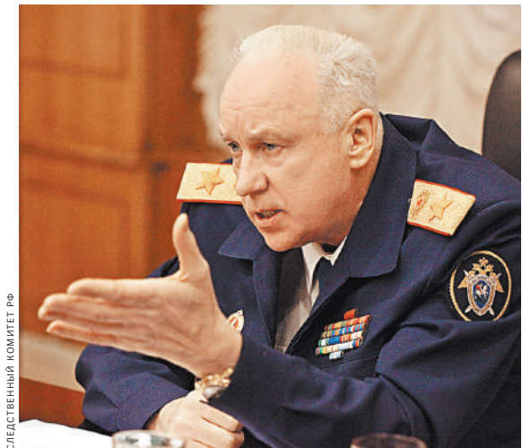
Бастрыкин велел проверить, не нарушают ли внуки закон.