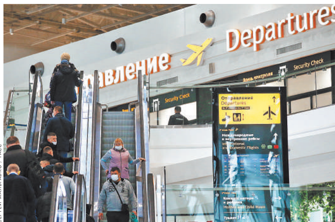
Открытие чартеров в Египет приведет к снижению стоимости туров.

По три раза в неделю самолеты будут летать из Санкт-Петербурга в Стокгольм и Гетеборг (Швеция), по два раза — из Москвы в Бангкок и на Пхукет. Также по одному рейсу в неделю авиакомпаниям могут выполнять в Бангкок и на Пхукет из аэропортов России, откуда