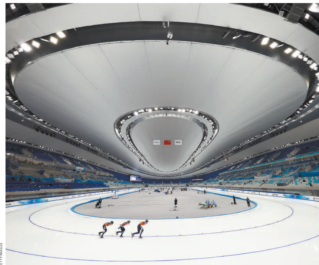
Конькобежцы по достоинству оценят качество льда.