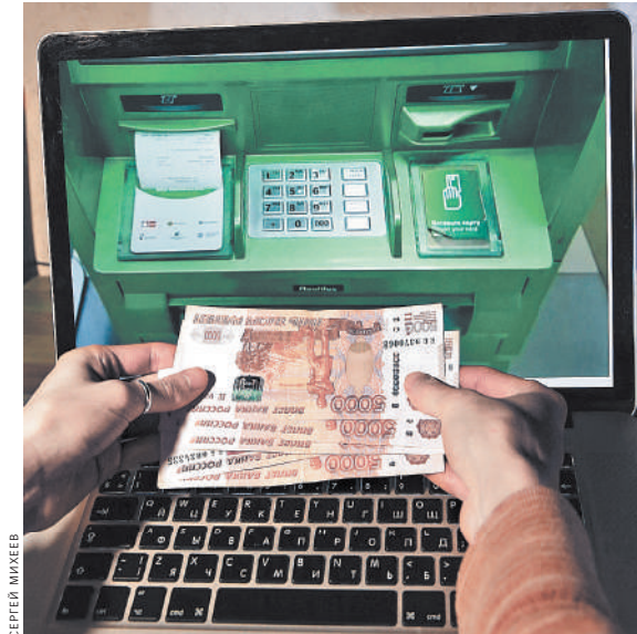
Снижение комиссии сделает более востребованными расчеты через финансовые платформы.

Граждане при переводах себе или другим физлицам на сумму до 100 тыс. рублей в месяц комиссию не платят, от 100 тыс. рублей в месяц комиссия составляет 0,5% от суммы перевода (но не более 1,5 тыс. рублей). ●