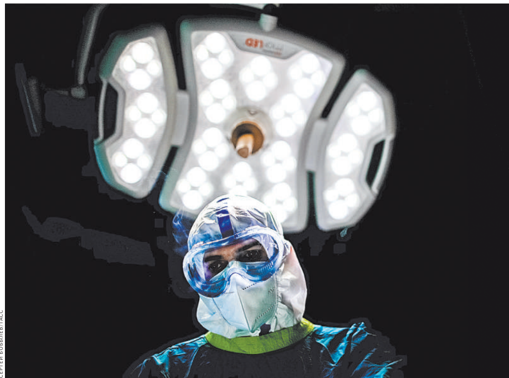
01.06.2020. Москва. Хирург в операционной временного госпиталя на территории ГКБ №15 имени О.М. Филатова.