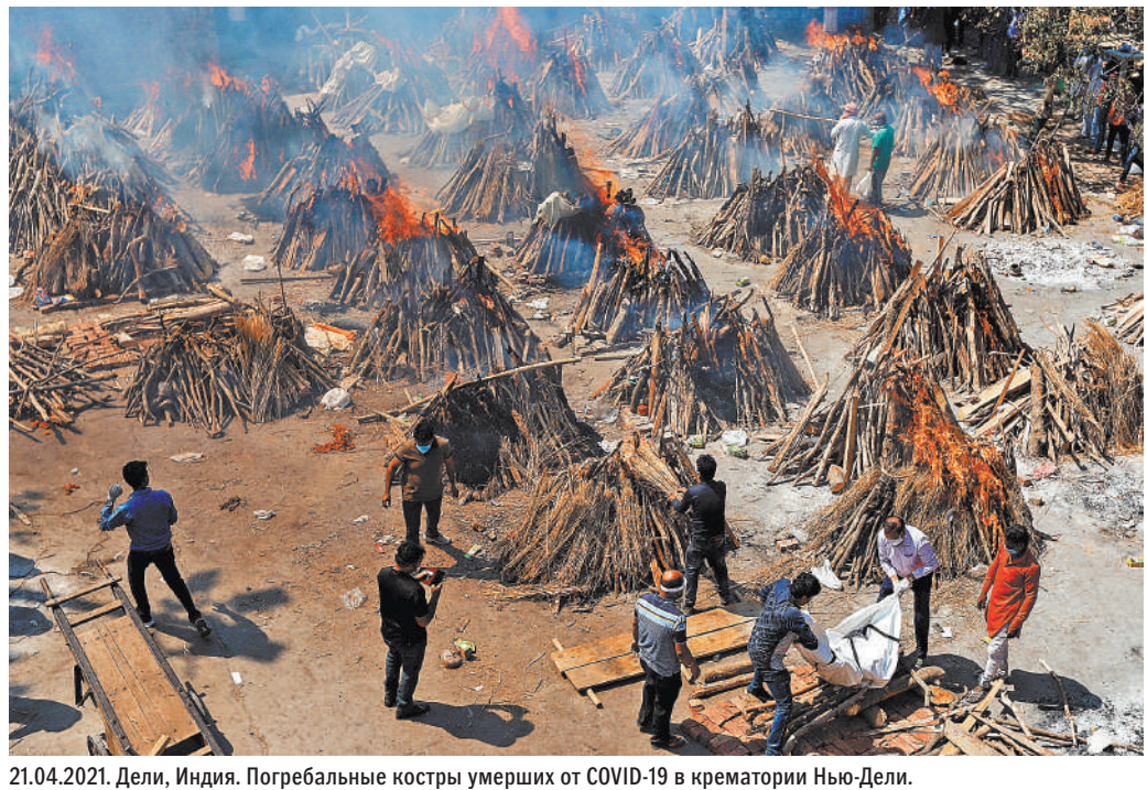
21.04.2021. Дели, Индия. Погребальные костры умерших от COVID-19 в крематории Нью-Дели.

Насколько критична угроза, которую породил коронавирус? Нужна ли сейчас всеобщая вакцинация как предупредительная мера против новых вспышек пандемии? При всей очевидности ответа в обществе на