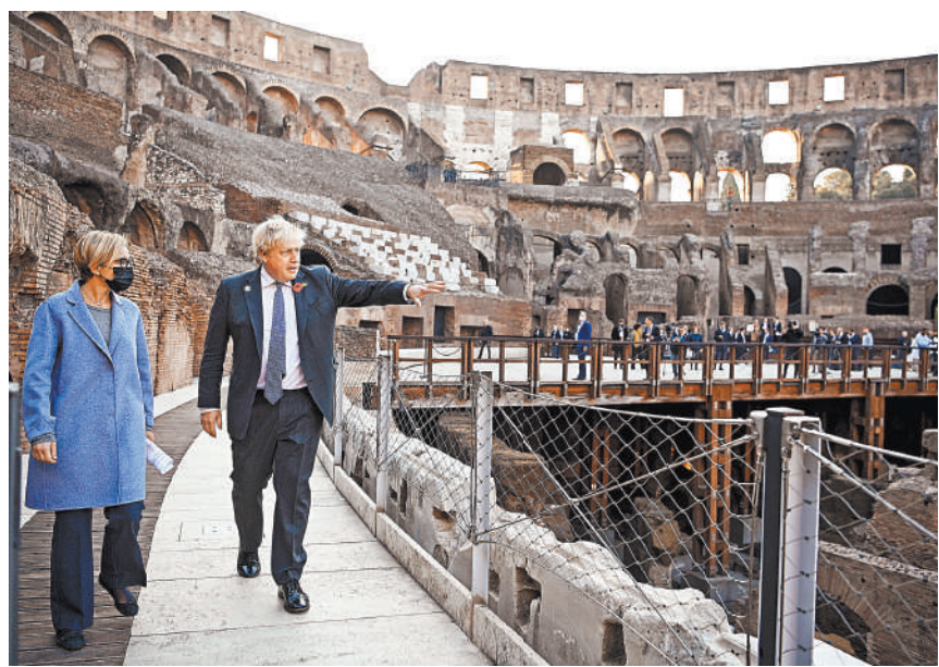
Премьер-министр Великобритании Борис Джонсон в ходе саммита посетил Колизей.

— Видео и фото смотрите на сайте rg.ru/art/2200050