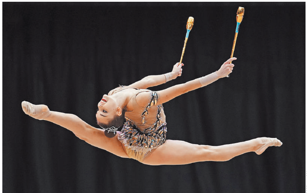
В упражнениях Дины Авериной особо ценится «трудность предмета»: будь то булавы, обруч, мяч или лента.

Увидим ли мы сестер Авериных в следующем сезоне?