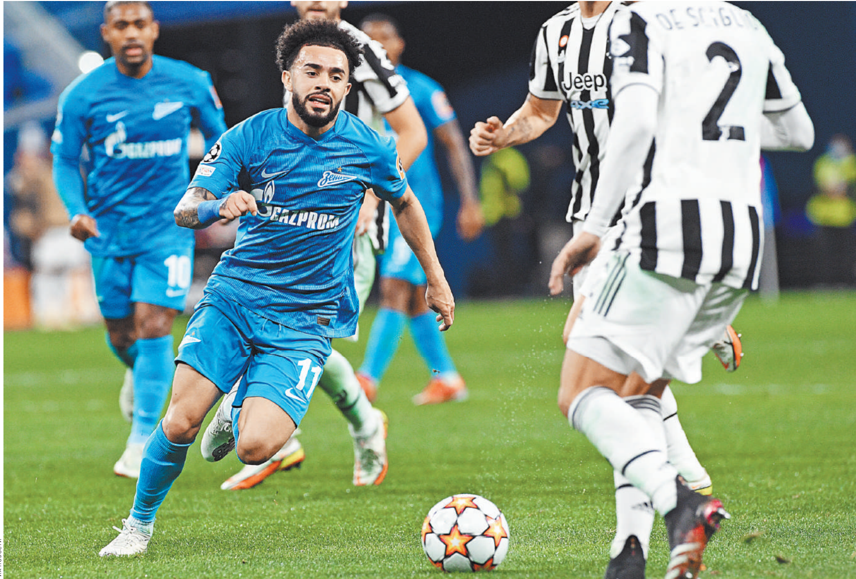
В первой встрече в Санкт-Петербурге «Зенит» проиграл в самой концовке и уступил «Ювентусу» — 0:1.

Аллегри, как и его футболисты, наверняка понимают важность предстоящего матча: в случае победы над «Зенитом»