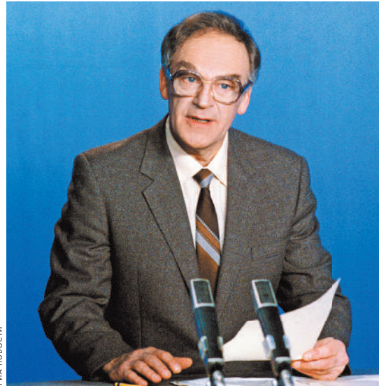
Игорь Кириллов был против хайпа, он за интеллигентный эфир. Всегда невозмутимый, а внутри — чувство повышенной ответственности.

Кириллов был против хайпа, он за интеллигентный эфир. До последнего дня он работал на Первом канале консультантом. С ним советовались, его опыт и чувство меры бесценны. Похоронит Игоря Кириллова на Новодевичьем кладбище. —