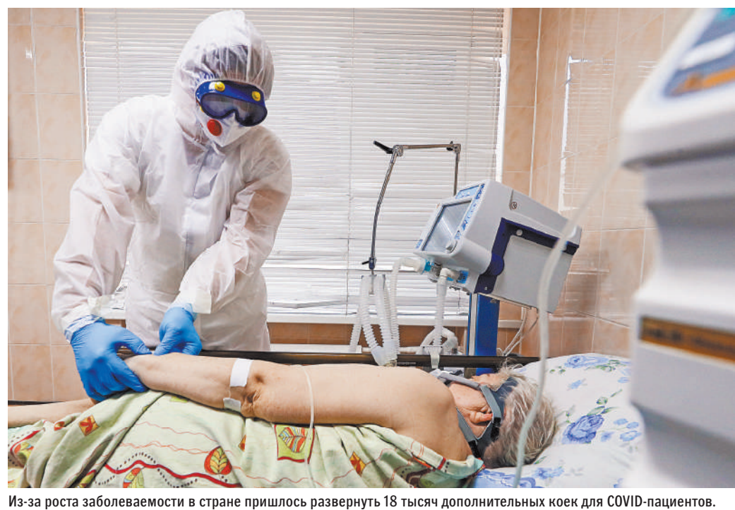
Из-за роста заболеваемости в стране пришлось развернуть 18 тысяч дополнительных коек для COVID-пациентов.

«Показатель рыночной экономики — сигнал контрагентам и партнерам, это значит, что другие страны могут не опасаться демпинга или, наоборот, разгона цен на товары. Пример — действия Китая, который не входит в число стран с рыночной экономикой, в 2018 году, когда они опустили цены на металлы почти в два раза. В результате многие перешли к Китаю, стали покупать именно их продукцию, а потом Китай резко перевел цены чуть не в двукратный рост», — сказал он. ●