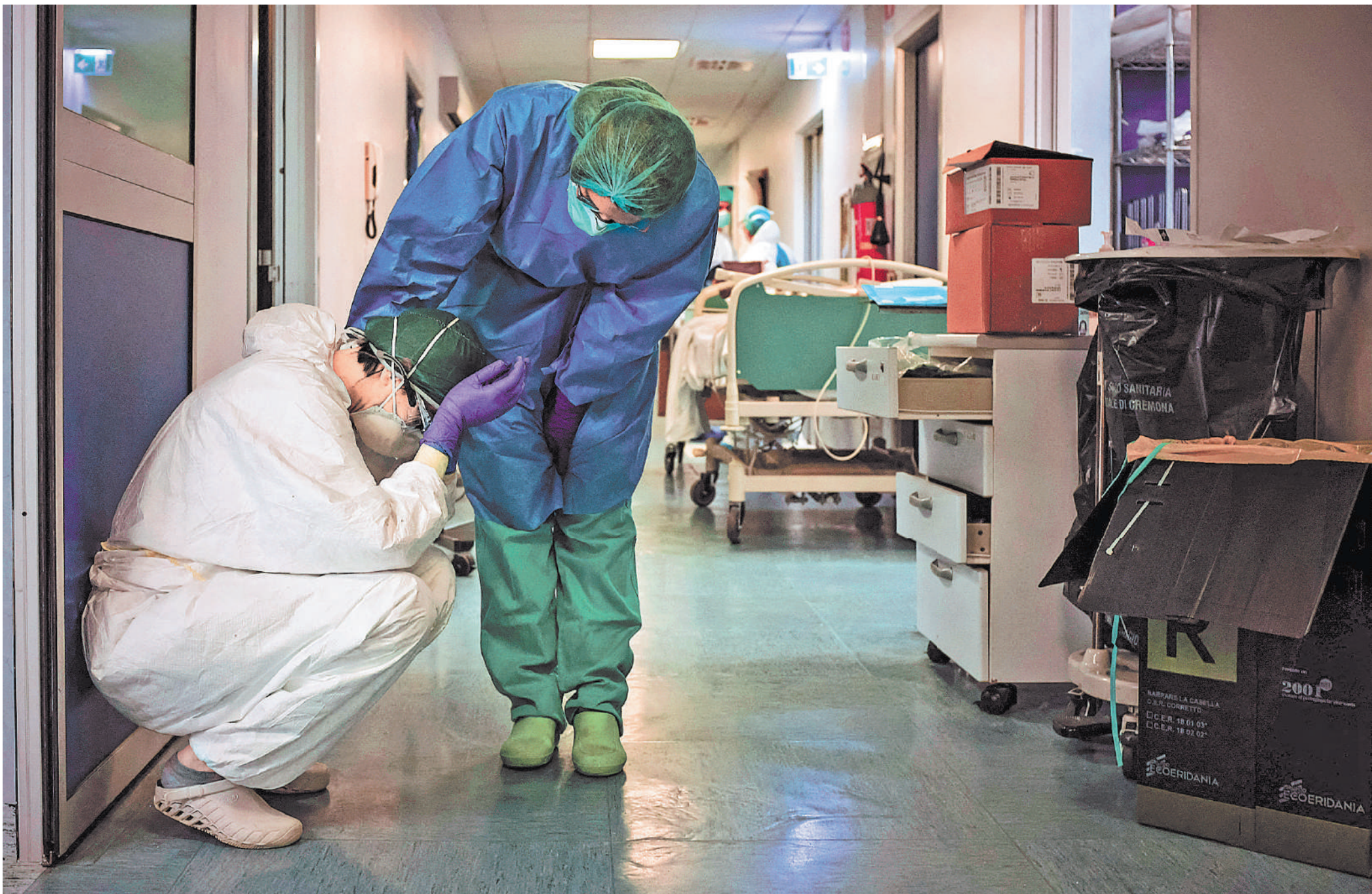
13.03.2020. Кремона, Италия. Медсестра утешает коллегу во время пересменки.

В третью фазу пандемии мы вошли летом — в начале осени прошлого года. К этому времени большинство компаний и, что особенно важно, вся система