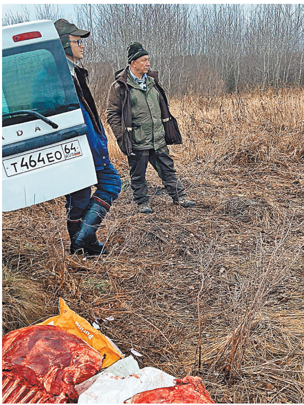
Задержанные уверяли, что найденное животное хотели отвезти лесникам. Но зачем было тогда разделять тушу?