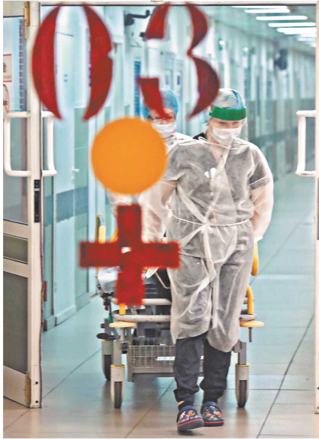
04.03.2021. Москва. Врачи везут пациента по коридору городской клинической больницы №15 имени О.М. Филатова.

общих ковид-паспортов. Хотя опыт последнего времени и показывает, что всего этого недостаточно для формирования ответственного социального поведения в кризисный период. Возможны и «обратные» способы — значительно ущемить права непривитых. Имеется в виду перевод на удаленку, отстранение от работы с людьми, уменьшение выплат из-за того, что ковид-дисиденты несут угрозу для общества. Такие методы, как уже было сказано, уже активно используются во многих странах. Безусловно, это создает определенную сегрегацию по прививочному признаку. Однако такие меры — достаточно эффективны, и у большинства они встречают понимание и поддержку. Ведь непривитые люди вредят не только себе, но и окружающим, особенно детям, которых