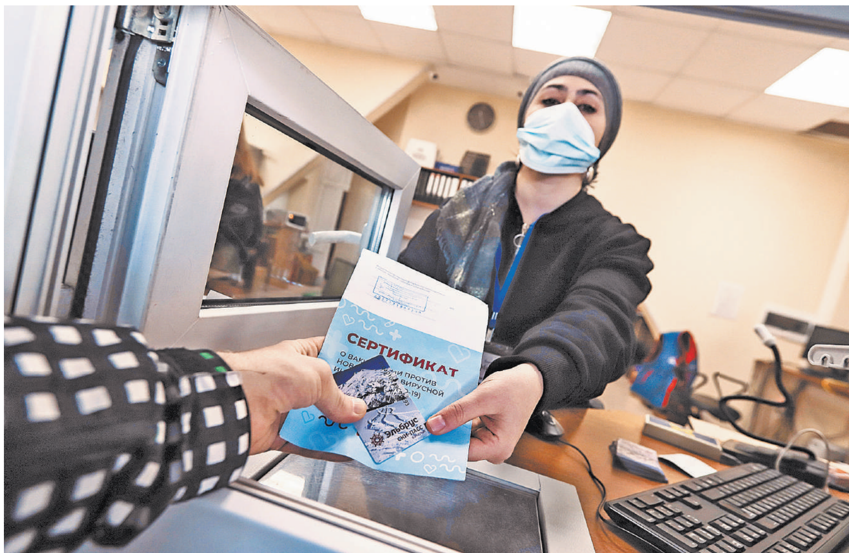
Выданные ранее сертификаты о вакцинации против COVID-19 продолжат действовать и автоматически обновятся на портале госуслуг до 1 марта 2022 года.

Вся информация направляется в «Гознак» по зашифрованному каналу, что обеспечивает сохранность информации. Отслеживать готовность паспорта можно привычными способами через каналы МФЦ. ●