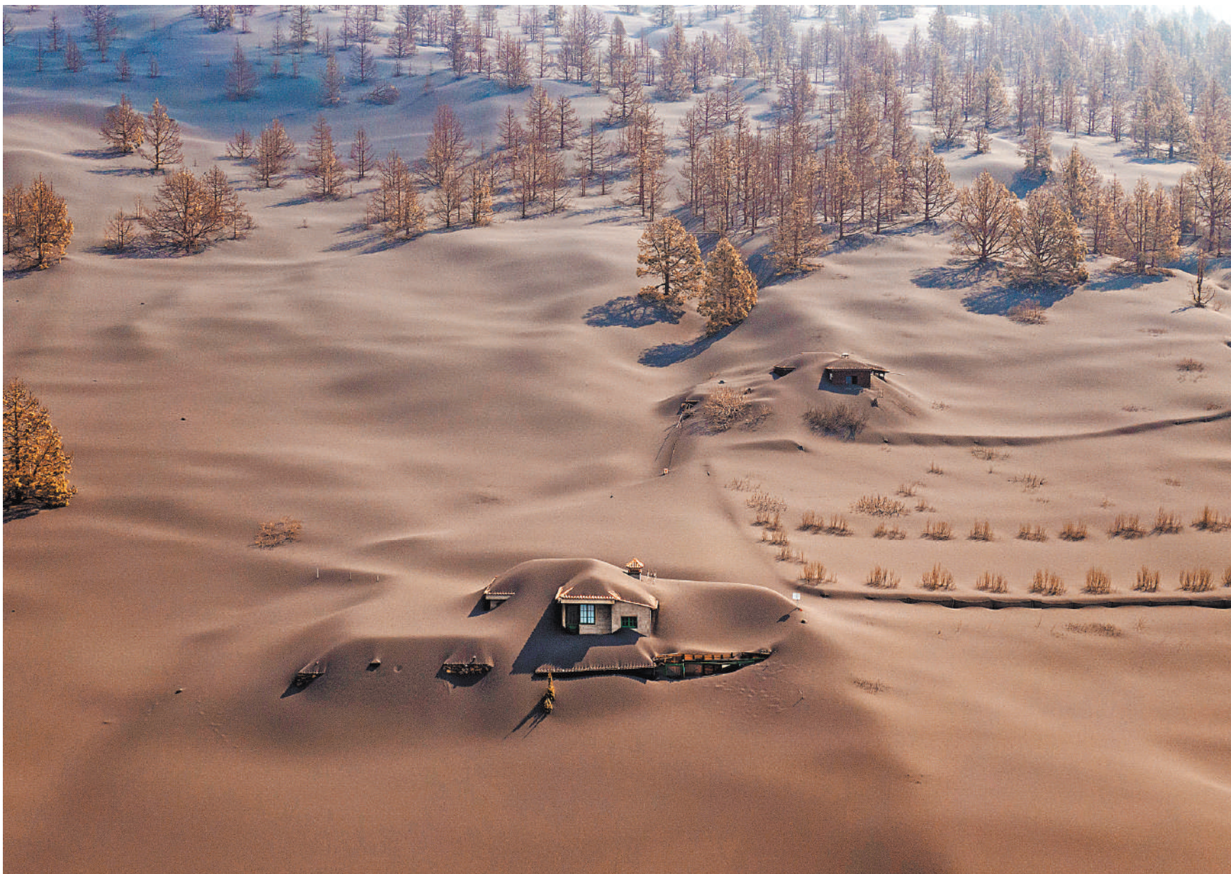
Окрестности извергающегося на канарском острове Пальма вулкана превратились в серую пустыню. Дома и деревья, которые не уничтожили лавовые потоки, теперь засыпан толстый слой пепла. Некоторые здания занесло по самую крышу, и на поверхности торчат только трубы. А на местном кладбище из-под серого слоя еле-еле выглядывают надгробия. Местные жители даже организовали продажу пепла в другие регионы Испании, а прибыль идет на помощь пострадавшим от извержения, которое продолжается с 19 сентября.

Ожидается, что в ближайшее время подвальные винадельники появятся по всей Италии.