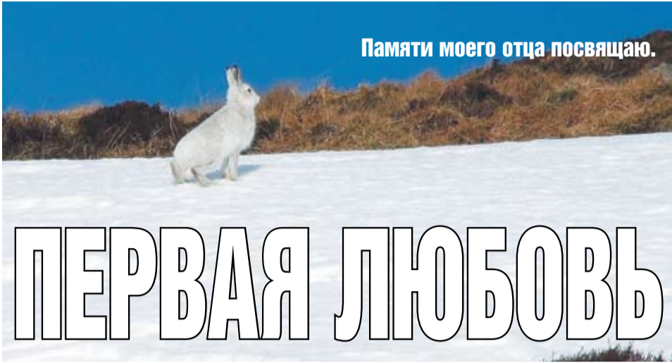
Памяти моего отца посвящаю.