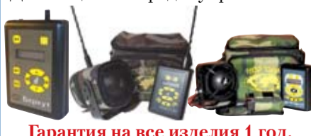
Гарантия на все изделия 1 год.

Электронные манки «Беркут» ♦ (42 голоса) — от 6500 руб. «Беркут PROFHUNT» ♦ (185 голосов) — от 7600 руб. «Беркут ДУ» ♦ (185 голосов) — 12500 руб. Дистанционное радиоуправление.