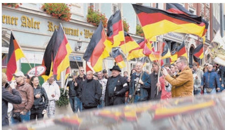
Партия «Альтернатива для Германии» собирает под знамена всех, кто против наплыва мигрантов.

это налоги, которые мы заплатили», – говорили корреспонденту DW, что им нравятся, что полиция дважды в день патрулирует городок, что в стране не строят мечети и вообще мусульман около одного процента. Они на родине не чувствовали себя в безопасности, потому что только и разговоров о криминальных происшествиях, связанных с эмигрантами.