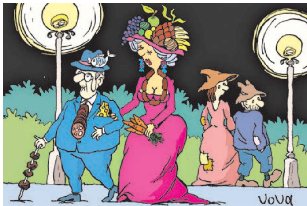
ИЛЛЮСТРАЦИЯ САРТОНОВ/ВИТАЛИЙ ГОЛОВАЧЕВ

Речь идет о средствах на банковских счетах, вложениях в ценные бумаги, наличных деньгах (стоимость основного жилья и предметов роскоши эксперты в расчет не принимали). Так вот, миллионеры, по данным компании, владеют в РФ 62% финансовых ресурсов, а миллиардеры – 26%. Зная капиталы наших предков из списка Forbes и ключевые цифры доклада, получим весьма яркую, многое объясняющую картину.