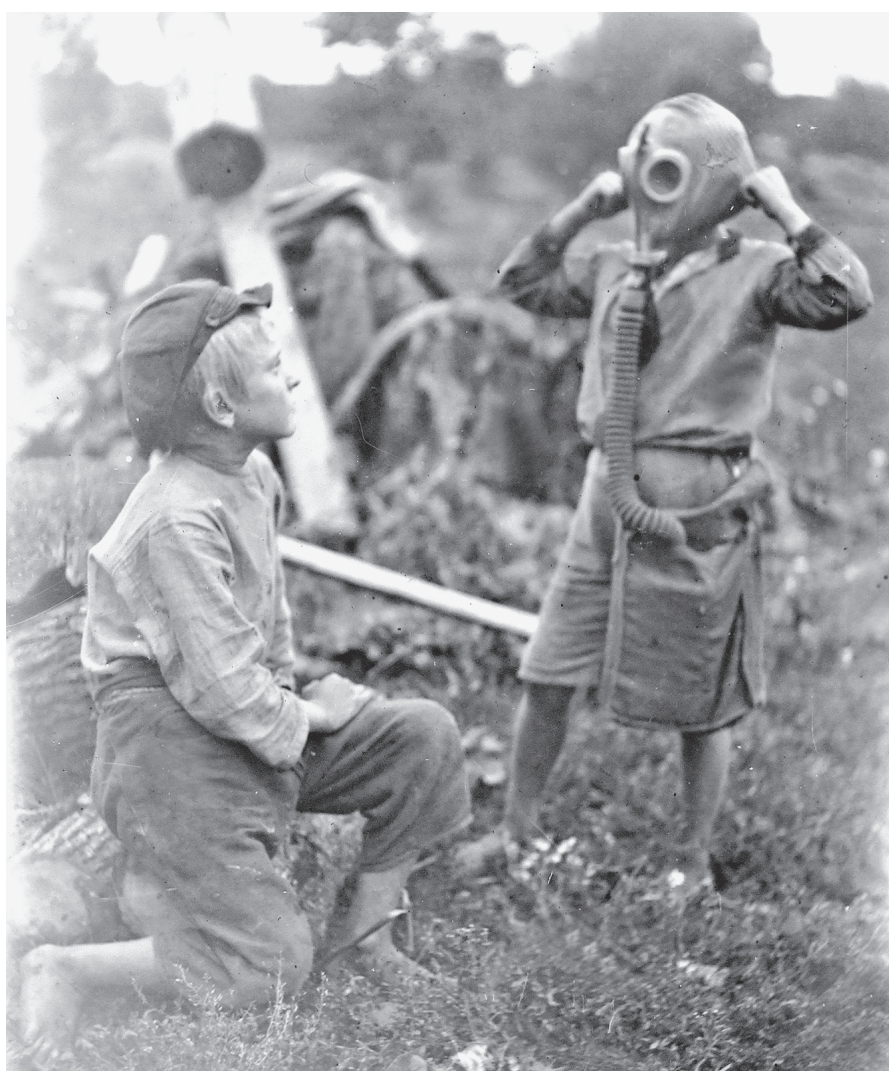
Одна из работ фотолетописца Вольдемара Андерсона.

P.S. Выставка продлится до 23 октября в здании Библиотеки иностранной литературы по адресу: Николаямская улица, 1.