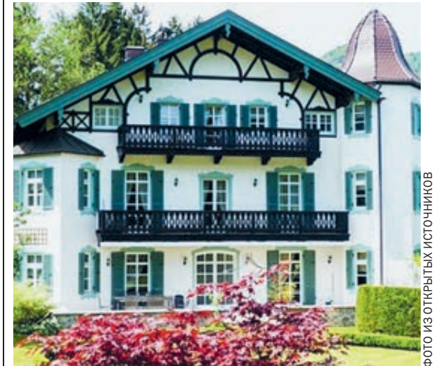
Та самая вилла в Баварии.

Когда после краха Советского Союза бывший лидер бывшего могущественного государства стал все чаще задерживаться в Германии, никто этому особо не удивлялся. Как и покупке Михаилом Сергеевичем «Замок Хубертус» в 2007 году – это выглядело очень даже закономерным шагом.