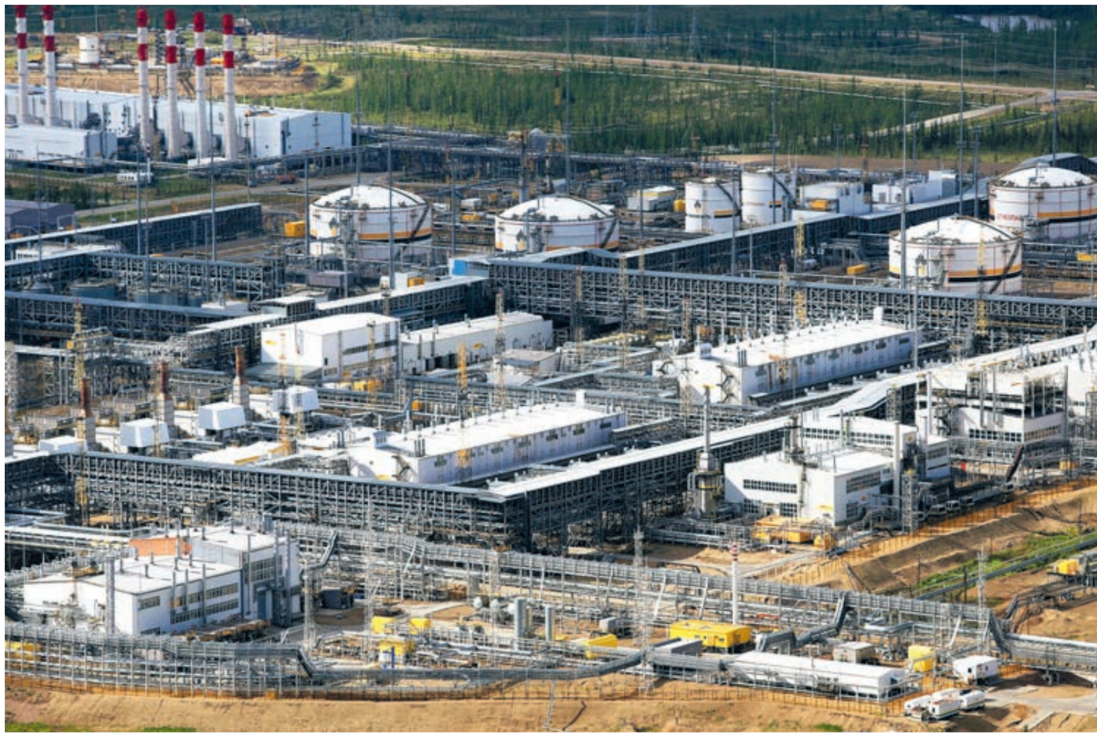
Банковский кластер и ООО «Таас-Юрх Нефтегазодобыча» стали привлекательными активами для индийских инвесторов.