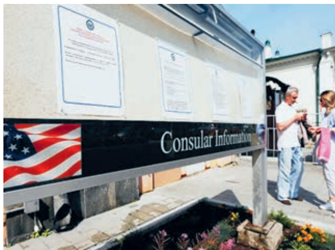
У американского посольства в Москве.

зательное собеседование, а наша нет. Так, может, американцам зеркально упростить процедуру, как это сделала Россия? Впрочем, рассчитывать на такой поворот наивно.