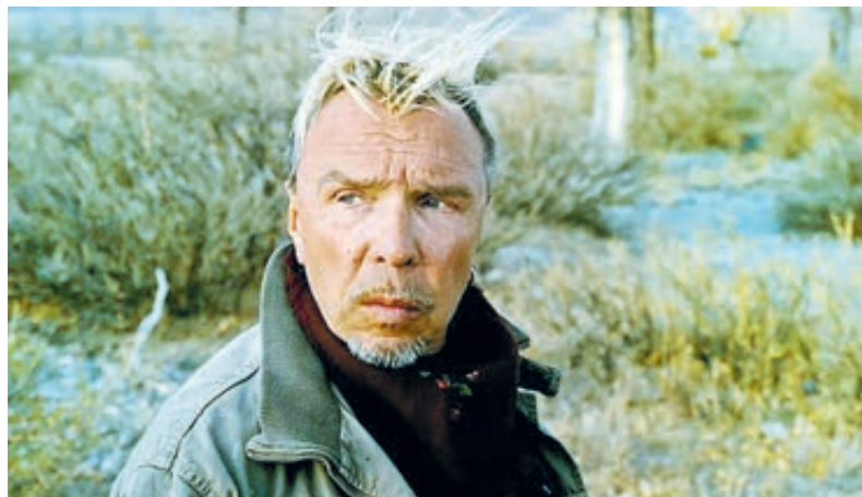
ФОТО ПРЕДОСТАВЛЕНЫ ПРЕСС-СЛУЖБЕЙ КИНОФЕСТИВАЛЯ «ОКНО В ЕВРОПУ»

– Все началось с моей поездки на мотоцикле по знаменитой дороге Route 66 в Соединенных Штатах. Сначала я даже хотел снять фильм об этом путешествии, а потом решил, что лучше пусть это будет другая поездка, по моей родной стране. Подготовка к съемкам и работа над сценарием велись полгода, только после этого прошли переговоры с Первым каналом и защита проекта в Русском геогра-