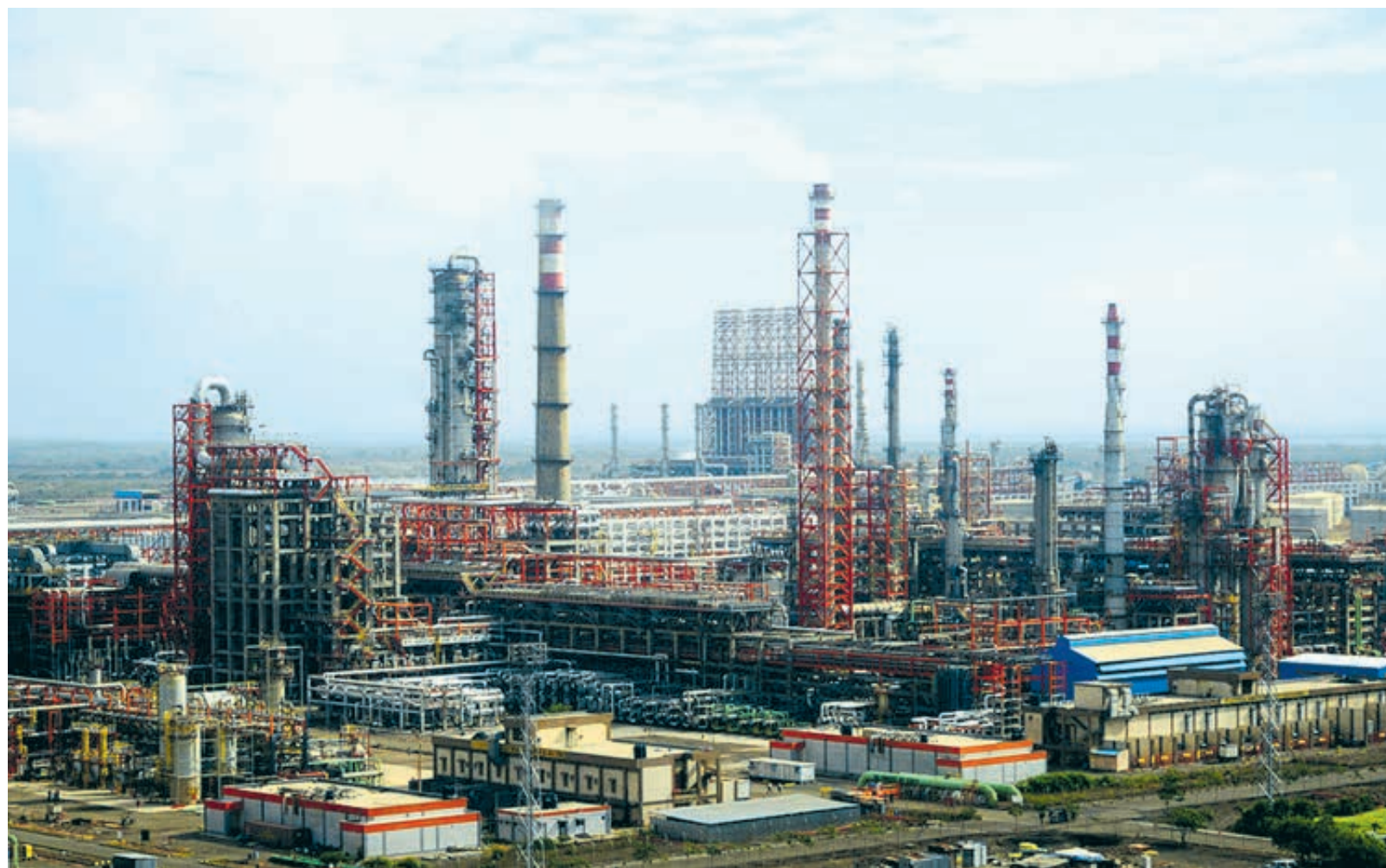
НПЗ «Вади́нар», глубоководный порт и заправки Essar стали выгодным приобретением для консорциума международных инвесторов во главе с «Роснефтью».

В периметр сделки также вошел глубоководный порт с пропускной способностью 58 млн тонн, который может прини-