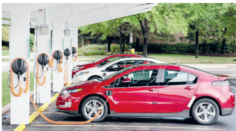
Электромобилизация приводит к резкому росту спроса на ископаемое сырье.

цифры еще больше – агентство мае оценило рост мирового спроса на металлы, необходимые для растущего производства электромобилей и хранения электроэнергии: потребность в литии вырастет более чем в 40 раз, а спрос на кобальт и никель – приблизительно в 20 раз к 2040 году.