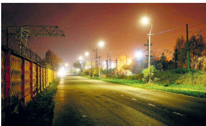
Одна из улиц Электростали до и после реконструкции уличного освещения.

чем значимой для жизнедеятельности сферы, как наружное освещение.