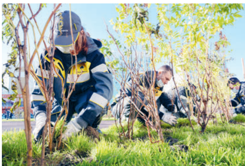
Специалисты «Роснефти» вносят реальный вклад в восстановление природы.

Так, по данным Bloomberg, при объявленных параметрах спрос на никель, алюминий и железо увеличится в 2030 году в 13–14 раз, спрос на литий, графит и прочее сырье, связанное с аккумуляторами, – в 9–10 раз. Согласно МЭА,