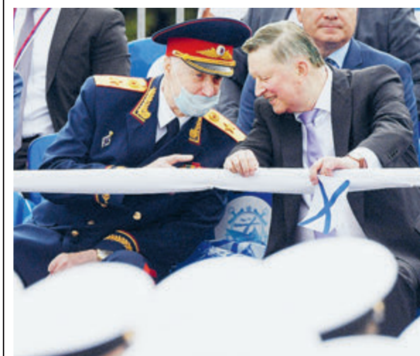
Глава СК Александр Бастрыкин (слева) уже обращал внимание на ситуацию с домом Черкасского. Последует ли за этим восстановление памятника?

То есть он отчасти еще существует – построенный здесь в начале XVIII века печально известный дом князя Алексея Черкасского – канцлера Российской империи, при-