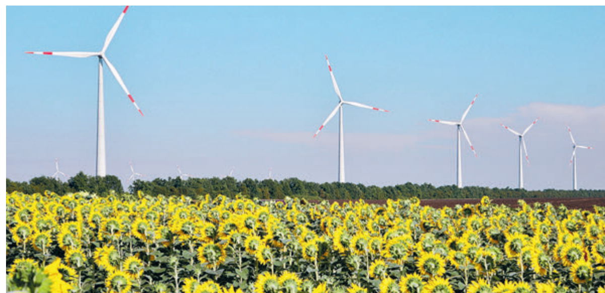
Затраты на ветровую энергетику становятся непосильным бременем для европейских налогоплательщиков.

В июне глава «Роснефти» Игорь Сечин обратил внимание на важ-