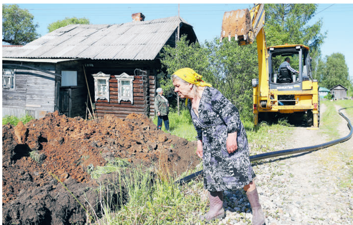
Жители этой деревни тоже ждут газ.

В перечень невыполненных обещаний аналитики занесли также отставание жилищного строительства, провал в возрождении отечественной фарминдустрии и даже обеспечение квартирами всех ветеранов войны. Что ж, даже в очень успешных странах не все может быть, что хочется. Хуже другое: в последующие годы итоги предвыборных обещаний «Единой России» практически не подвоились. Нынешний год не исключение: в июне на совместном заседании Высшего и Генерального советов «ЕР» ее председатель Дмитрий Медведев о конечных результатах не сказал ни слова. Отделался такими формулировками: «Мы умеем