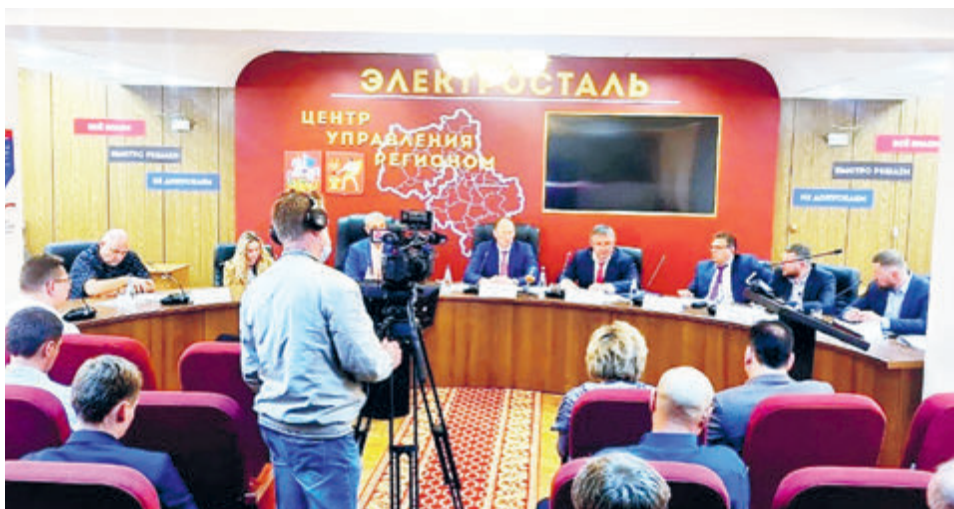
Руководство Московской области высоко оценило опыт реализации концессионных соглашений в Подмоскowie.

По оценкам Минэкономразвития, по состоянию на начало 2020 года в России было заключено более 3 тысяч концессионных соглашений на общую сумму инвестиций 1,7 трлн рублей. Более 40% вложений приходится на федеральные концессии, в основном в сфере создания транспортной инфраструктуры, треть вложений – на региональные концессии и четверть – на муниципальные. Однако 94% всех концессий – это муниципальные соглашения в сфере ЖКХ. До последнего времени местные власти передавали в концессию в основном объекты энергоснабжения, тепло- и водоснабжения, утилизации отходов. Однако сейчас очередь дошла и до такой более