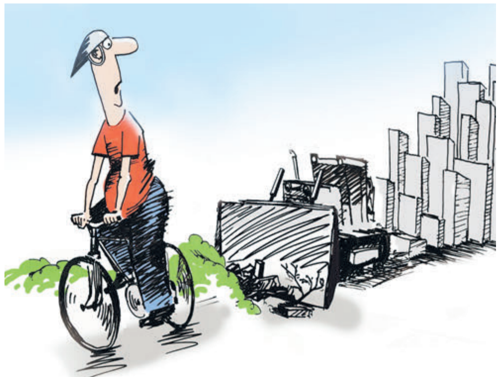
ИЛЛЮСТРАЦИЯ С. АРКАТУРА

Вместо того чтобы облагородить популярное общественное пространство на берегу Финского залива, застройщик сделал последний клочок стихийного пляжа недоступным для людей. Особенно тяжело тут в эти жаркие июльские дни: жители острова оказались в каменном гетто без доступа к свежему воздуху. Облако пыли зависло над Васильевским островом. Строительство намывных территорий идет круглосуточно. Здесь планируется засыпать в Финский залив 9 млн кубометров грунта и построить 1,2 млн квадратных метров жилья. Зачем застраивать залив?! В России кому-то земли не хватает?