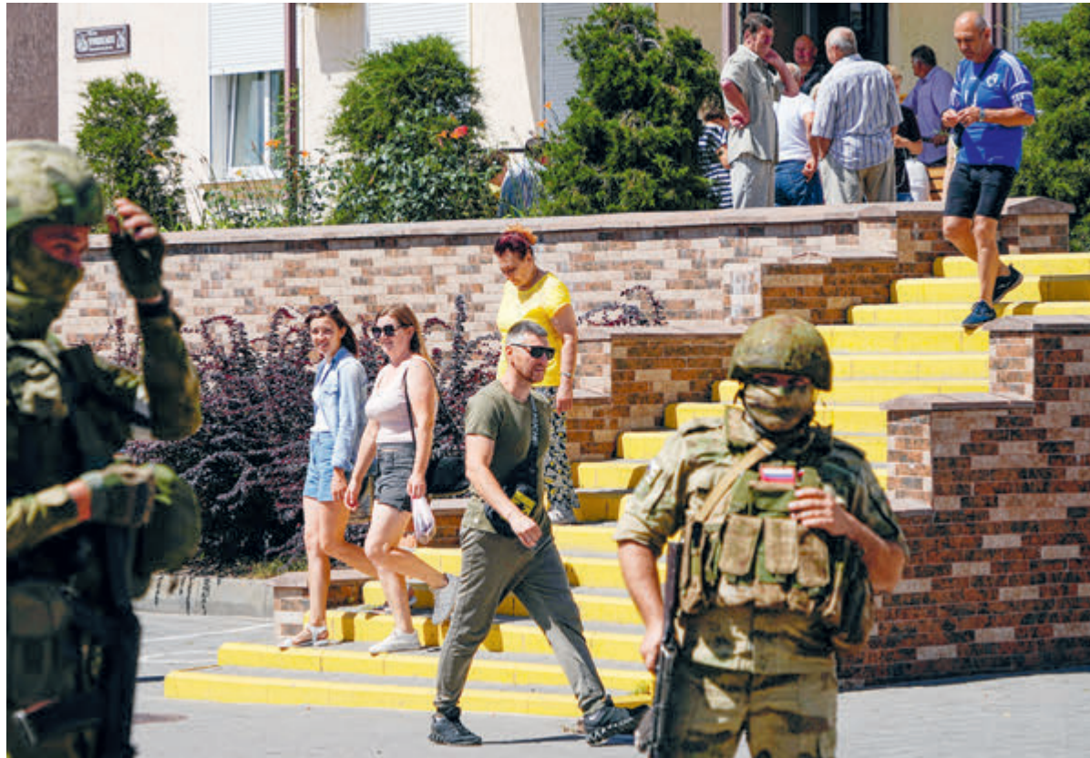
Мелитополь, конец июля.

Есть историческая логика в поступке известной российской рок-исполнительницы Юлии