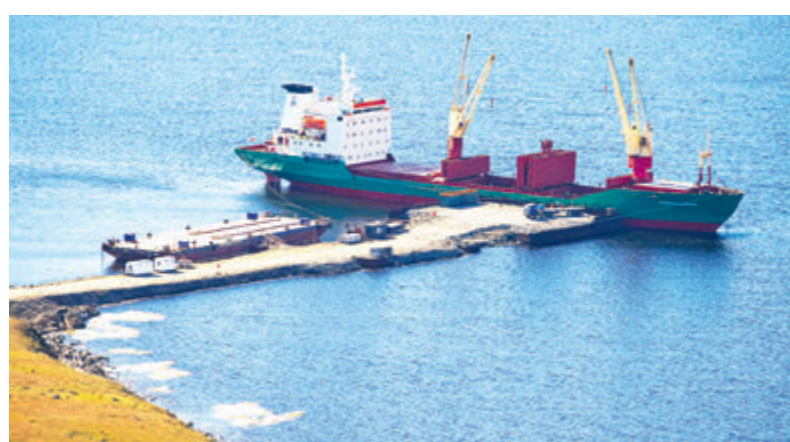
В рамках летней навигации «Роснефть» доставляет грузы на Таймыр по Северному морскому пути для объектов «Восток Ойла».

«Роснефть» уже приступила к строительству крупнейшего в России приемосдаточного пункта нефти и основного грузового причала для морских судов в порту «Бухта Север». Работы ведутся вблизи городского поселения Диксон на севере Красноярского края в рамках масштабного проекта компании «Восток Ойл». Инфраструктура порта включает три грузовых и два нефтеналивных причала общей протяженностью почти 1,3 км, крупнейший в России приемосдаточный пункт с 27 резервуарами объемом 30 тысяч кубометров каждый, а также технологические объекты и сооружения вспомогательной инфраструктуры.