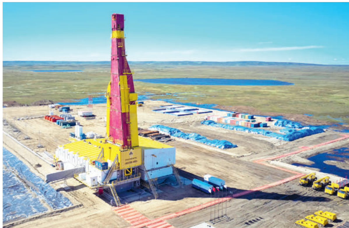
Эксплуатационное бурение ведется на пяти кустах Пайяхского месторождения с применением уникальных буровых комплексов, выполненных в северном исполнении.

«Ноев ковчег мировой экономики» – именно так назвал проект «Восток Ойл» главный исполнительный директор «Роснефти» Игорь Сечин, выступая с докладом на Петербургском международном экономическом форуме в июне. «Россия с ее энергетическим потенциалом и портфелем первоклассных проектов, таких как «Восток Ойл», может обеспечить долгосрочные потребности мира в доступных энергоресурсах и, безусловно, и есть этот спасительный ковчег», – говорил Сечин. По его словам, реализация проекта является ключевым фактором для балансировки мирового энергетиче-