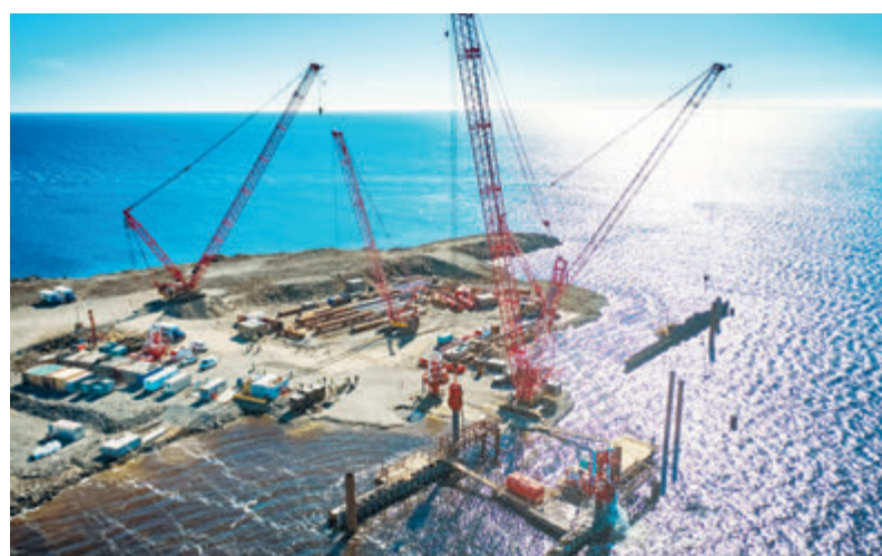
«Роснефть» приступила к строительству крупнейшего приемосдаточного пункта нефти и основного грузового причала для морских судов в порту «Бухта Север».