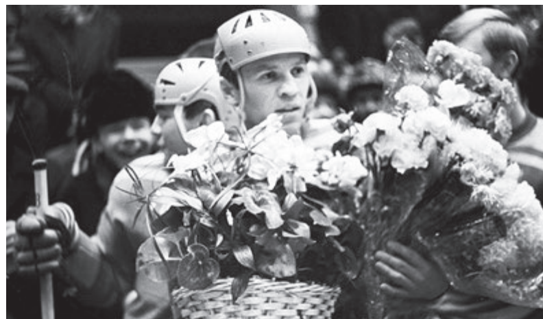
10 ноября 1969 года Борис Майоров провел последний матч за «Спартак».

– Не знаю, кто в каком достатке живет. Мой круг общения не так велик. У нас при «Спартаке» существует Совет ветеранов, я его председатель. Мы собираемся на матчах хоккейного «Спартак», человек 10–15. У нас своя ложа на стадионе, клуб нам помогает материально. Кто помоложе, они