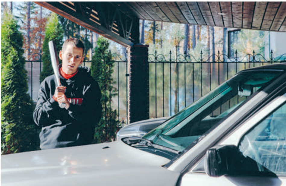
Лента «Плакать нельзя» рассказывает об ужасах ювенальной юстиции в Скандинавии. Второй фильм – «Дополнительный урок» впервые прикасается к такой больной теме, как расстрел подростков сверстниками.