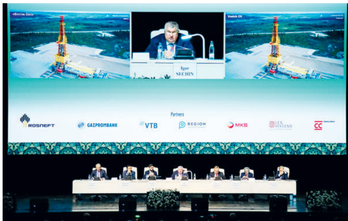
В своем докладе Игорь Сечин констатировал конец «эпохи изобилия» и начало кризиса глобализации.

Игорь Сечин заострил внимание аудитории на том факте, что в Европе фактически отменяется конкуренция на рынке энергоресурсов. «Вот очередная новация Евросоюза – централизация закупок. До 15% газа, закупаемого в хранилища в Европе, предпола-