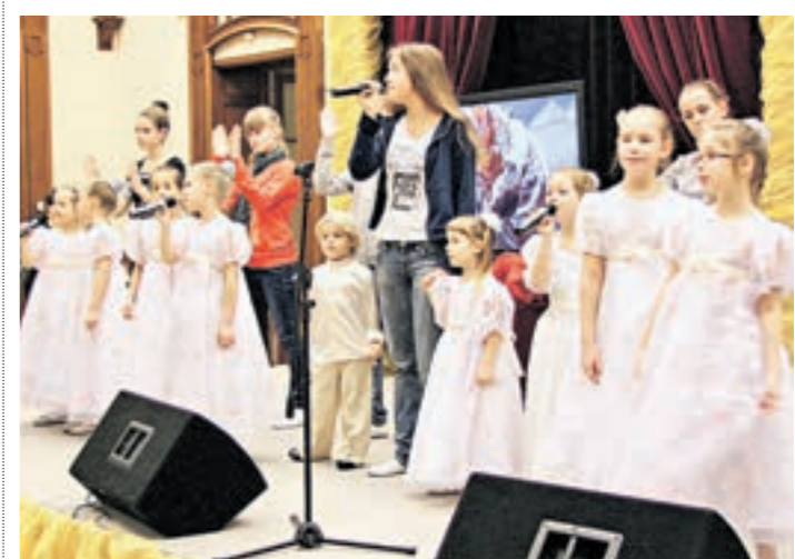
Выступают «Ангелы Надежды»