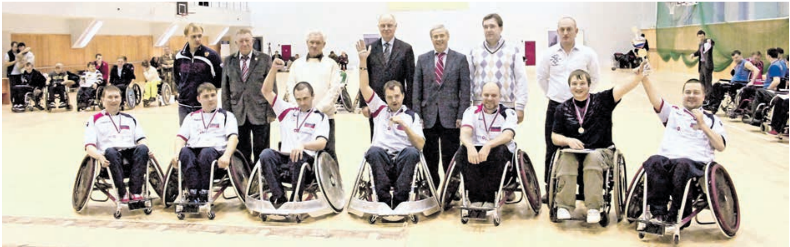
Поздравляем наших серебряных победителей!

ПОБЕДА Сказать, что «они ждали, мечтали, надеялись, стремились» — что там еще говорят в таких случаях? Готовились, тренировались, волновались, верили в победу, верили в себя, — все это и можно, и нужно сказать, и все это будет правдой... Но как же бледно и вяло звучат все эти правильные слова!