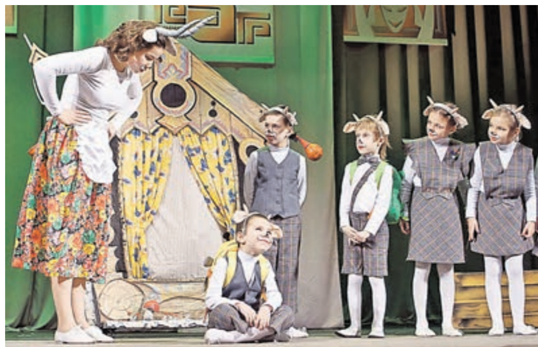
Сцена из спектакля «Волк и семеро козлят»

По его инициативе глухих артистов стали обучать по программе Щуки. Затем на базе первого выпуска глухих артистов был создан Театр мимики и жеста. И сейчас этому театру уже 50 лет. Юбилей! Театр глухих гремел: многочисленные гастроли по всему миру, частые премьеры спек-