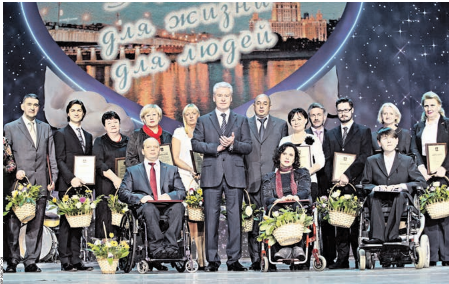
На сцене «России» — мэр Москвы Сергей Собянин и участники торжественной церемонии

ТЕМА ДНЯ Это произошло двадцать лет назад, в 1992-м: Генеральная ассамблея ООН провозгласила 3 декабря Международным днем инвалидов.