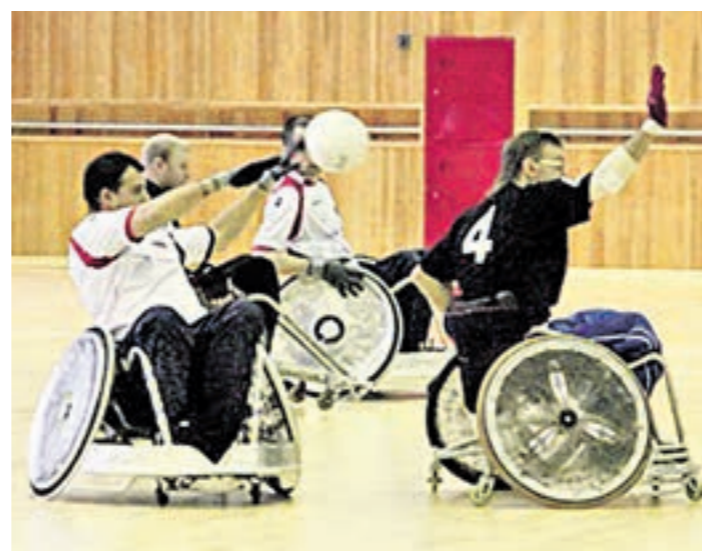
Мы боролись за каждый мяч