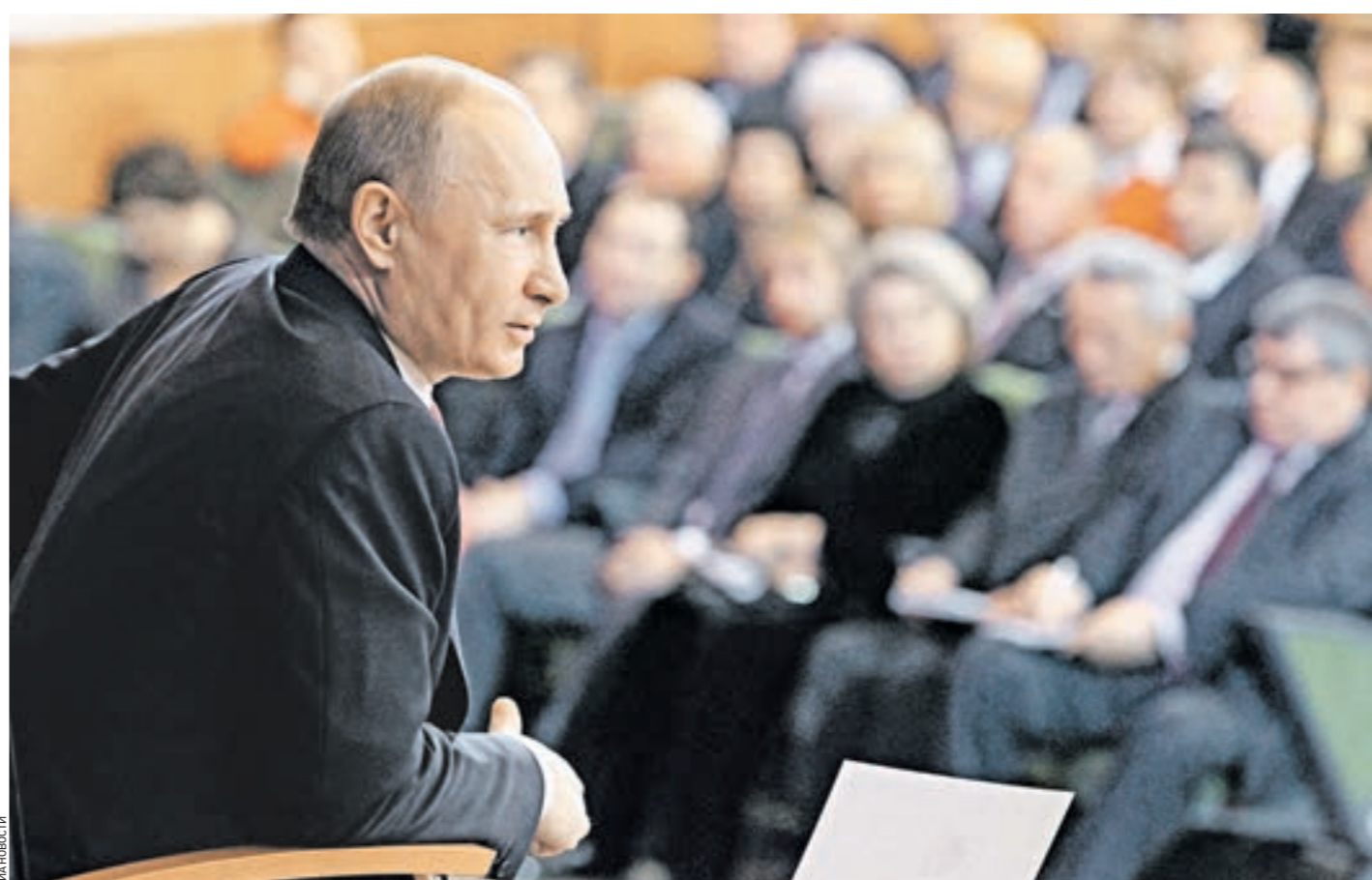
10 декабря 16.30 Академия госслужбы. Путин предложил проводить встречи с доверенными лицами «пару раз» в год

Путин пообещал ввести в России звание «Герой Труда», прообразом которого было звание «Герой Социалистического Труда», которое присваивали в СССР с 1938 по 1991 год за исключительные заслуги в трудовой деятельности.