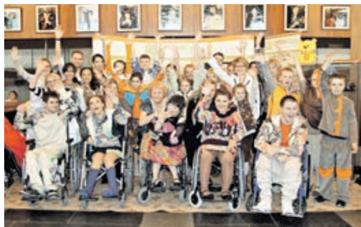
Для этих ребят слово «толерантность» еще слишком сложное, но есть проще и понятнее — дружба!

В прошлом году правительством Москвы была принята государственная программа «Социальная поддержка жителей города Москвы на 2012–2016 годы», направленная на повышение уровня и качества жизни москвичей. Одним из ее разделов стала подпрограмма «Социальная интеграция инвалидов и формирование безбарьерной среды для инвалидов и других маломобильных групп населения», на реализацию которой выделено около 150 миллиардов рублей, в том числе в 2012 году — 26,7 миллиарда рублей. Один из важнейших вопросов — предоставление инвалидам реабилитационных услуг: в 2011 году этими услугами в рамках реализации программных мероприятий по социальной интеграции инвалидов, было охвачено 79 процентов общей численности инвалидов города. В 2012 году этот показатель составил 83 процента (996 тыс. чел.), а к концу 2016 года — 90 процентов (1080 тыс. чел.). В городе работают 85 отделений социальной реабилитации инвалидов, в том числе 26 — для детей-инвалидов, 8 ре-