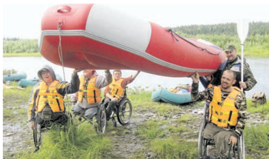
В сплаве их было пятеро — парней на инвалидных колясках

шагу, к каждому движению, к каждой минуте. Как проехать три метра по камням? Как перелезть с коляски на рафт? Как устроиться так, чтобы высокие борты не мешали грести, а спине было на что опереться? Как спастись от озверевшей мошкары? Как сохранить хоть какое-то тепло под непрекращающимся проливным дождем, а потом высушить промокшую до нитки одежду? Как уснуть на голых камнях или досках, если больное тело требует особого положения, и, кроме спальника и тонкой пенки, в твоём распоряжении нет ничего? И как приспособиться к коллективу так, чтобы приходилось как можно меньше просить о помощи? ...Зато впервые в жизни он летел на вертолете — из Вуктыла на берег Подчерема группу забрасывали вертолетом «Севвергазпрома». Впервые он видел девственную тайгу — маршрут пролегал по территории национального парка «Югд Ва» Республики Коми. Ощутить вкус речной воды, зачерпнув ее кружкой прямо с борта. Он пробовал ловить аристократического хариуса и понял, как можно есть сырую, пятиминутного посола рыбу. Он разглядел попадавшиеся ему камни, отсыкая признаки некогда плескавшегося здесь моря, и набрал полпрожарки «раритетов»,