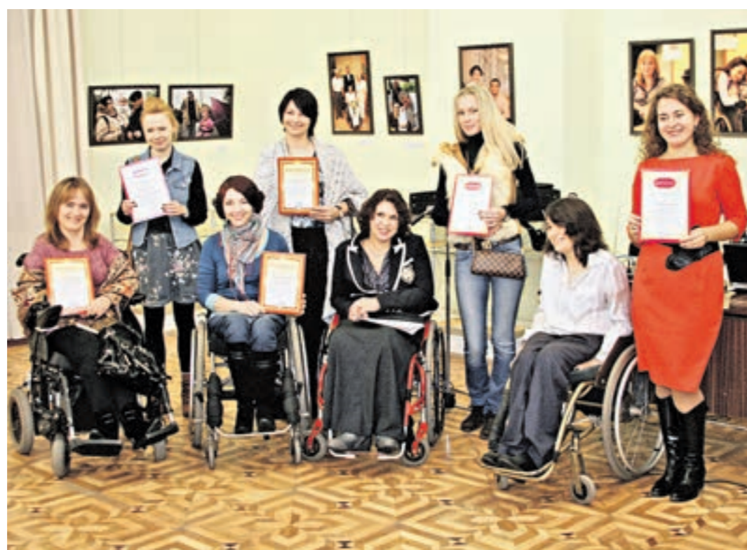
Участницы выставки «Лучшие родители. Люди с инвалидностью в кругу семьи»

Фотовыставка «Лучшие родители. Люди с инвалидностью в кругу семьи», которая проходила в гуманитарном центре «Преодоление» Государственного музея им. Н. А. Островского, безо всяких натяжек можно назвать уникальной. На ней были представлены и работы профессиональных фотографов, и фотографии из семейных альбомов, организатор выставки — региональная общественная организация «Общество поддержки родителей с инвалидностью и членов их семей «Катюша». Здесь буквально каждая фотография говорит о любви к своей семье, к своей родине, к окружающему нас миру, помогает понять ценность каждого прожитого дня, призывает к добру и радости.