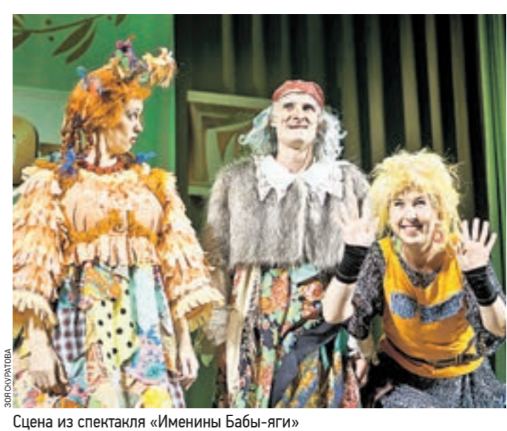
Сцена из спектакля «Именины Бабы-яги»

Как символ прошлого был показан документальный исторический фильм с эпизодами из старых спектаклей. Многих актеров и режиссеров того времени уже нет в живых. Затем публика увидела спектакли нынешнего репертуара Театра мимики и жеста. Финал концерта — как вера и надежда театра, что не прервется связь поколений, — детский спектакль «Волк и семеро козлят», в котором играли глухие дети из детского клуба театра. Одним словом, играли, играем и будем играть!