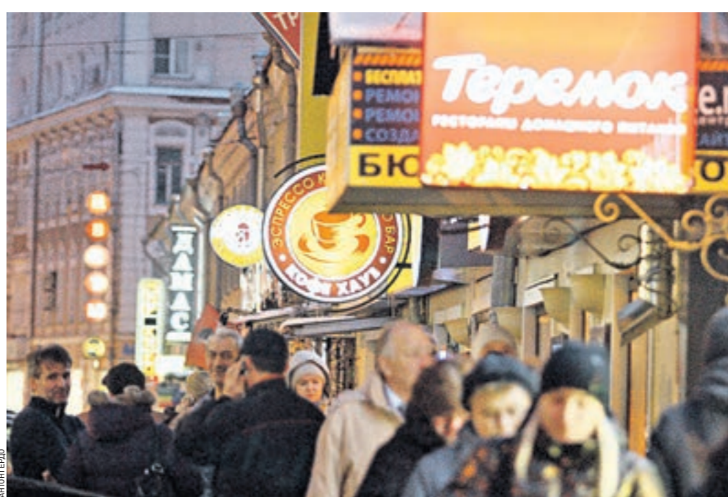
Вчера 18.00 Маросейка. Вывески петрят и не сочетаются друг с другом и архитектурой старой Москвы

ЛИШЬ НЕМНОГИЕ СТОЛИЧНЫЕ ВЫВЕСКИ СООТВЕТСТВУЮТ ТРЕБОВАНИЯМ И ВПИСЫВАЮТСЯ В СРЕДУ