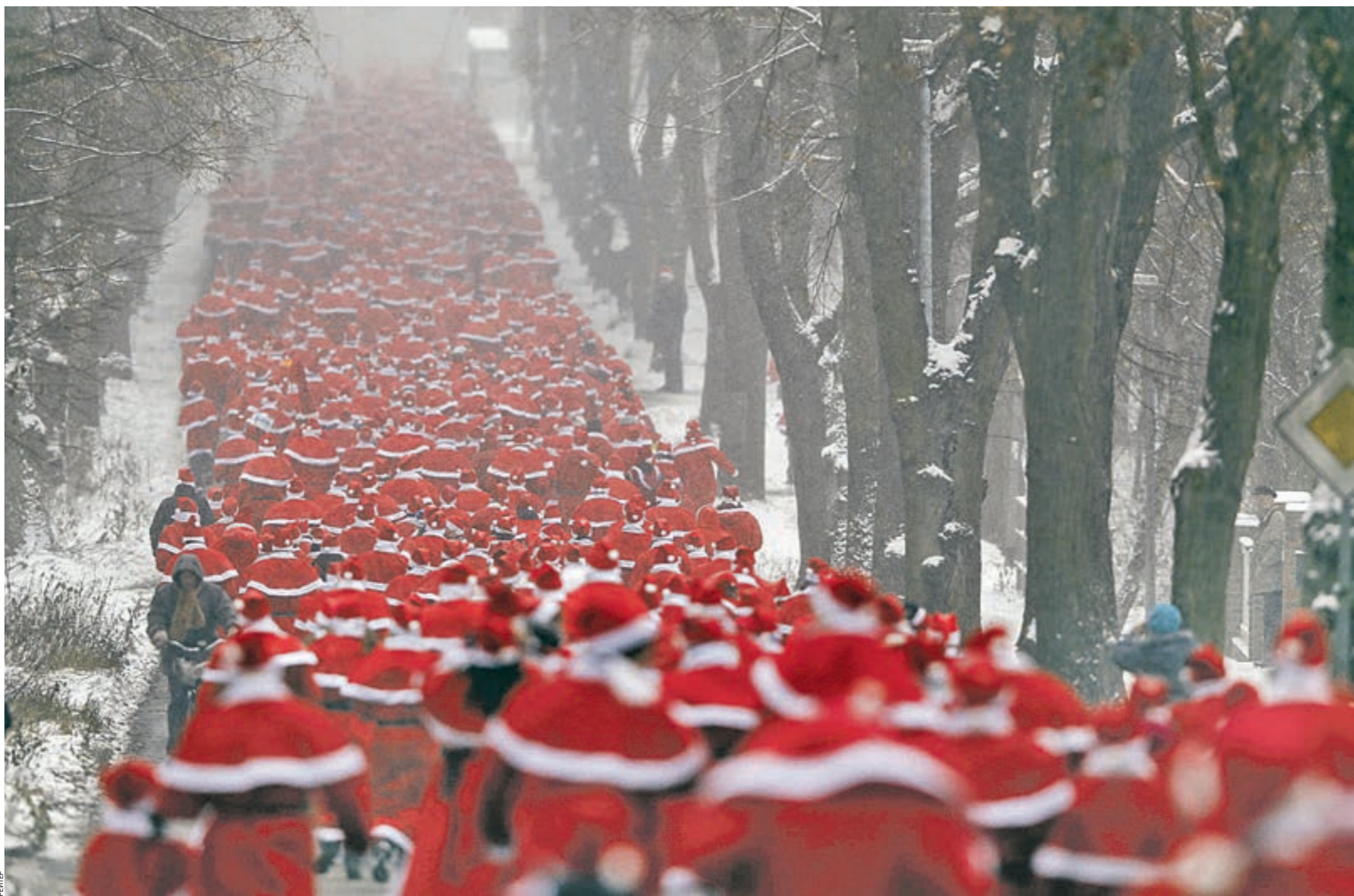
ТОЧКА Сегодня точку в номере ставят немецкие бегуны, одетые в костюмы Дедов Морозов. Почти 800 рождественских Санта-Николаусов (так называют Деда Мороза в Германии) пробегали в традиционном забеге Святого Николая по паркам и улицам города Михельдорфа, что в 40 километрах от Берлина. Идея забега принадлежит Ассоциации бегунов Михельдорфа. И для здоровья полезно, и настроение незадолго до праздников создано отлично!