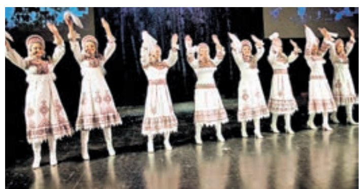
Эти девочки «поют» руками, сердцем, душой