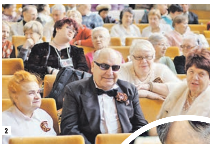
2 В зале — родные, друзья, болельщики

И по справедливости главным победителям и героям двухдневного фестиваля МГО ВОС были вручены кубки и дипломы, медали и ценные подарки, а всем участникам — памятные призы. Кстати, спасибо Департаменту социальной защиты населения города Москвы, который помог в проведении кон-