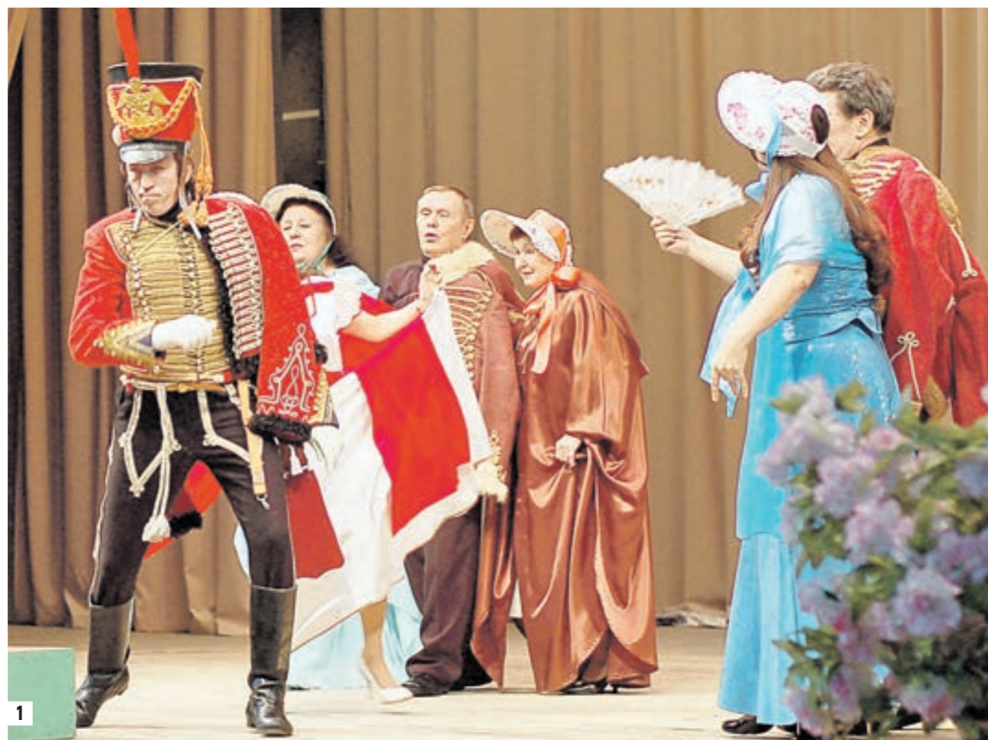
1 На сцене — блистательный поручик Ржевский

По традиции начинали конкурс те, кто победил в прошлогоднем конкурсе, — команда «Измайлово». И открытие получилось замечательным, и как же озор-