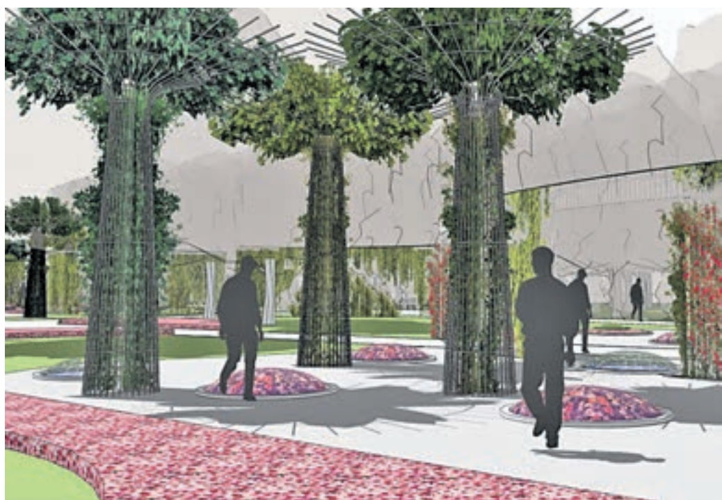
Визуализация проекта исторической реконструкции цветников на ВДНХ. Именно так будут выглядеть боковые аллеи, которые украсят благоухающими розами