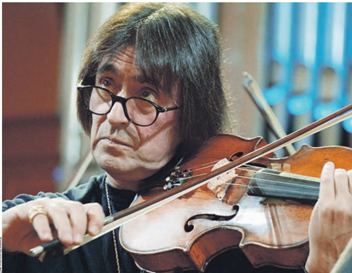
18 февраля 18:48 Юрий Башмет выступает в Московской консерватории в честь ее 150-летия. В этот же вечер под руководством маэстро «Виртуозы Москвы» сыграли «Глорию» Вивальди

Юрий Башмет неизменно репетирует в джинсах, темном свитере и с большим золотым медальоном на груди. В первом взмахе его рук дирижерского пульса сочетаются стремительность и плавность, красота линий и быстрота жестов. Сегодня особенно похорошел на Никола Паганини. Итальянский хор города Конельяно подпекает знаменитым скрипачам и Башмету. Главная забота мэтра на репетиции — хороший звук. В зале сидит его помощник, который вовремя подсказывает, когда нужно дать больше «форте», а когда — «пиано».