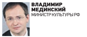
ВЛАДИМИР МЕДИНСКИЙ МИНИСТР КУЛЬТУРЫ РФ

Поздравляю номинантов и будущих лауреатов фестиваля операторского искусства «Белый квадрат». Но еще мне очень хочется похвастаться тем, что в этом году впервые в истории нашей страны появился фирменный поезд, названный в честь оператора Вадима Юсова.