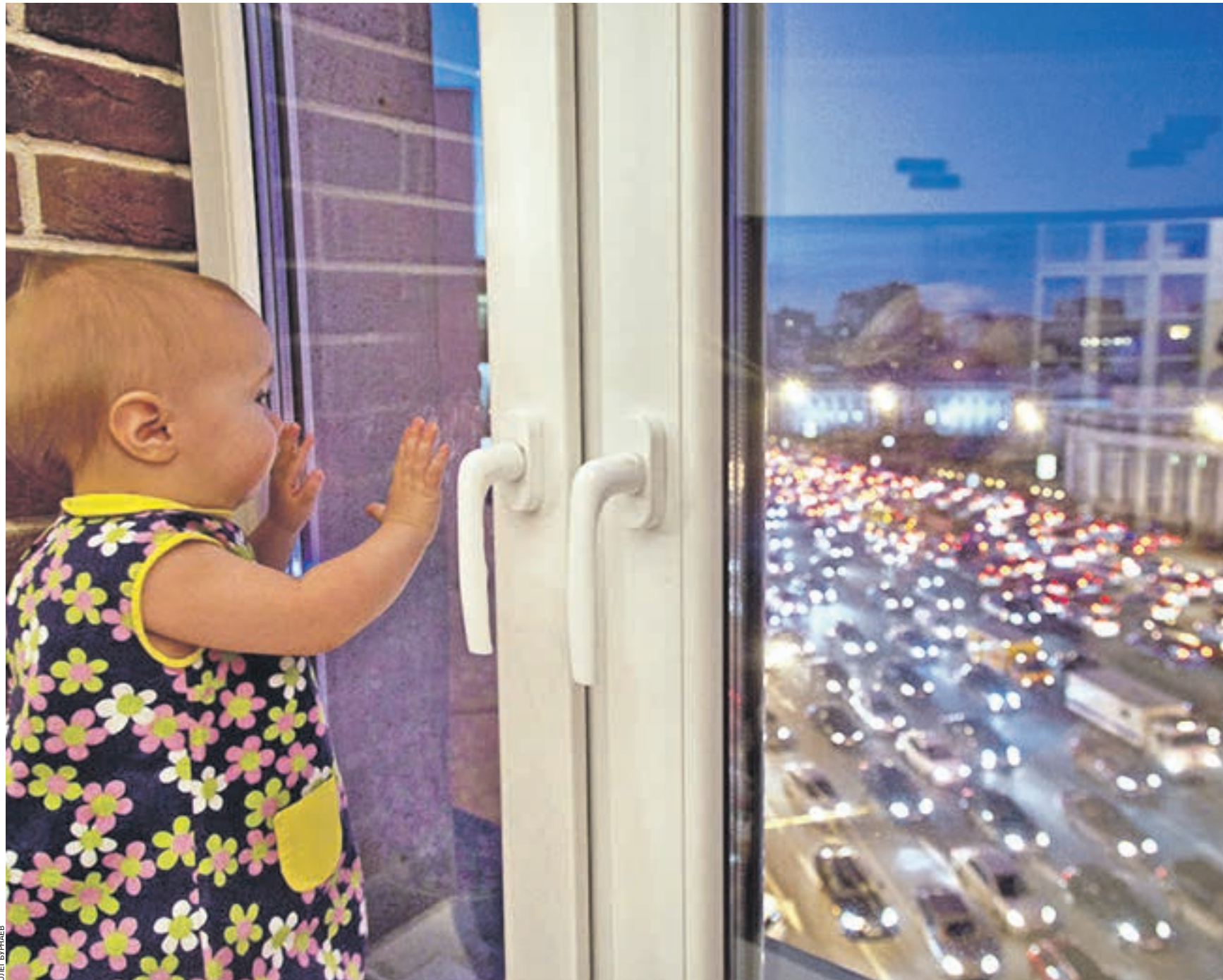
23 ноября 2015 года. Юная москвичка Василиса Бурнаева у окна семейной квартиры, расположенной на Садовом кольце, едва ли не самой оживленной магистрали столицы, движение на которой не прекращается даже глубокой ночью. На Садовом кольце установили шумозащитные экраны (просто там нет такой технической возможности), и поэтому единственным спасением от избыточного шума стали специальные шумозащитные стеклопанеты

Кстати, есть еще лишнее разума эгоисты, которые рассекают на мотоциклах с прямым током выхлопных труб. Это для того, чтобы после проезда этого урода все припаркованные автомобили завопили охранными сигналами на пару-тройку минут. И мне в самом деле не понять, что должно случиться, чтобы brave гаишники навели порядок. В этом году открытие сезона в Москве ознаменовалось массовым мотопробегом под девизом «Москва — город для мотоциклистов». Я всегда думал, что город — для жителей, для их удобства. Ан нет, оказывается, наш город — для Залдостанова-Хирурга и его друзей на крутых мотоциклах. Не знаю, к чему тянутся руки у других жителей при звуках, сопровождающих ночные покатушки, но, право, меня они провоцируют на вовсе кроважидные мысли. Так и хочется «ударить мотопробегом» по кому-нибудь. Извините.