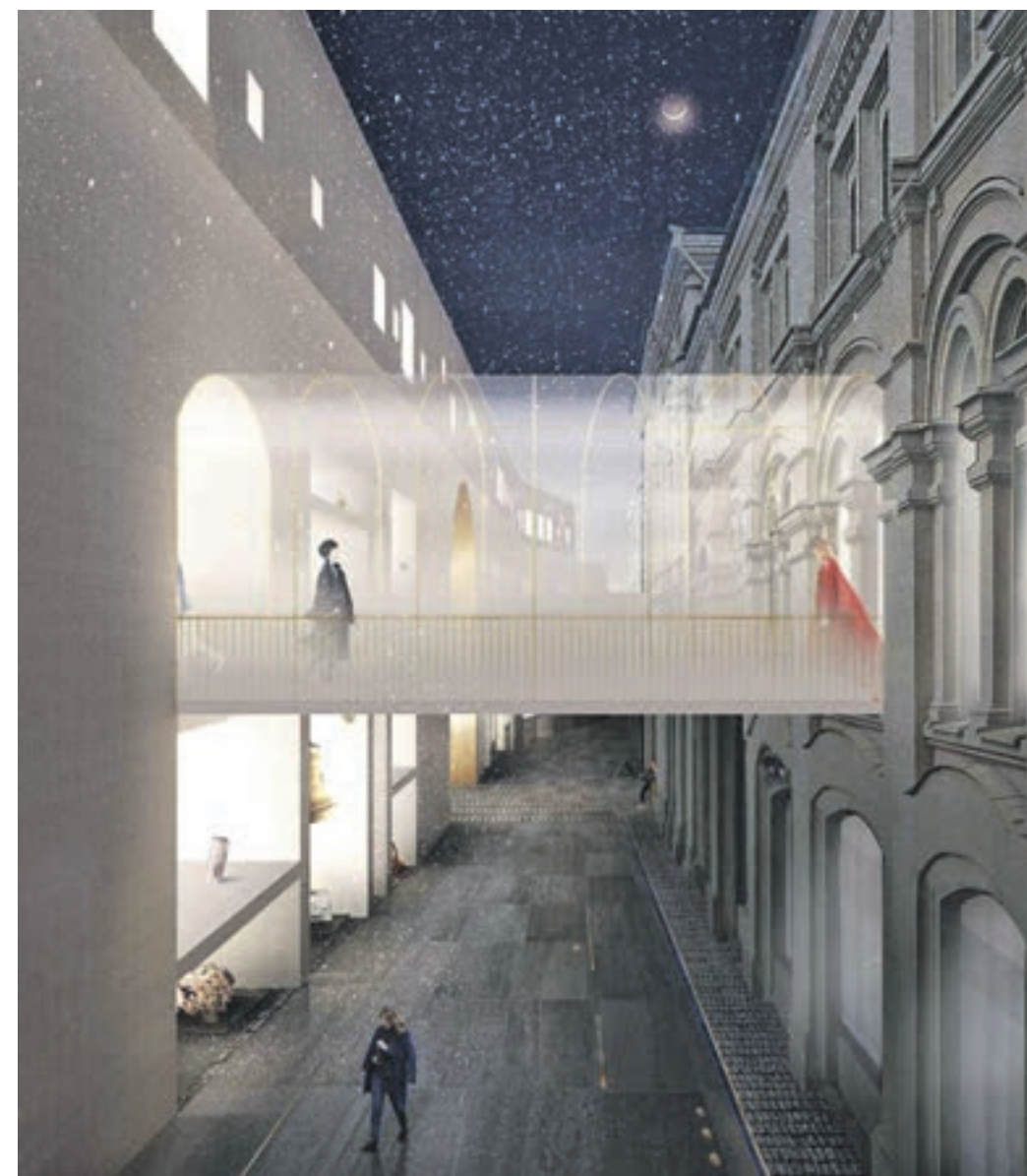
Проект мостика, который соединит музейные комплексы на Красной площади после окончания реконструкции в 2020 году