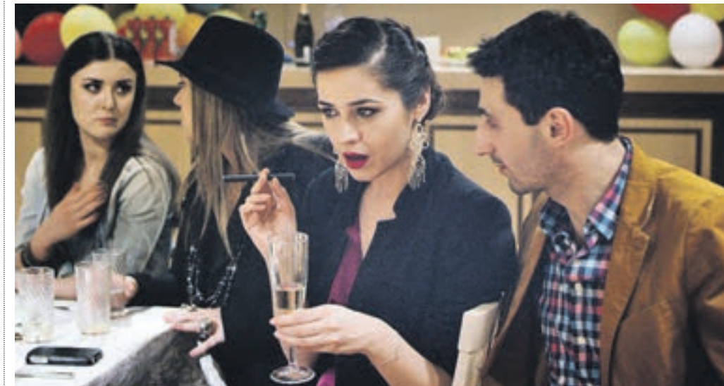
Кадр из фильма «Мастерская». Лента рассказывает о выпускниках Академии кинематографического и театрального искусства Ниниты Михалковой

Всего в ленте задействовано 15 артистов — все они выпускники первого года обучения академии. — Кинокартина «Мастерская» — в чистом виде эксперимент. Эксперимент для нас уникальный, и смысл его заключается в том, что вся картина снята единым куском, без монтажных переходов, — поделился с «ВМ» режиссер, основатель Академии кинематографического и театрального искусства Нинита Михалкова. — Снять полнометражный фильм одной панорамой трудно технически, это заставляет актеров находить-