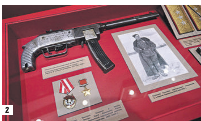
Вчера 13:00 Председатель Российского исторического общества Сергей Нарышкин (слева), гендиректор музея Ирина Великанова, научный сотрудник музея Федор Кукнин изучают мультимедийное изображение (1) Часть экспозиции посвящена партизанам (2)

— Почти все вещи, документы, кинокадры уникальны. Одна из таких достопримечательностей — русско-чешский словарь, который нашли в неразорванном снаряде на чердаке московского дома. Рискуя собственной жизнью, чехи вместо заряда заложили в нее песок, — обратил внима-