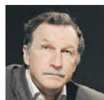
ГЕОРГИЙ БОБТ ОБОЗРЕВАТЕЛЬ

Мнение колумнистов может не совпадать с точкой зрения редакции «Вечерней Москвы»