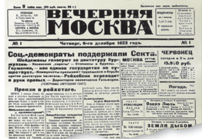
Таким был первый номер «Вечерней Москвы», вышедший в свет 6 декабря 1923 года

Но, конечно, в первую очередь день рождения газеты имеет отношение к ее читателям. То есть к вам! Поскольку если бы читателей не было, то не было бы ничего: ни тиражей, ни писем, ни каких-то особых, чисто городских тем, ни обсуждения на страницах газеты проблем общества — тех, которые вол-