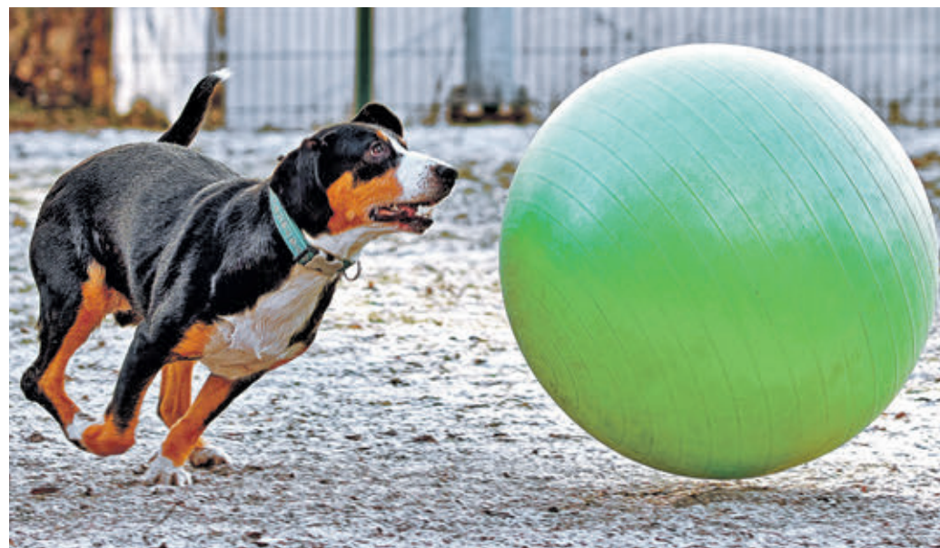
23 ноября 13:27 Собака по кличке Флора породы энглебухер зенненхунд во время соревнований по трейбболу, суть которого — загнать мяч в ворота, как это делают пастушьи собаки с овцами

На кинологическом стадионе весело и шумно, лай псов перекрывает команды их хозяев. Цвергшнауцер Эраст, несмотря на свои тринадцать лет, бодро закатывает разноцветные мячи — фитболы — в ворота, обозначенные пластиковыми конусами. За его действиями наблюдают соперники: немецкая овчарка Ося, цвергшнауцер Тутти, энглебухер Флора и другие.