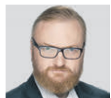
ВИТАЛИЙ МИЛОНОВ ДЕПУТАТ ГОСДУМЫ

корни, существует специальная техника, способная выкапывать и транспортировать деревья высотой до 15 метров.