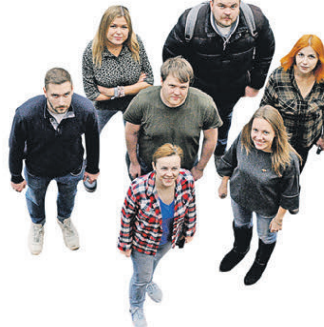
Корреспонденты «ВМ» АННА БАЛЮК, НИКИТА КАМЗИН, ДАРЬЯ ПИОТРОВСКАЯ, АНДРЕЙ РЕЧМЕНСКИЙ, КИРИЛЛ ВАСИЛЬЕВ, ЮЛИЯ ДОЛГОВА, МАРИЯ ГУСЕВА