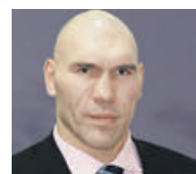
НИКОЛАЙ ВАЛУЕВ ПЕРВЫЙ ЗАМЕСТИТЕЛЬ ПРЕДСЕДАТЕЛЯ КОМИТЕТА ГОСДУМЫ ПО ЭКОЛОГИИ И ОХРАНЕ ОКРУЖАЮЩЕЙ СРЕДЫ

навлять. К примеру, недавно в Кемерове купили искусственное дерево за 18 миллионов рублей. Там подсчитали, что елка прослужит 20 лет, и в итоге это выйдет дешевле, чем каждый год покупать натуральную. Именно в деньги упирается решение местных властей. У кого-то есть средства на дорогую искусственную ель, у кого-то их нет. Обязывать местные власти закупать только искусственные деревья так же странно, как заставлять это делать обычных граждан. В малых городах существует практика, при которой ели выращивают на центральных площадях, они там стоят годами. Это самый выгодный вариант — натуральная ель, которую достаточно просто нарядить к празднику.