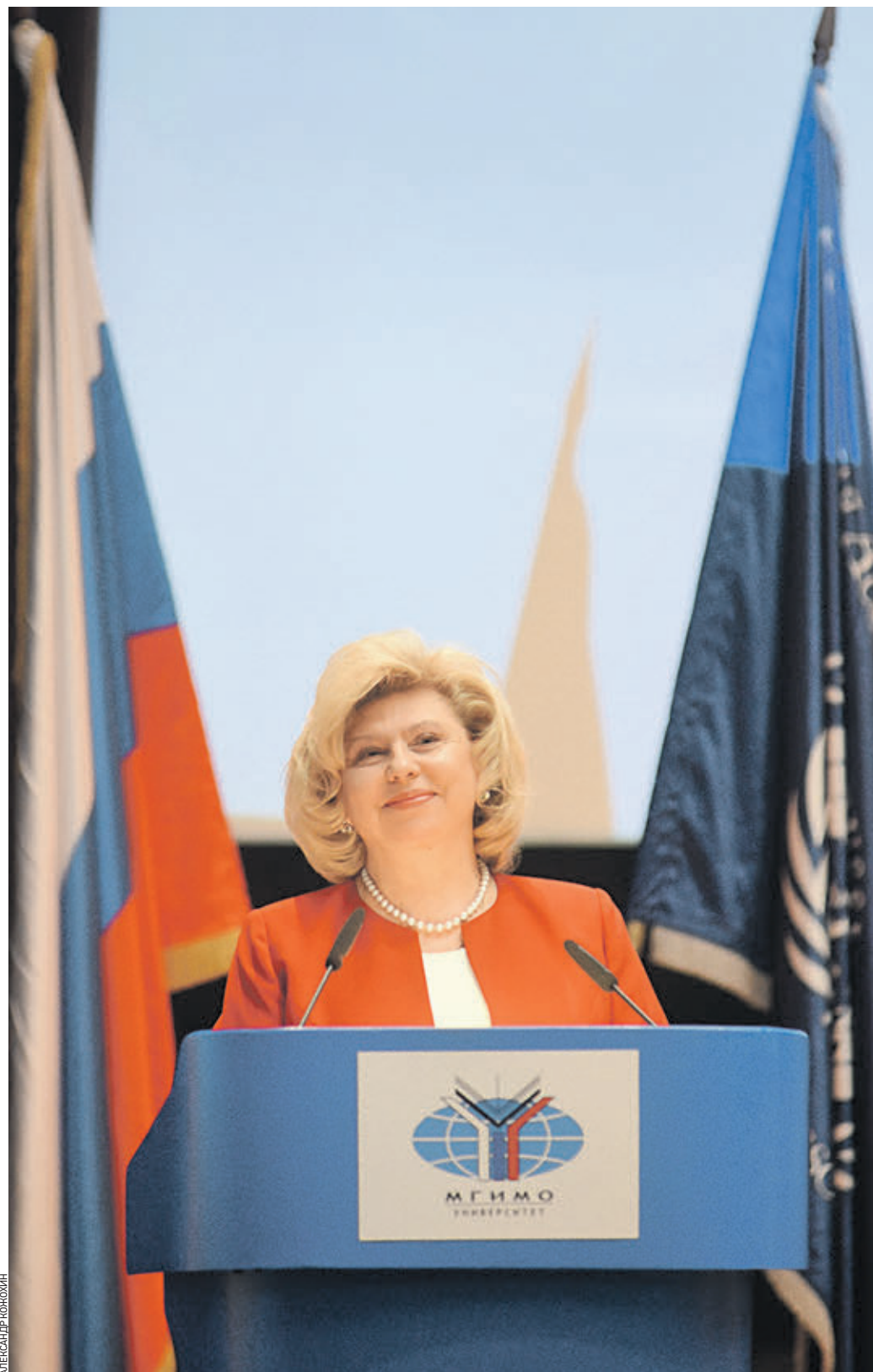
Вчера 11:15 Уполномоченный по правам человека в России Татьяна Москалькова в конференц-зале МГИМО дала старт Всероссийскому открытому уроку по правам человека для школьников

Права человека как юридическое явление возникли в момент принятия Всеобщей декларации прав человека 10 декабря 1948 года. Когда общественность узнала о зверствах нацистской Германии, стало очевидно, что устав ООН недостаточно точно определяет права человека. Был необходим всеобщий договор, который бы перечислил и описывал права личности. Им и стала Декларация. Ее текст, состоящий из 30 статей, является первым глобальным определением прав, которыми обладают все люди. Это самый переводимый документ в мире.