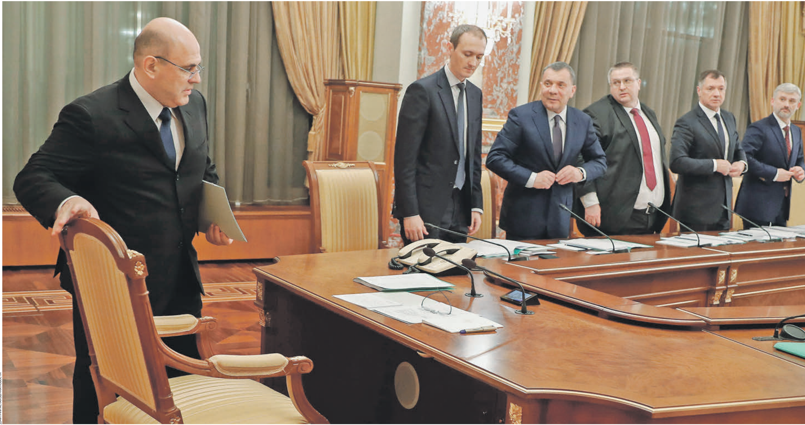
21 января 2020 года. Председатель правительства России Михаил Мишустин, заместитель председателя правительства России — глава аппарата правительства Дмитрий Григоренко, заместитель председателя правительства Юрий Борисов, заместитель председателя правительства Алексей Оверчук, заместитель председателя правительства Марат Хуснуллин, министр транспорта Евгений Дитрих перед началом заседания (слева направо)