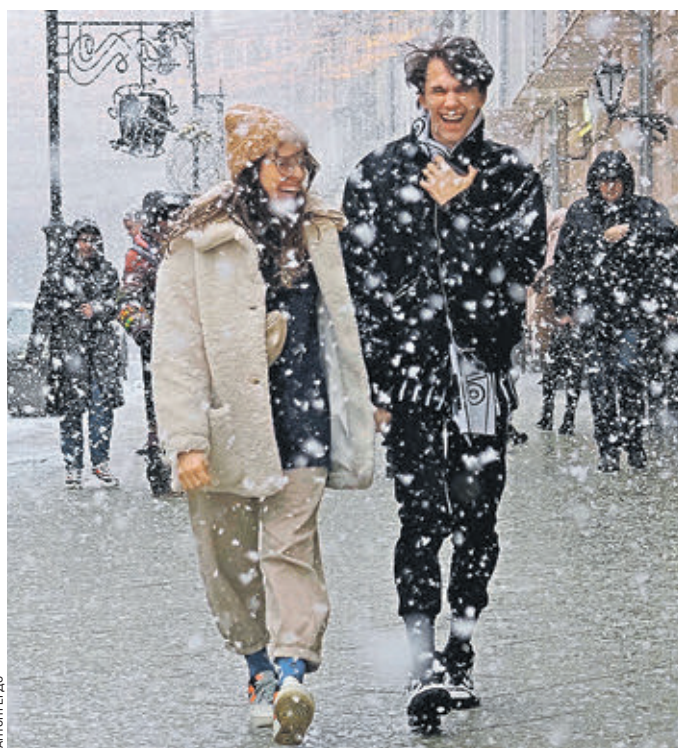
Вчера 13:34 Улица Мясницкая. Долгожданный снегопад многие москвичи встретили с улыбками на лице