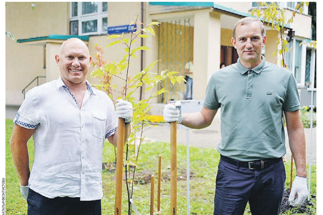
1 августа 12:39 Космонавт-испытатель, Герой России Олег Артемьев (слева) и префект СВАО Алексей Беляев у сакуры, посаженной во дворе Дома-музея Сергея Королева

Гостями академика были почти все советские космонавты, в том числе Юрий Гагарин и Валентина Терешкова. Посещают дом на 1-й Останкинской улице космонавты и сегодня — «на удачу». — Это почти такая же обязательная традиция, как посмотреть перед полетом на Международную космическую станцию «Белое солнце пустыни», — отметил летчик-космонавт, Герой России Олег Артемьев, который впервые побывал в доме конструктора, когда готовился вступить в отряд космонавтов. — Космонавты основного и дублирующего экипажей обязательно