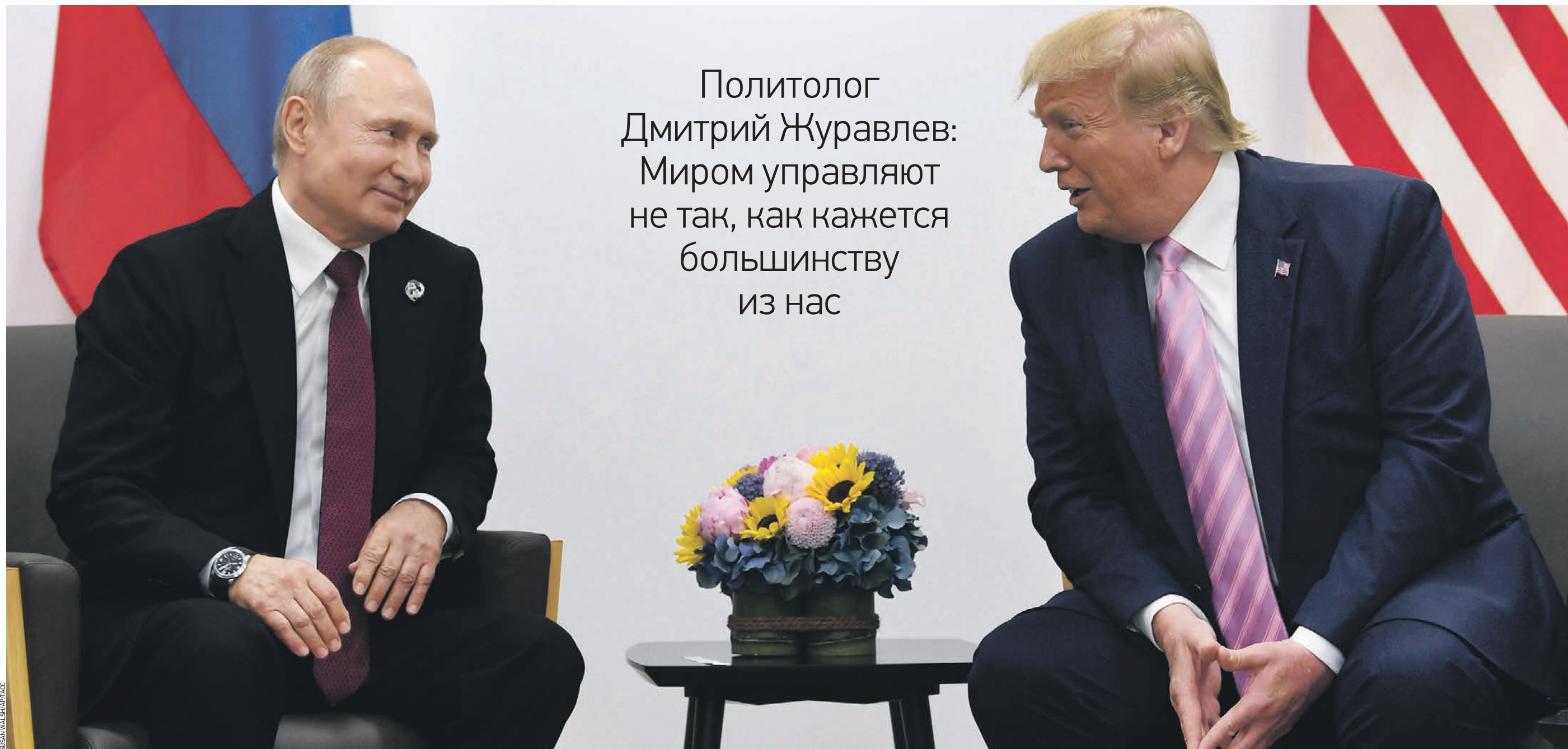
16 июля 2018 года состоялась первая полноформатная встреча лидеров двух стран — Президента России Владимира Путина (слева) и Президента США Дональда Трампа