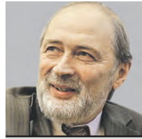
РОМАН ВИЛЬФАНД НАУЧНЫЙ РУКОВОДИТЕЛЬ ГИДРОМЕТЦЕНТРА РОССИИ

Тем не менее у нас есть данные, опираясь на которые можно дать условный прогноз на ближайшие пять лет. Тенденция глобального потепления становится все более актуальной. Мы предполагаем, что к 2025 году температура воздуха в Москве увеличится в целом на 1,5–2 градуса. Вероятность этого выше 40 процентов. Такое было трудно представить еще десять лет назад, но, к сожалению, человек «покоряет» природу. В связи с этим, я считаю, необходимо приложить максимум усилий, чтобы остановить глобальное потепление. Ведь оно сильнее, чем на другие страны, влияет на Россию. Это обусловлено географическим положением нашей Родины. Россия — большая, по большей части северная страна: 18 процентов ее территории находятся в Арктике. А потепление идет быстрее именно в полярных широтах. Поэтому мы должны сделать все, чтобы затормозить этот процесс. Повышение средней температуры не должно превысить двух градусов к концу XXI века. К этому надо стремиться.