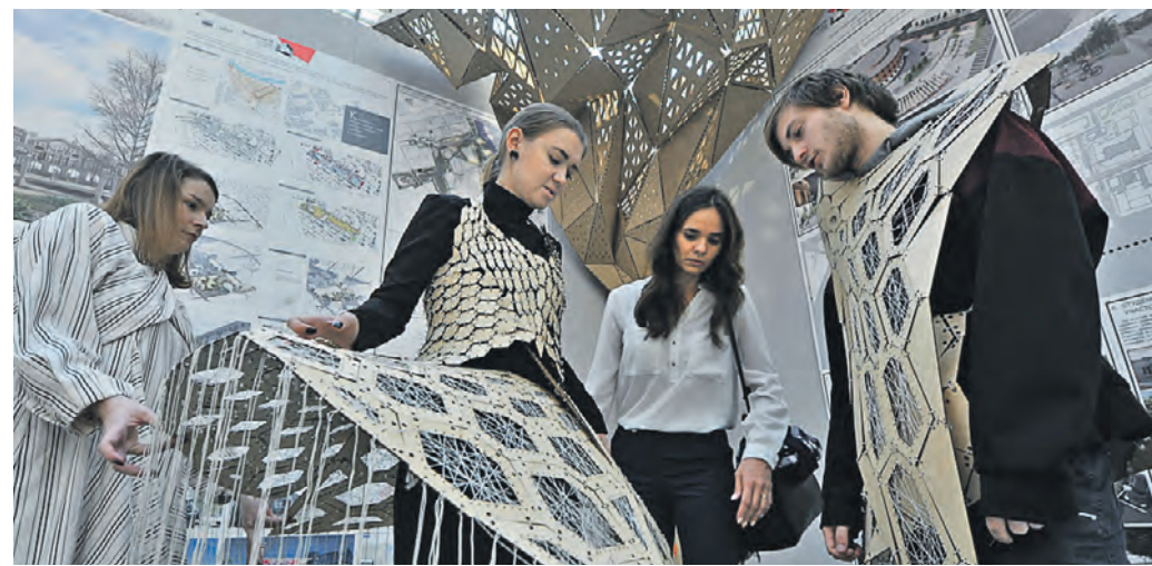
17 октября 2019 года 15:10 Молодые архитекторы на открытии Международного архитектурного фестиваля «Зодчество» в Гостином Дворе