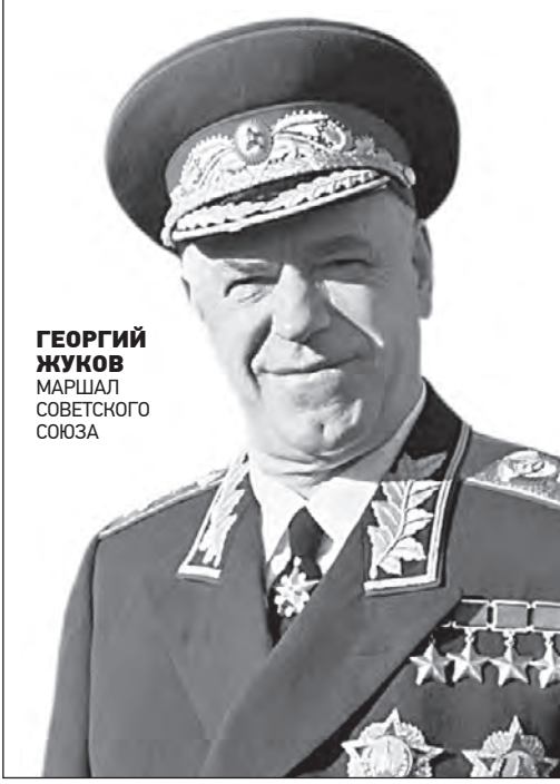
ГЕОРГИЙ ЖУКОВ МАРШАЛ СОВЕТСКОГО СОЮЗА

Народ, переживший однажды большие испытания, будет и впредь черпать силы в этой победе.