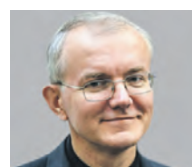
ОЛЕГ ШЕИН ВИЦЕ-ПРЕЗИДЕНТ КОНФЕДЕРАЦИИ ТРУДА РОССИИ

Не вижу ничего хорошего в этом проекте. Думаю, он не будет пользоваться популярностью. На мой взгляд, информация об усопших родственниках слишком личная. Конечно, некоторые могут привести в пример проект «Дорога памяти», где собраны фотографии и данные о тех, кто погиб во время Великой Отечественной войны. Но это совершенно другая история. Думаю, основная цель этого нового «цифрового кладбища» — заработать на нем денег. А еще он может быть использован злоумышленниками. Например, люди, находящиеся в плохих отношениях с усопшими, или просто «шутники» могут заказать атаку ботов, которые будут оставлять на сайте негативные комментарии об умершем. Это как минимум будет неприятно его семье и родным, не говоря уже о том, что это может испортить репутацию человека. Да и в целом этот сервис, на мой взгляд, противоречит основным культурным традициям и ценностям, которые существуют у нас в стране вне зависимости от конфессий. Не думаю, что проект будет использоваться в благих целях. Мне он кажется просто неумным, и о нем в скором времени забудут.