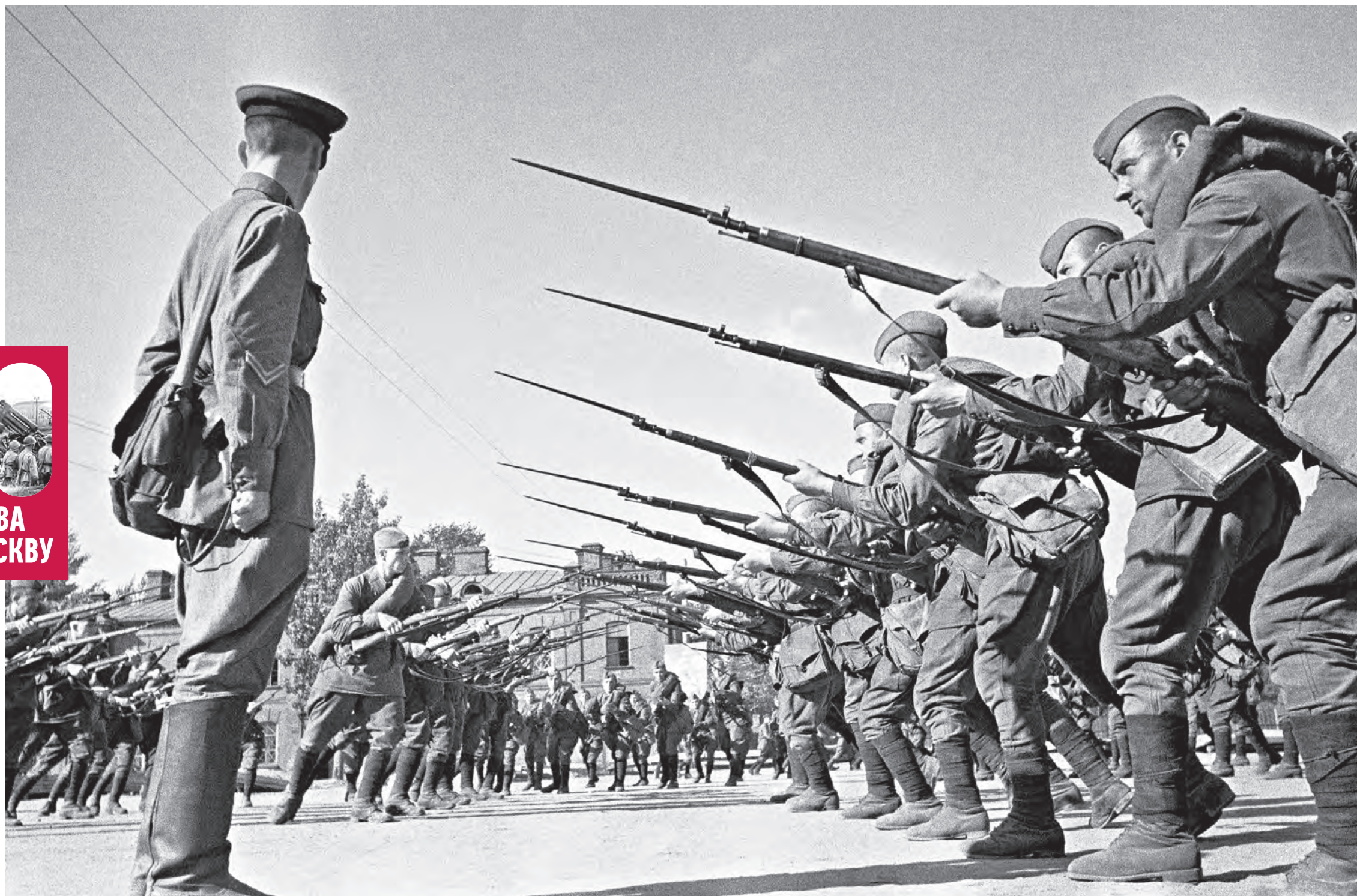
30 августа 1941 года. Москва. Казармы Н-ского полка им. Ворошилова. Обучение бойцов перед отправкой на фронт

Опасность была предусмотрена заранее. Действиям при объявлении воздушной тревоги население столицы обучалось еще в предвоенные годы. С 1935-го в Москве в ходе учебных тревог отключалась подача электроэнергии: городские службы учились действовать в условиях энергоблокады. Массово строились бомбоубежища. Когда грянула война, уже 2 июля 1941 года Совет народных комиссаров СССР