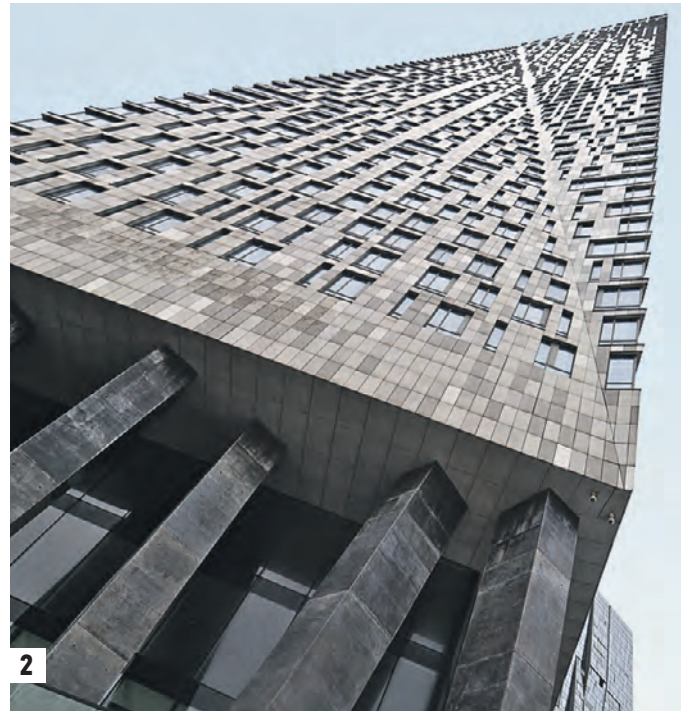
6 апреля 2021 года 11:22 Дом с ярким фасадом на улице Свободы, 67а, построен по программе реновации (1) Одним из самых интересных экспертов называют проект дома на Мосфильмовской (2)

ний, которые с другими не спутаешь. Это, например, дом на Мосфильмовской, идеально вписавшийся в облик Воробьевых гор. Или Садовые кварталы в Хамовниках: здания оригинального вида.