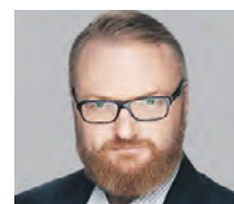
ВИТАЛИЙ МИЛОНОВ ДЕПУТАТ ГОСУДАРСТВЕННОЙ ДУМЫ РОССИИ

вечности. Этот вопрос всегда тревожит наше общество, люди не хотят думать о том, что они появляются на свет, живут, а потом просто исчезают. Возможно, чтобы решить этот вопрос, и был создан проект. Поскольку уже большая часть жизни современного человека оцифрована, архивирована, сфотографирована, можно считать, что это некая квазизамена идеи вечности. Даже неверующие люди хотят оставаться в памяти потомков, хотят таким образом жить и после смерти. Так что такой вариант нельзя осуждать или ругать. Какой-то угрозы от этого я не вижу. Это просто вопрос сентиментальности, родовой памяти, почитания покойных родных. А в подключении цифровых технологий к этому процессу нет ничего негативного.