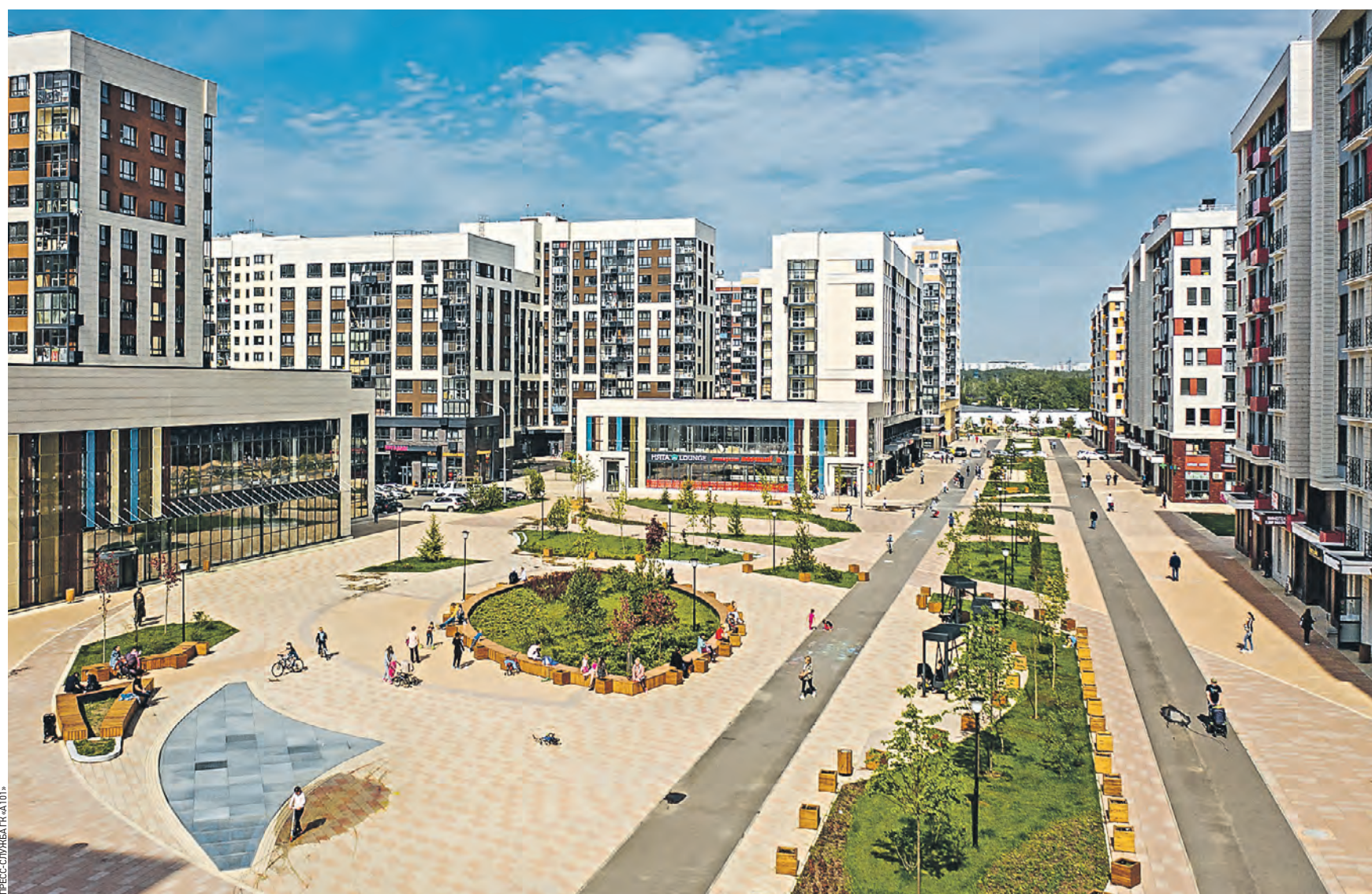
30 мая 2021 года 15:39 Первый район жилого комплекса «Испанские кварталы» в Новой Москве, в основу которого изначально заложен принцип комплексного подхода

Жилой комплекс «Прокшино» в рамках первой очереди предполагает строительство 663 тысячи квадратных метров недвижимости — жилых домов, объектов торговли и услуг, образовательных центров, детских и т.п. Важный бонус — хорошая экология: