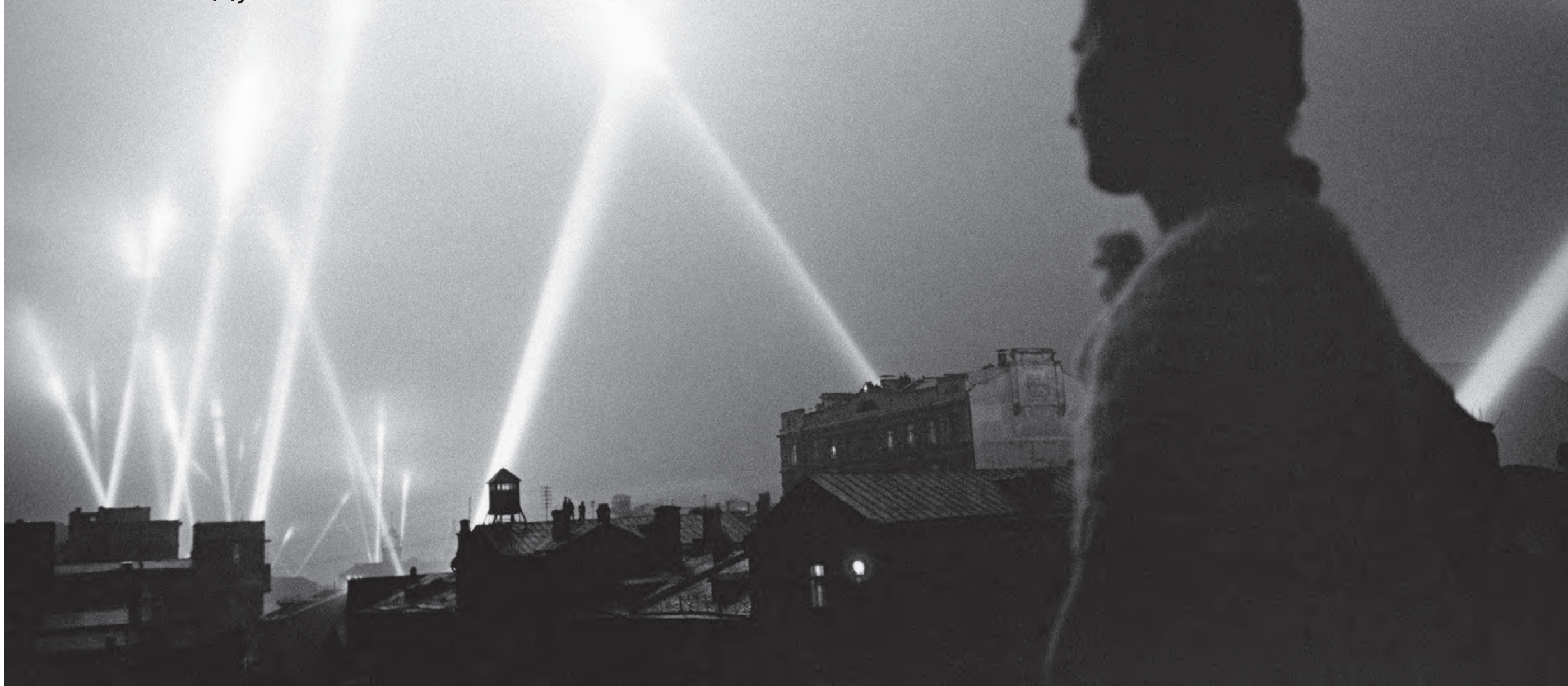
Июль 1941 года. Лучи прожекторов войск противовоздушной обороны освещают ночное московское небо

Как спасали Москву от первых бомбежек в 1941 году