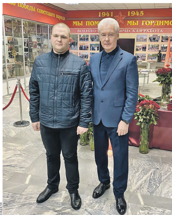
Вчера 17:35 Мэр Москвы Сергей Собянин (справа) и старший лейтенант полиции Георгий Домолаев

▶ МЭР ПОСЕТИЛ РЕЗЕРВНЫЙ ГОСПИТАЛЬ → СТ. 2 ▶ СЛЕДОВАТЕЛИ ДОПРΟΣИЛИ СТРЕЛКА → СТ. 4