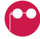
НУ И КАК ВАМ?

Над проектом трудятся студенты курса «Маркетинг и бренд-менеджмент». Неофициальное название команды — «Интеллектуальный спецназ». Ребята так называются, потому что они готовы оперативно решать самые нестандартные задачи. Дизайнеры разрабатывают рекламную концепцию разных объектов — зон отдыха, брендов, коммерческих компаний. Их очередная цель — музей-заповедник «Кузьминки-Люблино». На протяжении девяти месяцев молодые специалисты будут работать над программой его продвижения. Первый этап программы — исследовательский — уже стартовал.