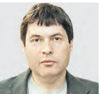
АЛЕКСАНДР ЛОСОТО ОБОЗРЕВАТЕЛЬ

Мнение колумнистов может не совпадать с точкой зрения редакции «Вечерней Москвы»