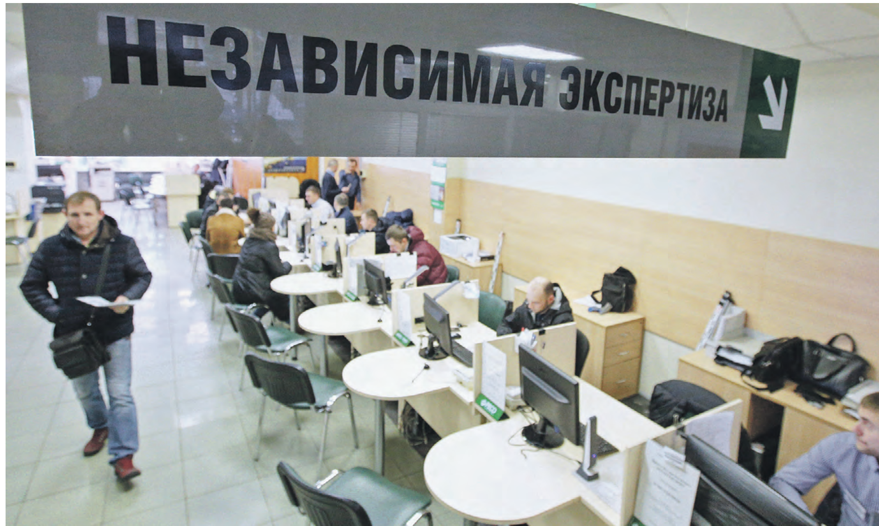
5 января 2019 года. Оформление страховых полисов ОСАГО. По мнению экспертов, большая часть страховщиков, заявляющих об убыточности этого вида страхования, лукавят с целью добиться еще большего увеличения тарифов, которые сегодня и так достаточно высоки