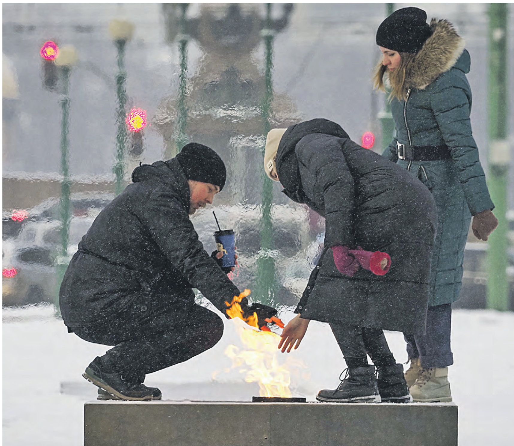
15 января 2021 года. Санкт-Петербург, Марсово поле. Одно из проявлений вандализма, возможно, даже не осознаваемого подростками: отчего не согреть руки у Вечного огня?