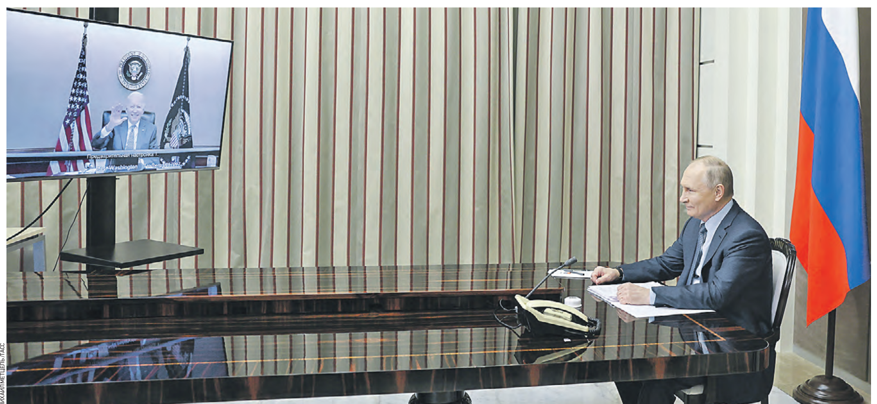
7 декабря. Россия. Сочи. Президент России Владимир Путин и президент США Джо Байден (на экране по видеосвязи) во время двусторонних переговоров

тским госдолгом для граждан США, а также персональные санкции в отношении 35 российских высокопоставленных лиц и крупных предпринимателей. Впрочем, по поводу данного шага законодателей не стоит обольщаться. В любом случае его не следует расценивать как оперативную реакцию на результаты переговоров президентов, поскольку конгресс на столь оперативную реакцию не способен. Эти шаги были согласованы с администрацией раньше — и прежде всего с целью предостеречь от свободы рук в отношениях с Россией и в принятии тех действий, которые Белый дом сочтет нужными, в зависимости от исхода переговоров с Путиным и дальнейших действий Москвы. То, что продолжительность беседы на фоне накопившихся проблем составила всего два часа, наверное, следует считать не очень хорошим признаком. Двух часов достаточно, чтобы каждой из сторон подробно изложить свою ультимативную позицию и набор угроз, но кажется недостаточным для того, чтобы подробно о чем-нибудь договориться (для сравнения, прошедшие также в видеоформате беседа Джо Байдена с руководителем КНР Си Цзиньпином, в отношении с которым проблем тоже хватало, длился в середине ноября 3,5 часа, а пресс-релиз Белого дома по его итогам был раз в 5 длиннее, чем нынешнее 13-строчное сообщение). Собственно,