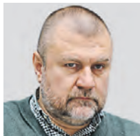
КИРИЛЛ КАБАНОВ ПРЕДСЕДЕТЕЛЬ НАЦИОНАЛЬНОГО АНТИКОРРУПЦИОННОГО КОМИТЕТА

Москва есть и будет субъектом России с самым высоким уровнем коррупционного риска. Что бы ни происходило в стране, это не изменится. В столице сосредоточены и федеральные, и региональные финансовые потоки. Риск злоупотреблений создает высокая концентрация бюджетных средств. Стоит отметить, что ситуация в Москве в последние годы изменилась в лучшую сторону. Но остается возможность злоупотреблений в Жилищно-коммунальном комплексе, проектах цифровизации, отчасти в дорожном строительстве. В ЖКХ существует огромное количество объектов, которые крайне сложно контролировать. А как только контроль уменьшается, сразу увеличивается число злоупотреблений. Бывает, в столице реализуются программы с непрозрачными схемами. В сфере цифровизации создаются дублирующие проекты. Чтобы пресечь это полностью, должна быть постоянная система контроля и мониторинга.