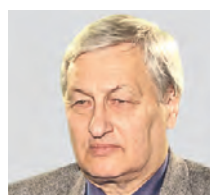
ЛЕОНИД РЕШЕТНИКОВ ГЕНЕРАЛ-ЛЕЙТЕНАНТ СЛУЖБЫ ВНЕШНЕЙ РАЗВЕДКИ РОССИИ ВОТСТАВКЕ

Но пока инициативы по избавлению нашей страны от ленинского наследия будут исходить от потомков комиссаров, таких, как Николай Сванидзе, они будут отодвигаться. Памятники сносить нужно, но вместе с этим необходима огромная разъяснительная работа. Но пока анти-советский дискурс в руках либеральной клики, которая ненавидит русский народ, чтобы снести простым людям, что отказ от коммунистической символики и названий пойдет на пользу, довольно трудно.