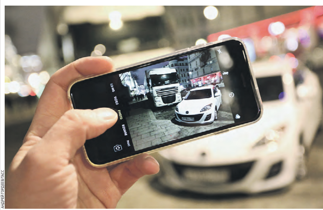
11 ноября 2021 года. Житель столицы с помощью приложения «Помощник Москвы» фиксирует нарушение ПДД. Скоро подобное приложение будет одно для всей страны

За нарушения Правил дорожного движения водителей будут наказывать сами граждане с помощью нового мобильного сервиса. Президент поручил правительству до 1 июня 2022 года закончить работу над внесением в законодательство соответствующих поправок.