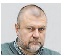
КИРИЛЛ КАБАНОВ ПРЕДСЕДАТЕЛЬ НАЦИОНАЛЬНОГО АНТИКОРРУПЦИОННОГО КОМИТЕТА

Даже 30 миллионов рублей — это незначительная сумма для экономики целой страны. В Великобритании, Швейцарии, Италии и других государствах тоже есть такая практика, но для получения вида на жительство там нужно вложить намного больше сумм. А в России, получается, любой, кто откроет ларек с шаурмой или другой мелкий бизнес, уже сможет обрести вид на жительство. И тут вопрос, кого мы хотим привлечь: мелких торговцев или реальных инвесторов? Получается, что так почти любой сможет купить вид на жительство, в том числе и те, кто хочет скрыться в России. Люди, которые имеют криминальное прошлое, спокойно найдут такую сумму денег. А значит, может быть приток криминальных группировок.