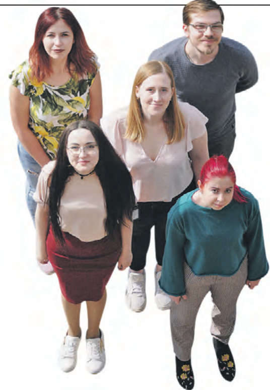
Корреспонденты «ВМ» ДАРЬЯ ПИОТРОВСКАЯ, АЛЕКСАНДР КУДРЯВЦЕВ, ИРИНА КОВГАН, ВЕРОНИКА УШАКОВА, ЮЛИЯ ПАНОВА