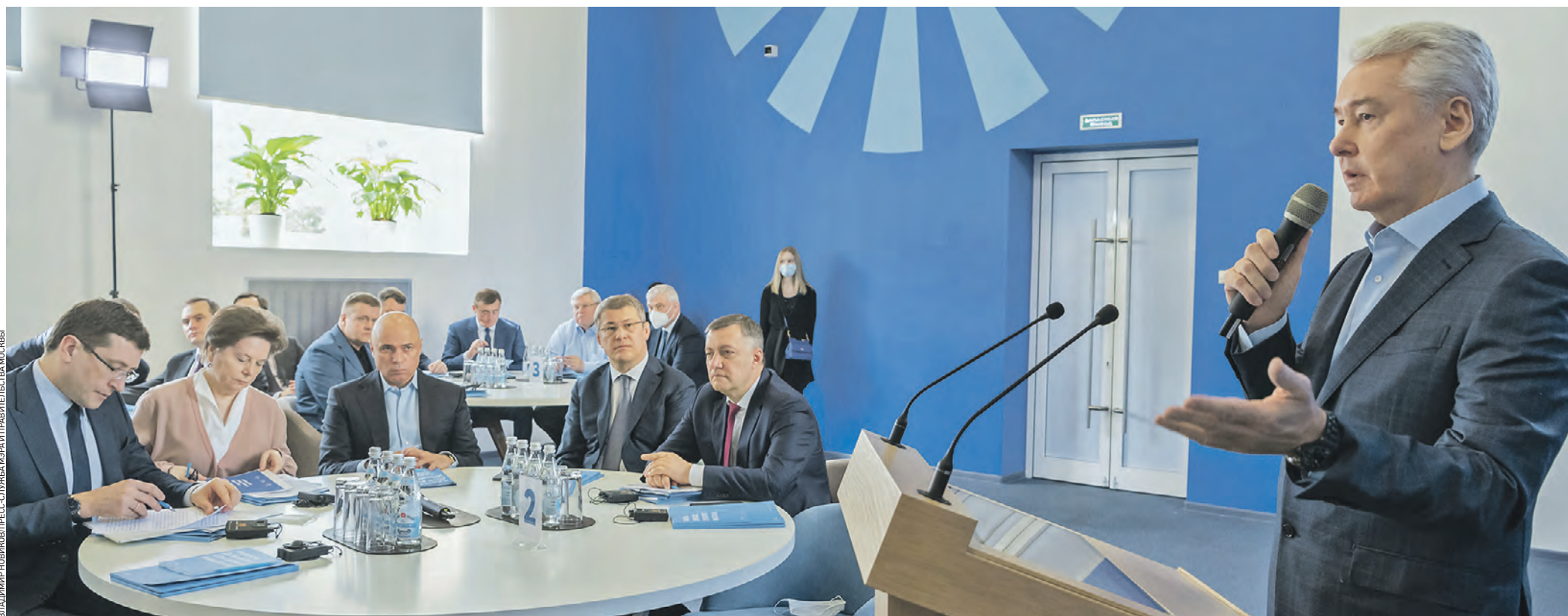
Вчера 10:07 Мэр Москвы Сергей Собянин (справа) выступает на семинаре-совещании по подготовке совместного заседания президиума Госсовета Российской Федерации и автономной некоммерческой организации «Агентство стратегических инициатив по продвижению новых проектов»

поддержка Вчера мэр Москвы Сергей Собянин выступил на семинаре-совещании по подготовке заседания президиума Госсовета РФ и Агентства стратегических инициатив по продвижению новых проектов, который был посвящен актуальным социальным вопросам.