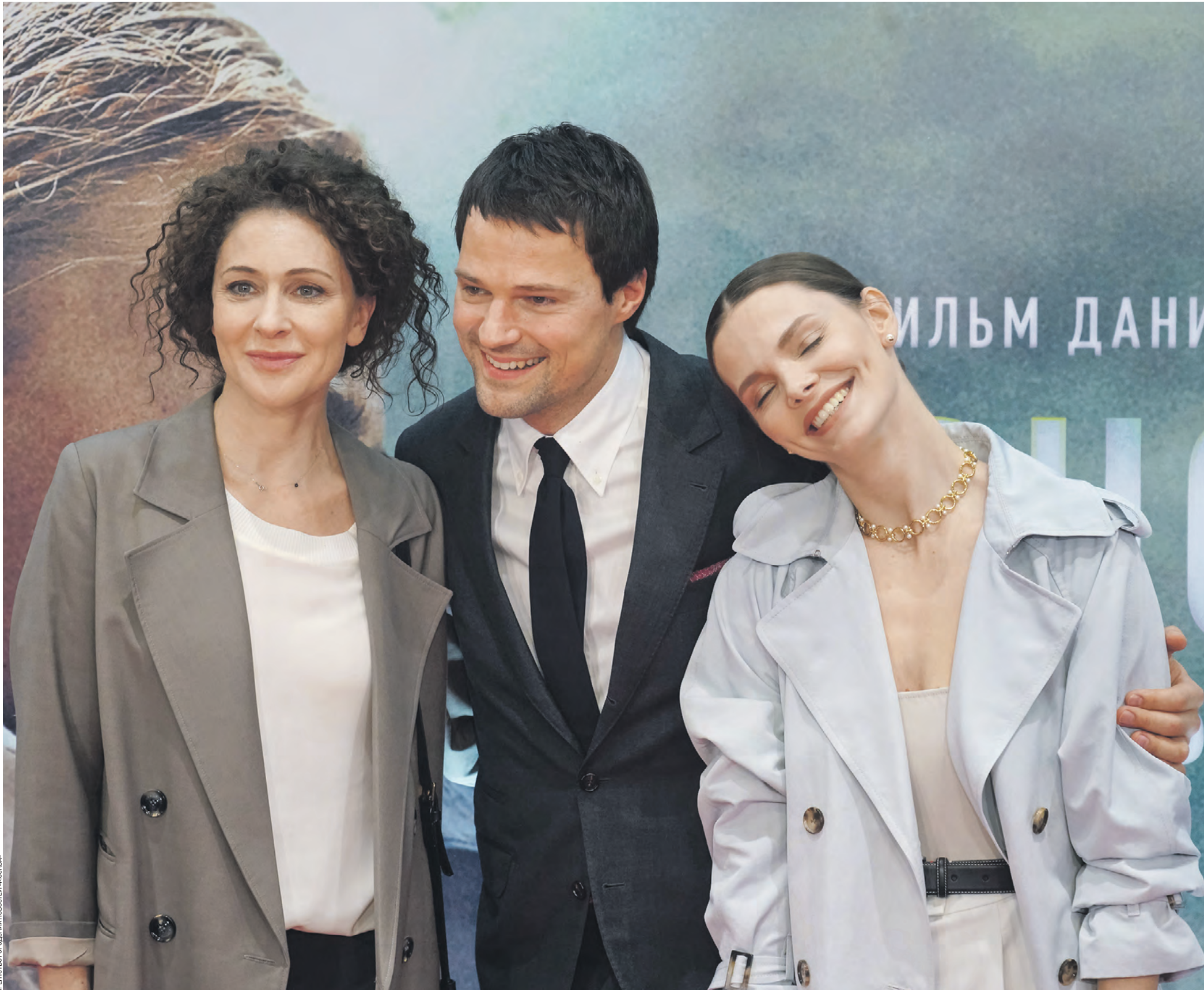
АГЕНТСТВО ПРОМОКОММУНИКАЦИИ «МОСКВА»