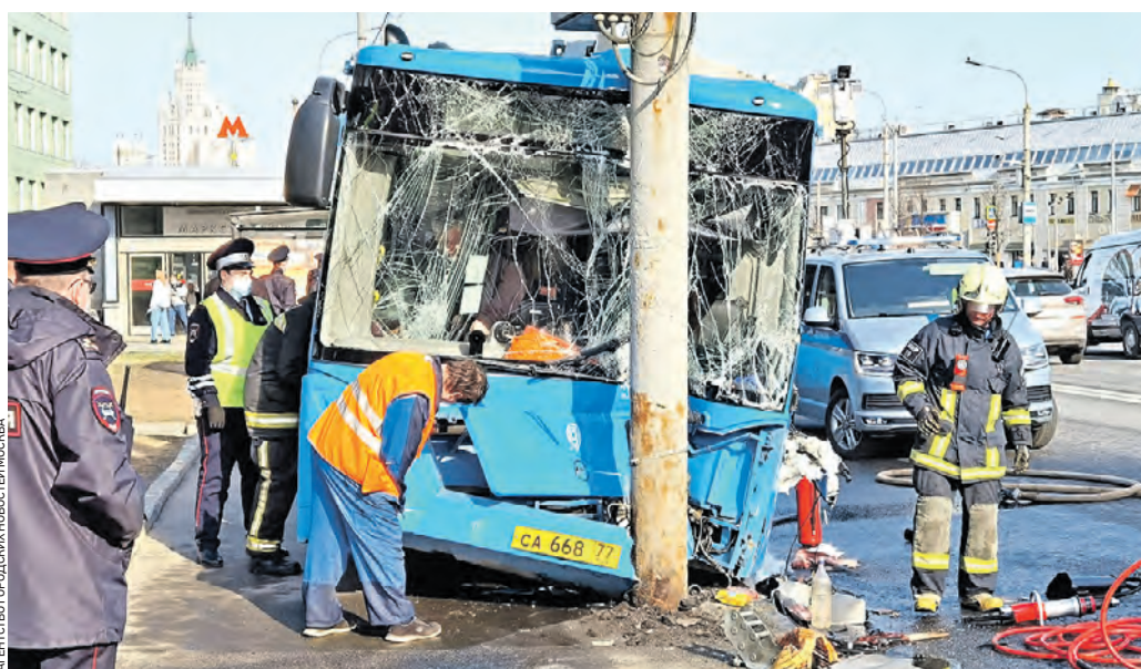
Вчера 09:47 Рейсовый автобус врезался в столб около остановки на Марксистской улице. Столичные полицейские и спасатели осматривают место ДТП