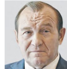
Петр Бирюков. На вылетных магистралях с интенсивным движением выбирают щебеночно-мастичный состав, повышающий прочность асфальта в полтора раза по сравнению со смесью на основе гранитного щебня. В Комплексе городского хозяйства сообщают, что все работы идут в соответствии с утвержденным графиком. Ремонт ведут преимущественно в ночное время, когда машин на дорогах меньше.

В ходе подготовки к зиме в Москве обновили 16 миллионов квадратных метров асфальта. Вчера об этом сообщил заместитель мэра Москвы по вопросам ЖКХ и благоустройства Петр Бирюков (на фото).