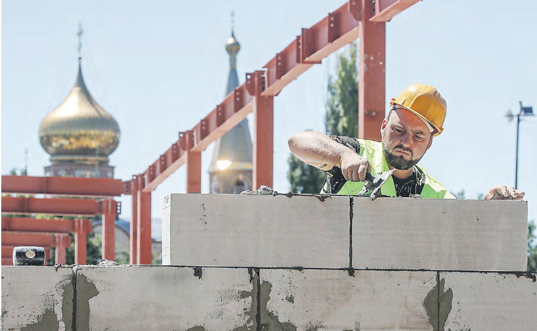
13 июля 16:11 В освобожденном от националистов Мариуполе началось строительство нового жилого микрорайона. Сейчас город восстанавливается после боев, а правоохранительные органы расследуют преступления, которые совершали на этой территории украинские солдаты

Тем временем в Херсонской области ВСУ обстреляли мост через Днепр. Однако пять из шести ракет были сбиты системами ПВО. — Мост является очень важным объектом. В мост не попали, движение идет, по трассе машины едут, — уточнили в пресс-службе военно-гражданской администрации региона. За прошедшие сутки украинские военные выпустили 26 мин по поселку Доломитное в ДНР. Также рано утром три снаряда «прилетело» по Петровскому району Донецка и шесть снарядов — по Пантелеймоновке.