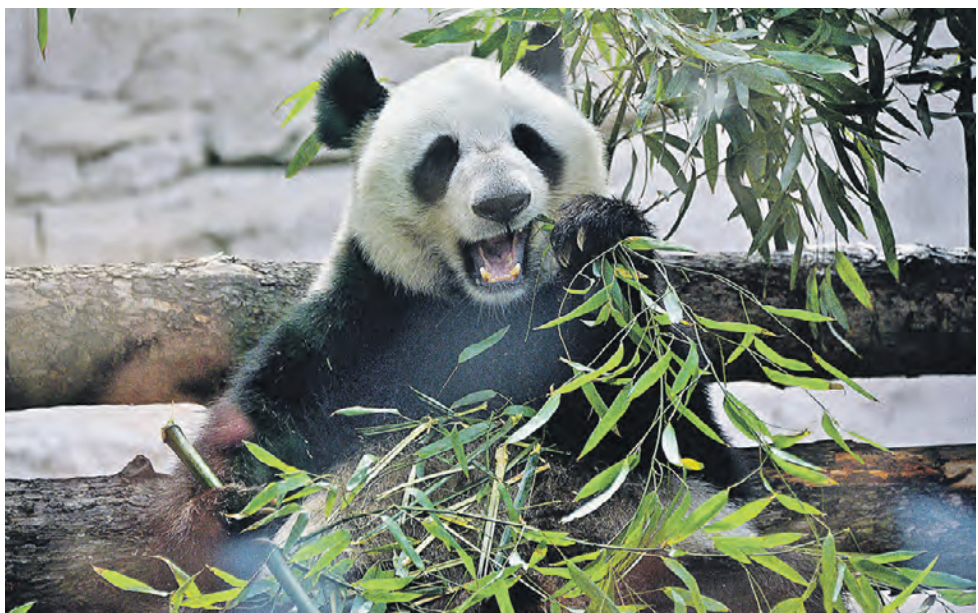
Вчера 14:10 Панда Диндин из Московского зоопарка лакомится свежими листьями бамбука. В День защиты детей одним из мероприятий в учреждении было кормление самки Диндин и самца Нуи на глазах у юных зрителей. Для животных сделали вкусные подарки из бамбука, овощей и фруктов