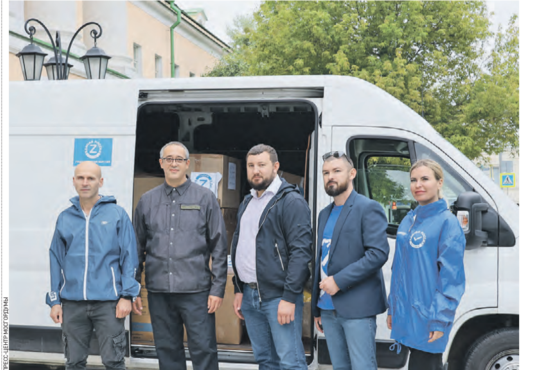
Вчера 14:37 Председатель Мосгордумы Алексей Шапошников (второй слева) и глава муниципального округа Царицыно Дмитрий Хлестов (в центре) вместе с волонтерами отправляют гуманитарный груз

В Москве продолжают собирать гуманитарный груз для жителей приграничных территорий и новых регионов России. Регулярно из столицы отправляются необходимые людям товары: продукты питания, одежда, средства личной гигиены и многое другое. Оказать посильную помощь могут как обычные москвичи, так и представители бизнеса, городских организаций. Это еще одна проверка на неравнодушие, и мы готовы доказать, что своих не бросаем.