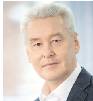
СЕРГЕЙ СОБЯНИН МЭР МОСКВЫ

В Москве растет число туристов и бизнес-поездок. Мировой туризм до сих пор восстанавливается после пандемии. Для Москвы 2019 год был рекордным по внутреннему турпотоку. Но в 2023-м мы приняли на 22 процента больше гостей. Число бизнес-поездок увеличилось на 28 процентов. Мы добились этого благодаря постоянному улучшению городской инфраструктуры и ориентации на глобальные тренды.