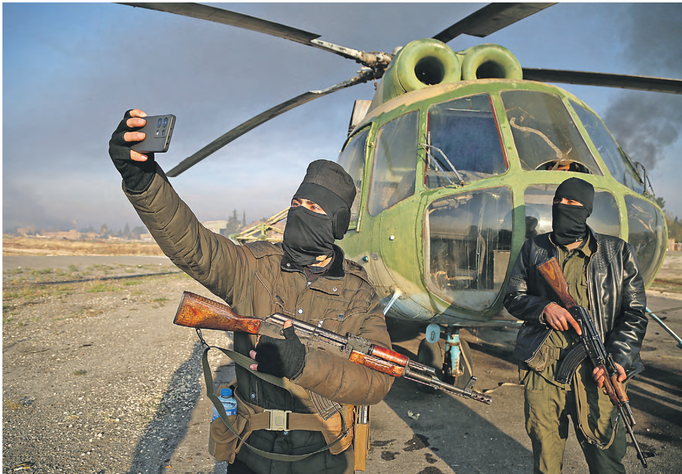
2 декабря. Сирийские бойвики запечатлевают свои победы после взятия под контроль военных и гражданских аэропортов в Алеппо. Так в конце года на карте мира появилась еще одна горячая точка

Пока такого решения не принято, пока число поставленных ВСУ дальнебойных ракет составляет еще не сотни и тысячи, а десятки, конфликт надо завершать. Иначе, по мнению