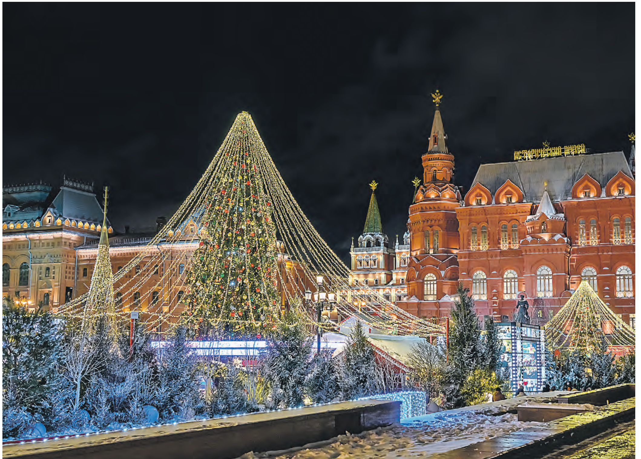
Маневренная площадь, которую на праздничном оформили в стилистике телепередачи «Голубой огонек», привлекает гостей и новогодними украшениями. Особенно красиво здесь вечером, когда световые шатры укрывают ели сотнями разбегающихся во все стороны золотых огоньков, а медиаэкраны мерцают загадочным голубым светом.