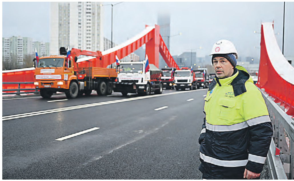
26 декабря. Первой по новому мосту через Москву-реку в створе улицы Мяснищева традиционно проехала автоколонна, украшенная флагами. Строители сдали объект в Новому году

Вдоль по набережной Входящим в Северо-Западный округ привели в порядок семь знаковых объектов. В Южном Тушине бла-