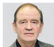
СЕРГЕЙ СТАНКЕВИЧ ПОЛИТОЛОГ, ИСТОРИК

новые возможности в профессиональной сфере. У многих появится шанс на развитие карьеры. Уже в этом году был заложен фундамент по сотрудничеству с другими странами, в особенности в рамках СНГ. Также все крепче становятся партнерские отношения с Китаем. В дружественных странах открываются филиалы российских компаний, которые будут набирать сотрудников из РФ. Кроме того, в других государствах на определенные должности наших специалистов готовы принять с радостью. Так что перспектив много, рынок расширяется.