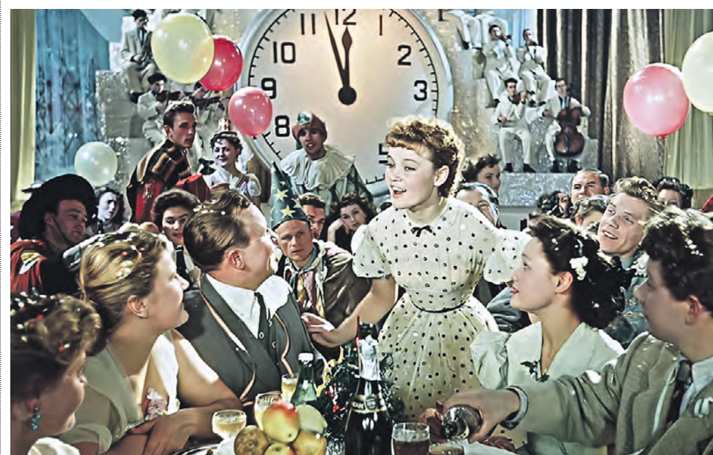
Кадр из советского фильма «Карнавальная ночь» 1956 года с актрисой Людмилой Гурченко в главной роли