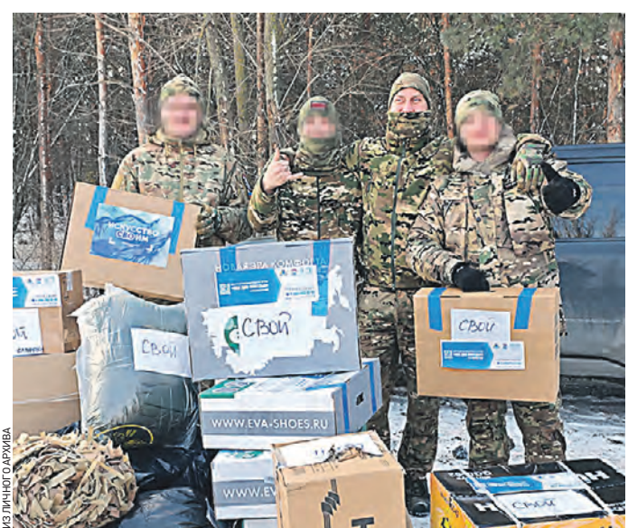
15 декабря. Бойцы спецоперации принимают гумпомощь от АНО «Солидарность»

Автономная некоммерческая организация «Солидарность» отправила бойцам юбилейный, 20-й конвой гуманитарной помощи. Помимо стандартных вещей, в него вошли сладкие новогодние подарки.