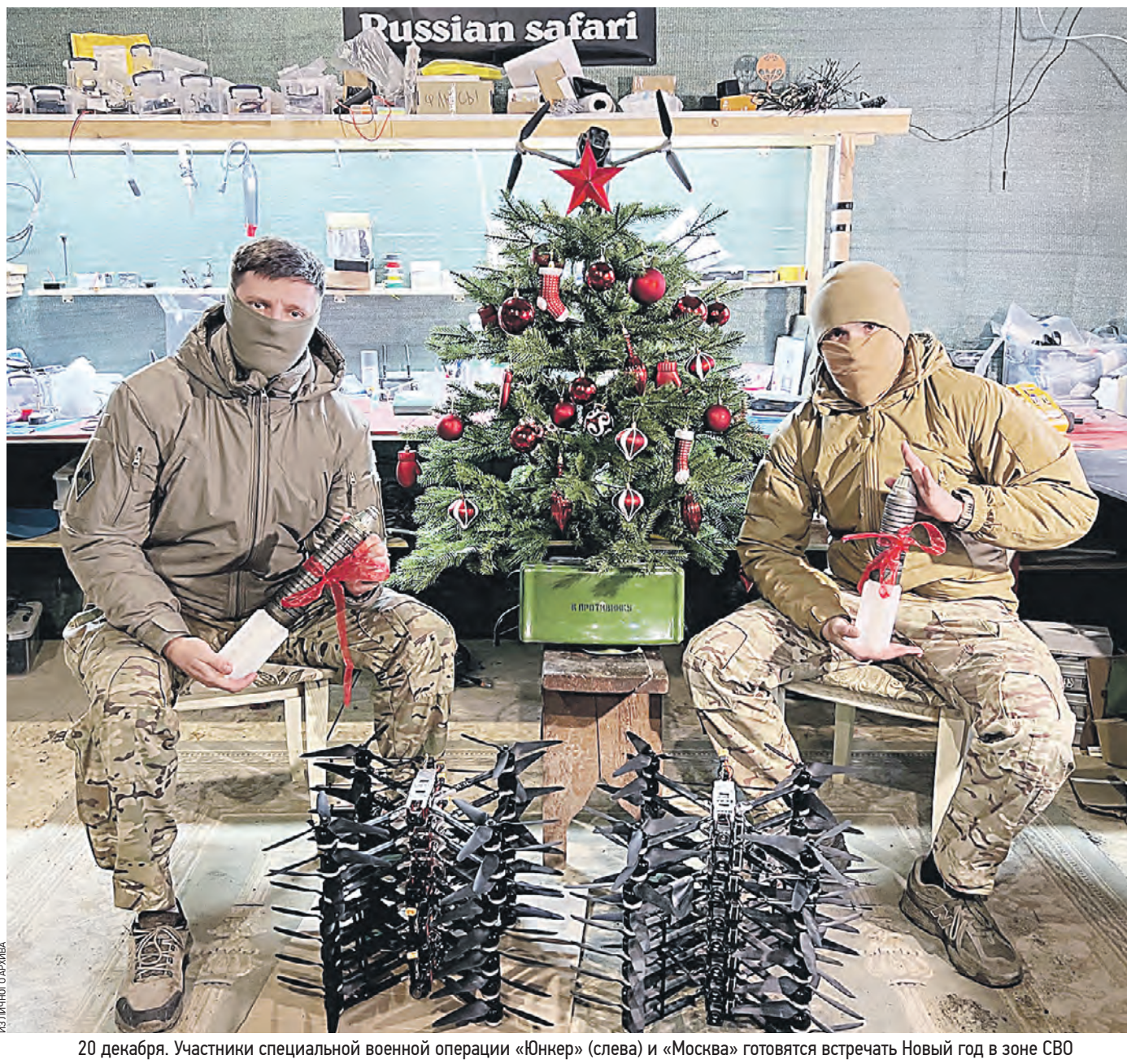
20 декабря. Участники специальной военной операции «Юнкер» (слева) и «Москва» готовятся встретить Новый год в зоне СВО

Наши бойцы сражаются с украинскими националистами и иностранными наемниками ВСУ на разных направлениях специальной военной операции. Среди них — участник СВО, действующий в Белгородской области, с позывным «Пушкин». Он рассказал «ВМ», что, участвуя в противостоянии яростному противнику «за ленточкой», они стали смелее. Отчасти это заслуга многих жителей Белгородской области, которые особенно активизировались в уходящем году, отмечает боец в беседе с журналистом. — В 2024-м мы еще лучше освоили ратное дело, стали более опытными и умелыми при выполнении боевых задач. Хотя стоит признать, что уходящий год оказался для нас довольно сложным, особенно это касается ситуации с Волчанском, — говорит «ВМ» боец с позывным «Пушкин». Здесь стоит отметить, что Волчанск для нас имеет достаточно серьезное стратегическое значение. Ведь его освобождение от украинских националистов продолжит успешное продвижение наших войск в южном направлении, о чем нередко говорил глава военно-гражданской админист-