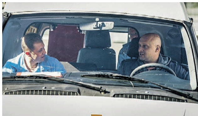
Гоша Куценко в роли Константина Кулыгина

...После того как водитель скорой Силантьич уходит на пенсию, заведующая одной из московских подстанций Ольга Арефьева представляет коллегам нового водителя — Константина Кулыгина из Новосибирска. И в первый же день с бригадой опытного Владимира