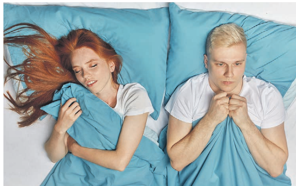
Если музыкальная горячка не отпускает даже во сне, запишитесь к психотерапевту