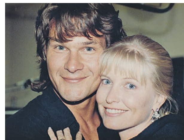
Кадр из документального фильма «Я — Патрик Суэйзи». Актер с супругой Лизой Ниemi

■ Актера Патрика Суэйзи не стало десять лет назад — 14 октября 2009 года. Его любили в нашей стране какой-то особенной любовью. Может, он просто походил на парнишку с окраины города? Когда — боец, когда — танцор, он почти всегда выходил из «киношных» неприятностей победителем и улыбался — фирменной, очень искренней улыбкой, от которой замирали сердца.