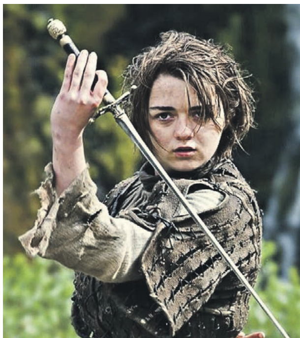
Героиня сериала «Игра престолов» Арья Старк, в честь которой пара назвала дочь