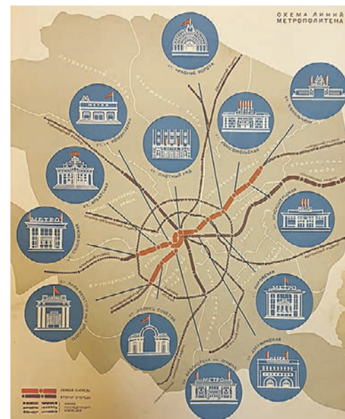
Общество коллекционеров «Наше метро»

Раритетная карта Московского метрополитена, напечатанная в 1935 году