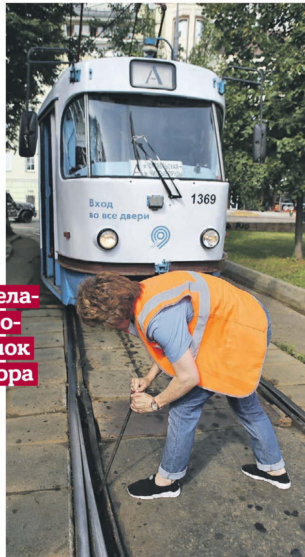
27 июля 2018 года. Водитель трамвая переключает стрелки на путях