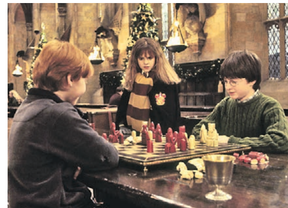
Герои фильма «Гарри Поттер и философский камень» (слева направо) Рон, Гермиона и Гарри играют в волшебные шахматы

Классические костюмы, потому что я провожу в них шахматные поединки.