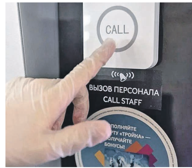
Теперь контролера-кассира в Московском метрополитене можно вызвать с помощью кнопки