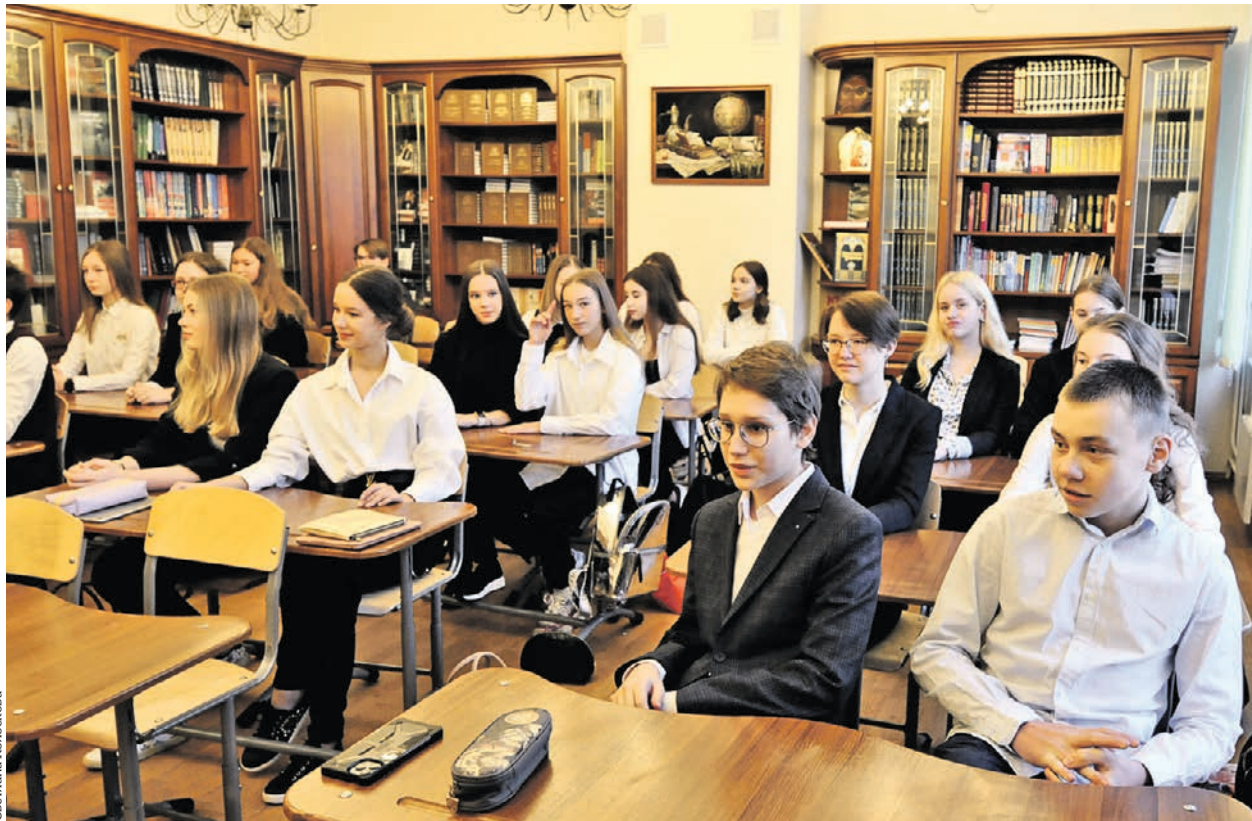
18 января 2021 года. Ученики столичной школы № 1448 впервые после долгого периода дистанционного обучения вернулись в образовательное учреждение и приступили к занятиям в обычном режиме

Столичные школьники вернулись к очному обучению