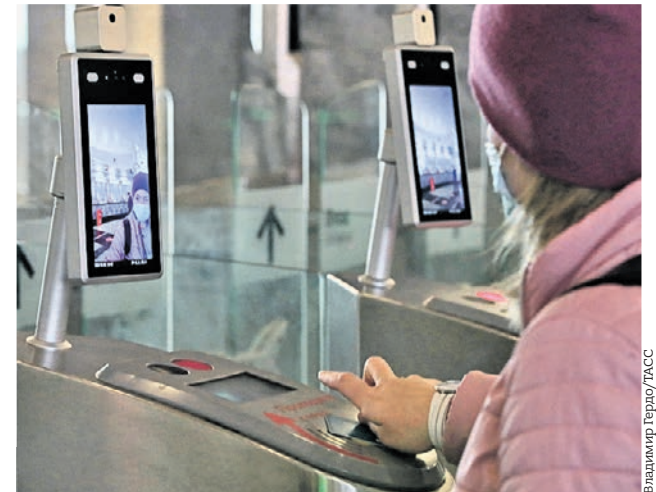
5 октября 2020 года. Турникеты на станции «Спартак» Московского метрополитена