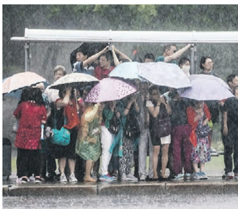
30 июня 2017 года. Москвичи прячутся от сильнейшего ливня, накравшего Москву

■ Предсказал библейский потоп. 29 июня 2017 года Тишковец написал в соцсети, что москвичей ждет библейский потоп — мощный циклон с тропическим ливнем и ураганом. Тему подхватили СМИ. Не все оценили сравнение, один священник, позже лишенный сана, по словам синоптика, даже назвал его идиотом. Но 30 июня прогноз сбывлся. Это был настоящий разгул стихии, не обошлось без пострадавших. Но благодаря новостям накануне многие смогли уберечься от опасности. Синоптик отмечает, что тщательно взвешивает все, прежде чем делать громкие заявления, ведь ошибка может стоить репутации.